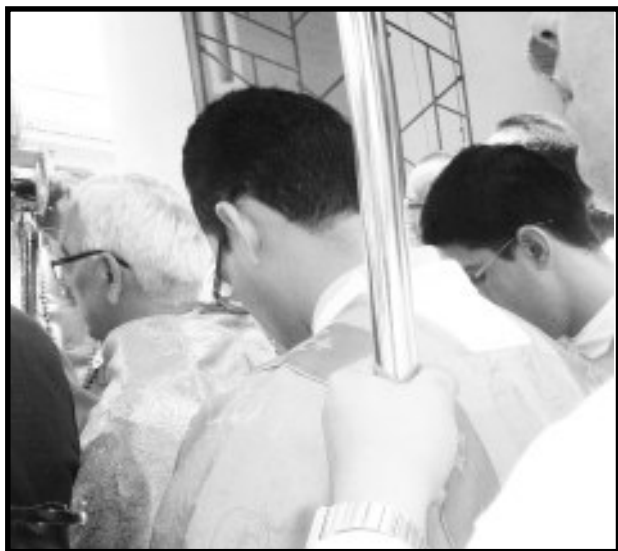
La misa la ofició Monseñor Freddy Fuenmayor obispo de los Teques.

Corpus Christi, en sus 263 años. el recorrido fue guiado por su primer Capataz, Pablo Azuaje y el primer arreador Cruz Rivas, centenares de personas vestidas de diablos danzantes recorrieron las calles del pueblo pagando las promesas , rindiéndole culto al Santísimo Sacramento