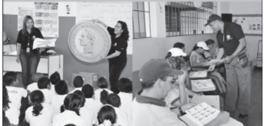
Escuela Nacional de Naiguatá, estado Vargas.