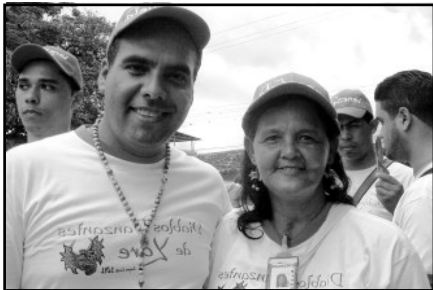
El ministro de Turismo Alejandro Fleming

Con la Presencia del ministro de Turismo Alejandro Fleming, en San Francisco de Yare se llevó a cabo la tradicional fiesta de los Diablos danzantes, como celebración del Corpus Christi.