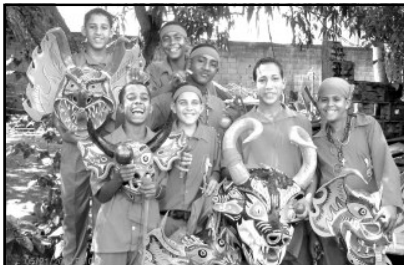
Un grupo de muchachos promesero, posan para El Tuyero ...