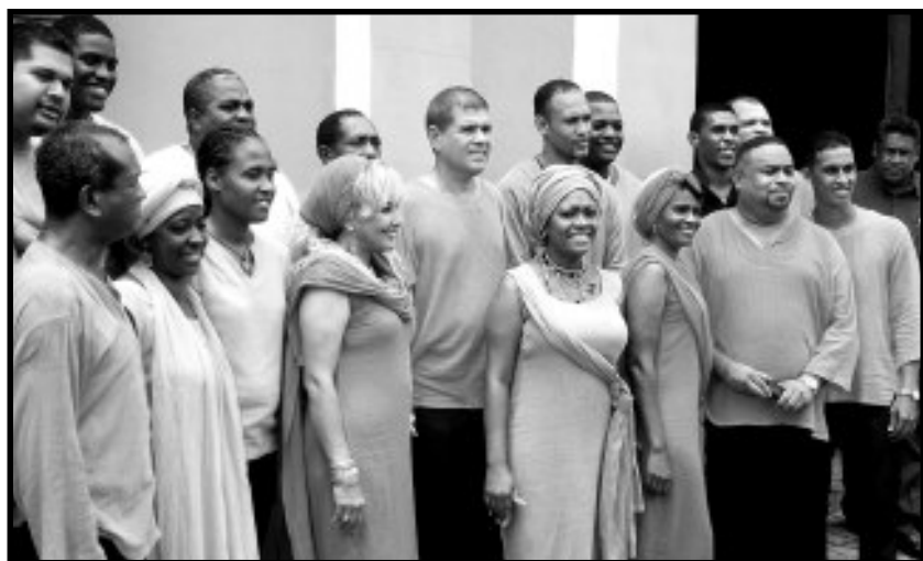
Los cantos de la misa tuvieron a cargo del grupo Afro-Barlovento de Caucagua con la banda Víctor Sousa