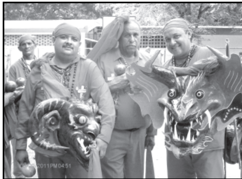
Podemos observar al Alcalde de Yare Saúl Yáñez, vestido de Diablo de Yare.

atributos turísticos con los que cuenta Venezuela. También comentó que el Gobierno Bolivariano realiza las gestiones correspondientes ante la Organización de las Naciones Unidas para la Educación, la Ciencia y la Cultura (Unesco), para que esta tradición sea reconocida como patrimonio cultural de la humanidad.