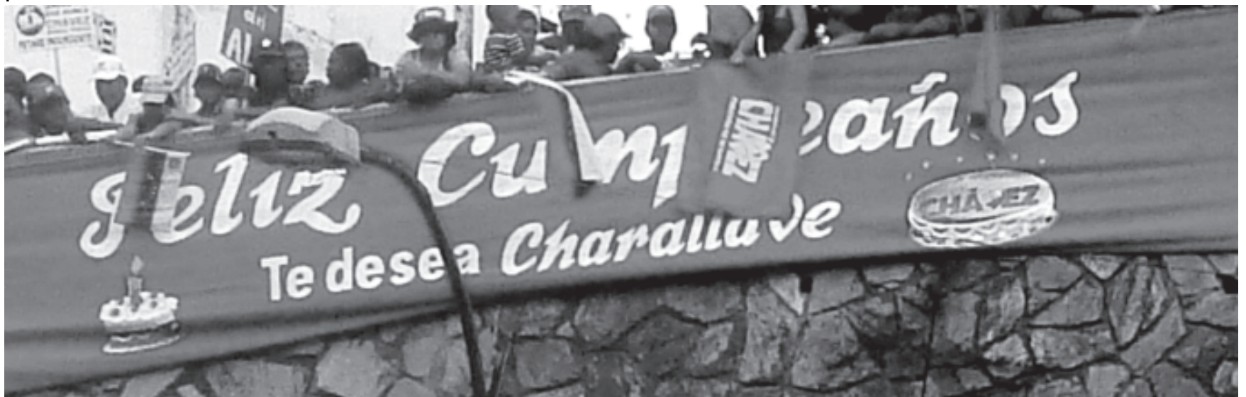
Los habitantes de Charallave se instalaron en el gran muro de Petare a primera hora de la mañana

La marcha la realizó acompañado de los partidos político El PSUV, PCV IPCN además de el vicepresidente de la República y candidato para la gobernación de Miranda Elías Jaua Nicolás Maduro, y todo el pueblo de Petare.