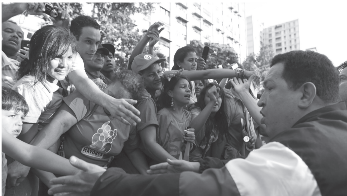
Comandante Chávez en contacto con el pueblo venezolano

Miles de personas acompañaron al candidato, Hugo Chávez, en el mitin de campaña celebrado en la parroquia Coche de Caracas, durante el cual, bailó y cantó —con Omar Enrique, Los Caudillos y Hany Kauam, y cerró con un claro mensaje ante los ataques, que en los últimos días, ha recibido el pueblo venezolano por parte de los medios de comunicación. En su discurso, ante la multitud expectante, el Presidente instó a la clase media y al pueblo en general a no dejarse engañar por la oposición. “No se dejen engatusar”, porque la Revolución “es para todos, menos para la burguesía, que se beneficia del modelo saqueador, explotador”, recalcó, durante el acto.