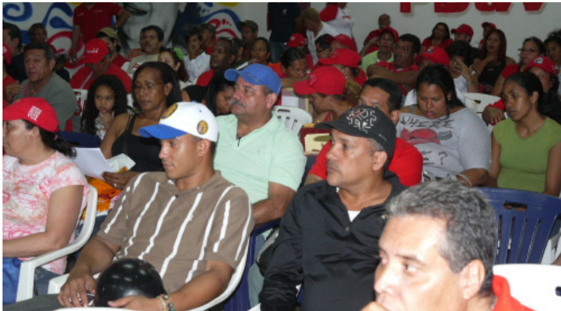
Comunidades de El Valle, Coche y Santa Rosalía se reúnen continuamente para afinar estrategias

Asimismo, el líder comunitario resaltó que la población de votantes de este circuito, que une a las parroquias: El Valle, Coche y Santa Rosalía, sobrepasa los 244 mil 165 electores y electores, que ejercen su derecho al