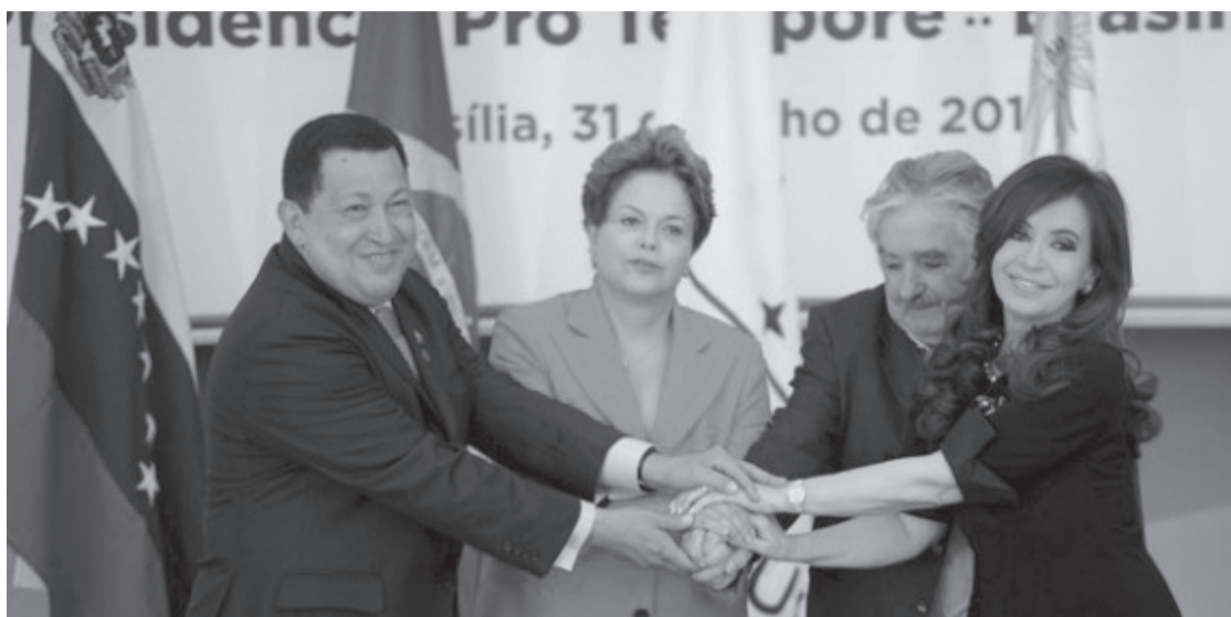
De izquierda a derecha: Los mandatarios de Venezuela, Brasil, Uruguay y Argentina

Por su parte, la presidenta Dilma Rousseff, quien asumió la dirección temporal del bloque,