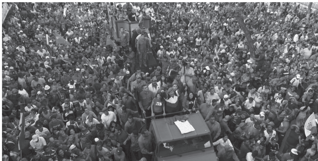
Presidente Chávez rodeado de una gran masa de seguidores en la parroquia Coche

Enfatizó que faltan dos meses y 10 días para las elecciones presidenciales, y auguró que el 7 de octubre “les vamos a propinar” a la burguesía y al imperio yanqui “la más grande de las derrotas”. También garantizó el triunfo de la Revolución “en todas las batallas que tengamos que darle a esa burguesía pitiyanqui y traidora”.