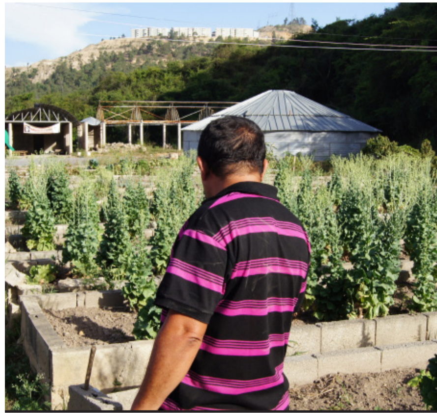
Plantas de lechugas perdidas por falta de agua

y con el apoyo del Inder, para solventar la problemática del agua, podemos obtener grandes avances en materia agrícola, pues hemos demostrado que este proyecto es totalmente viable”.