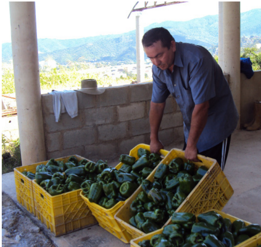
Primera recolección de pimenton más de 21 cestas fueron recogidas