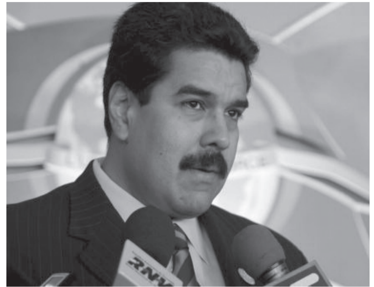
Tendrán una relación basada en el respeto

La Corte Interamericana "se convirtió en cómplice y promotora de delitos de terrorismo", manifestó el Canciller venezolano