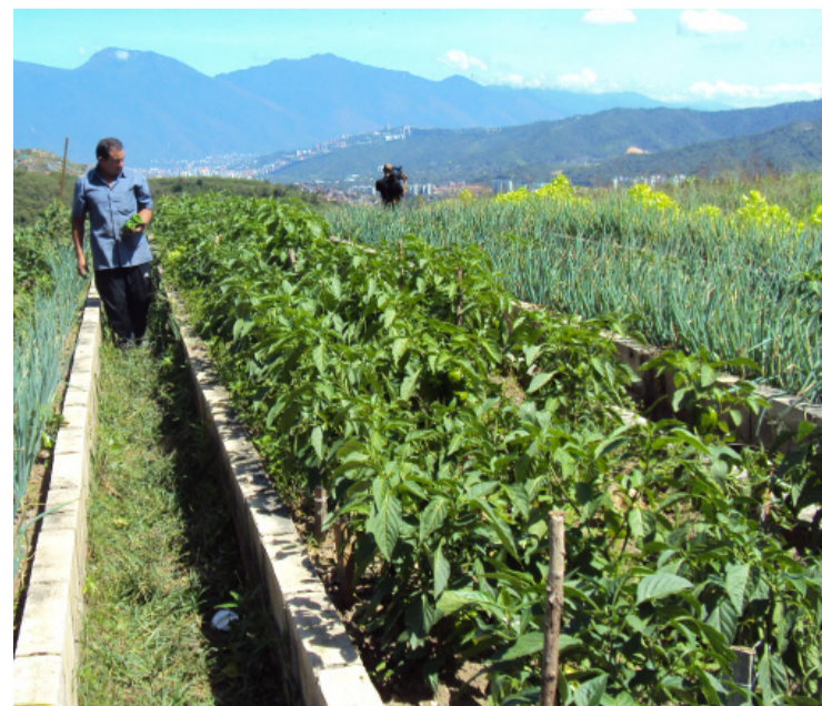
Plantas de pimentón y cebollín