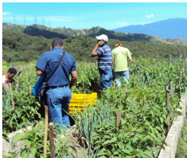
Cuando había agua las cosechas eran exitosas