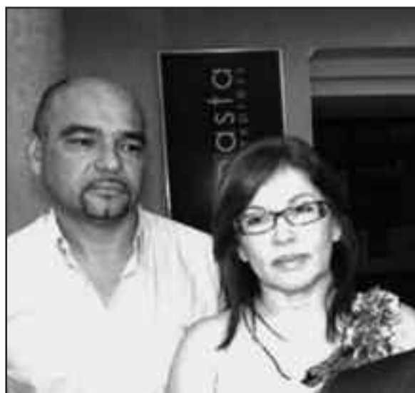
“PAR DE JOYITAS”