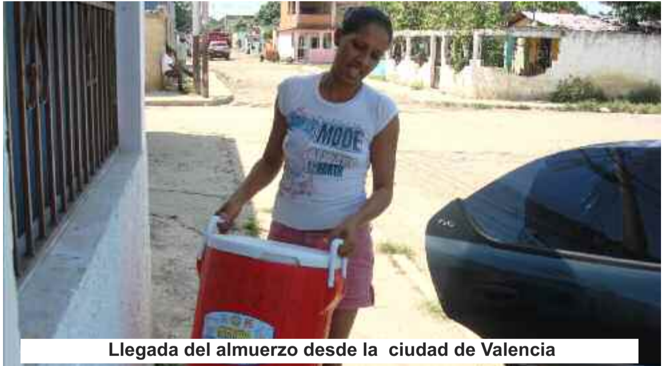
Llegada del almuerzo desde la ciudad de Valencia

De la misma manera, existen decenas de hombres y mujeres que luchan no solo un año sino toda la vida bajo el anonimato sin dejar de ser imprescindibles.