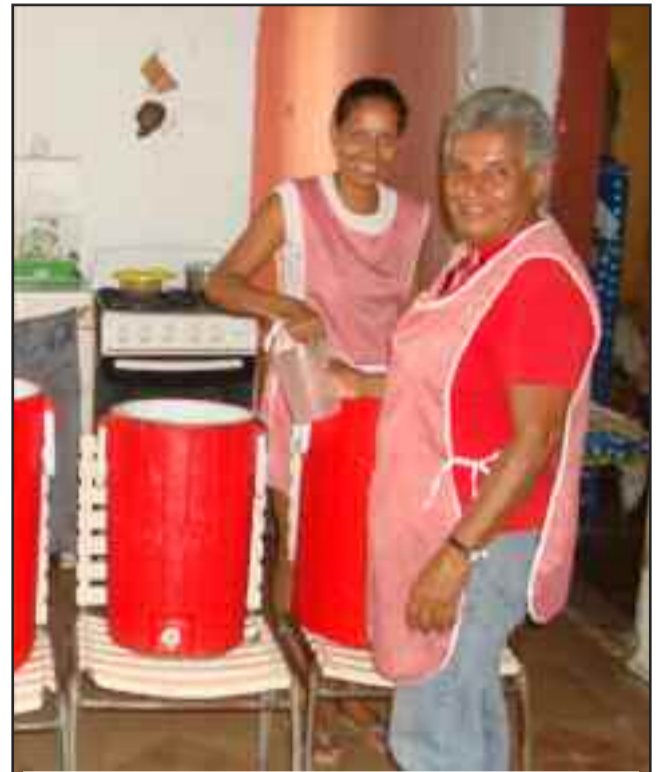
LA C. MORELA LISTA PARA ENTREGAR EL ALMUERZO A SUS 80 COMENZALES DE LA 3ra EDAD

Pero hay algo que llama la atención en las la-