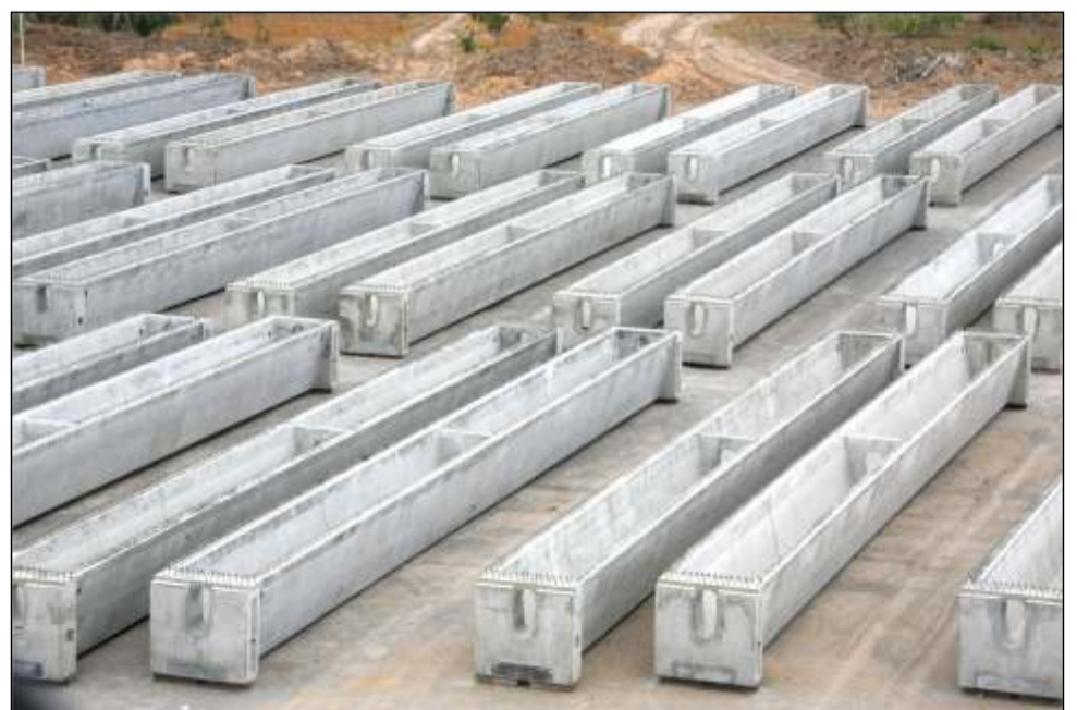
Patio de Almacenamiento Vigas Longitudinales-Pretensadas

Actualmente se están realizando tres tipos de Vigas: Laterales, Central Tipo I, Central Tipo II; a su vez las Vigas están compuestas por 4 elementos principales: el cuerpo, el cabezal central y los 2 cabezales frontales. Se pueden realizar por partes: cabezales frontales, cabezal