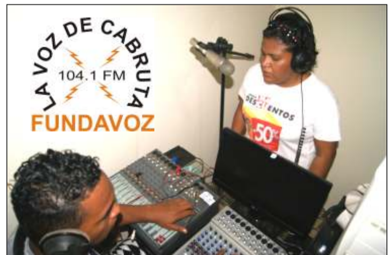
Estudio de grabación, para la producción de contenidos