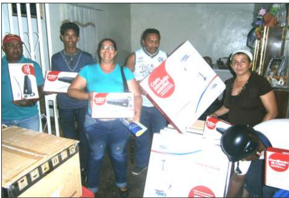
La alegría de los usuarios y usuarias al obtener tan importante herramienta para estar informados

L a antena Cantv Satelital invadió nuestra población, 50 beneficiarios se atrevieron y dieron el cambiao a la televisión satelital con la adquisición de su kit Cantv, con solo llamar al 0800-CANTVTV (0800-2268888), responder unas breves preguntas, dar un numero de contacto, tu dirección de habitación, y automáticamente el sistema genera un código de pre-selección que a los pocos días estás recibiendo la llamada de un agente Cantv y luego procedes al retiro de 2 cajas que incluyen la antena y el decodificador, lo instalas y desde ese mismo instante disfrutas de 47 canales nacionales e internacionales y 4 canales de música.