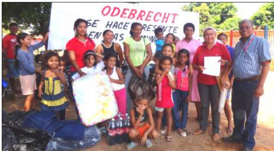
Además de los aportes sociales, se agasajó y compartió con los niños y niñas de las comunidades beneficiadas.

Las comunidades beneficiadas fueron: sector Francisco de Miranda, sector médanos de Gómez, comunidad indígena el moriche y sector la estrella.