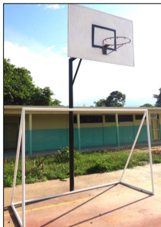
Cancha recuperada en Escuela de Terecay

Luego del acondicionamiento integral en el preescolar de Terecay, (población ribereña de Cabruta estado Guárico), donde se recuperó salones de clases, área administrativa, baños, revestimiento de pisos, colocación de manto, instalación de aguas servidas, electrificación, pintura, herrería, entre otros; actualmente se hizo la rehabilitación de la cancha deportiva de dicha institución.