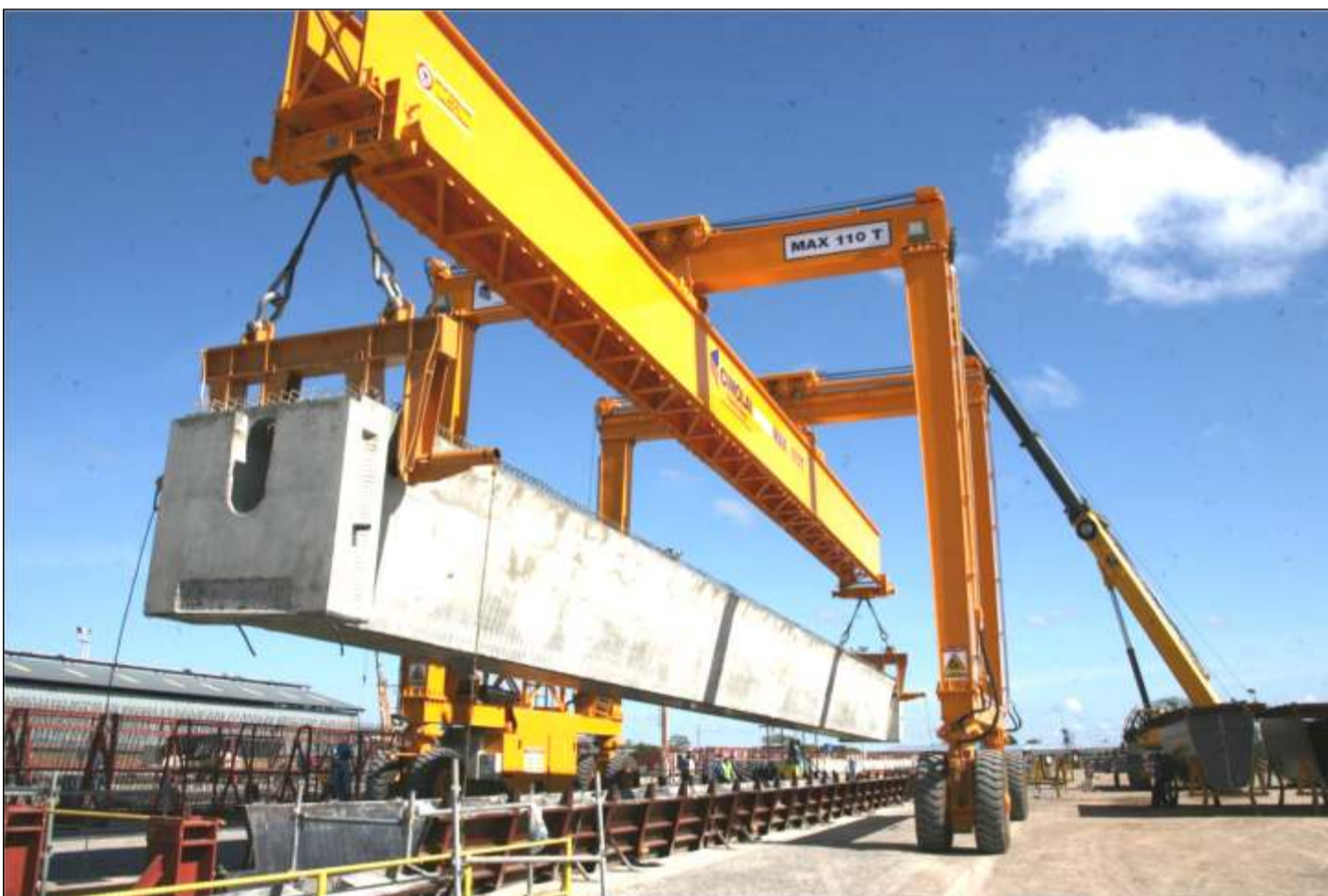
Movilización de Vigas Longitudinales-Pretensadas

La colocación de estas Vigas en los Viaductos Sur y Norte representa el último paso para empezar a construir el tablero o plataforma de la pista de la carretera del Tercer Puente sobre el río Orinoco ejecutada magistralmente bajo la responsabilidad de Constructora Norberto Odebrecht con mano de obra calificada de hombres y mujeres que habitan en Caicara del Orinoco (Edo. Bolívar) y Cabruta (Edo. Guárico).