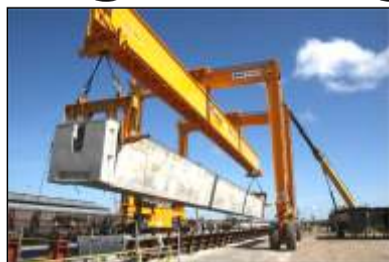
Movilización de Vigas Longitudinales-Pretensadas

La colocación de estas Vigas en los Viaductos Sur y Norte representa el último paso para empezar a construir el tablero o plataforma de la pista de la carretera del Tercer Puente sobre el río Orinoco ejecutada magistralmente bajo la responsabilidad de Constructora Norberto Odebrecht. /8.