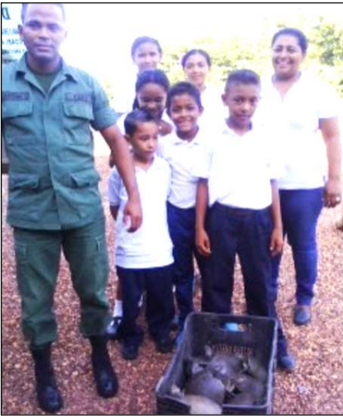
Grupo de ecologistas en una labor conservacionista

E l pasado martes 23 de octubre se realizó una liberación de 35 especímenes denominados galápagos en los diferentes préstamos que se encuentran ubicados cercanos a la población de Cabruta municipio Las Mercedes del Llano del estado Guárico, principalmente en el sitio conocido como “La Puerta”, es de destacar que estos animales fueron incautados en diferentes operativos por realizador por funcionarios de la Guardia Nacional Bolivariana (GNB) según lo previsto en la ley penal del ambiente, caza y comercialización de fauna silvestre.