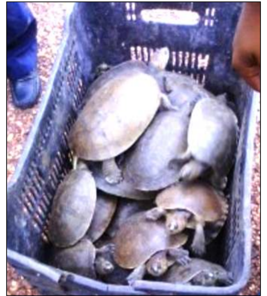
Especímenes que de cautiverio van a su hábitat

Cabe destacar que el Galápagos es un reptil del orden de los Quelonios, parecido a la tortuga, con membranas interdigitales, y se caracterizan por tener un caparazón duro que recubre los órganos internos del cuerpo; esta especie se encuentra en peligro de extinción ya que son comercializadas por su rica carne.