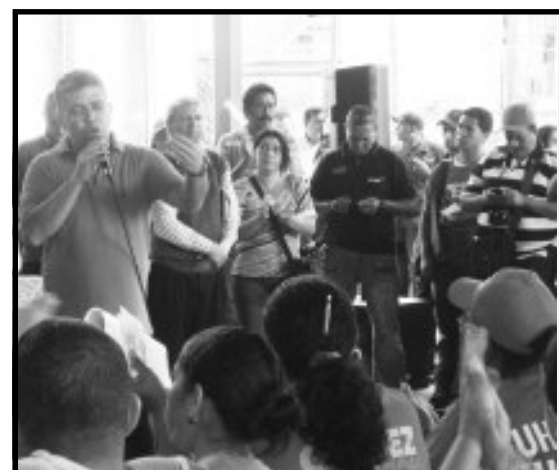
Candidato Elías Jaua en José Félix Rivas