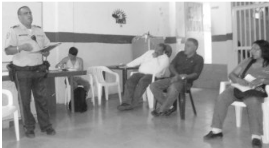
Voceros y voceras de los consejos comunales prestan atención.