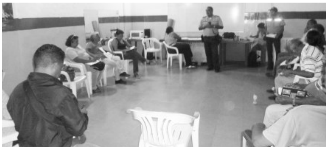
Los presentes toman anotaciones y realizan las preguntas

Ciudadanos del sector cuentan anécdotas de lo que fue la policía en sus tiempos el respeto que mostraban los ciudadanos por la presencia policial, ocotando que es muy importante aplicar los artículos de la ley, coordinando todos los entes que tienen que ver con la seguridad social, desde los padres y representantes hasta los poderes públicos.