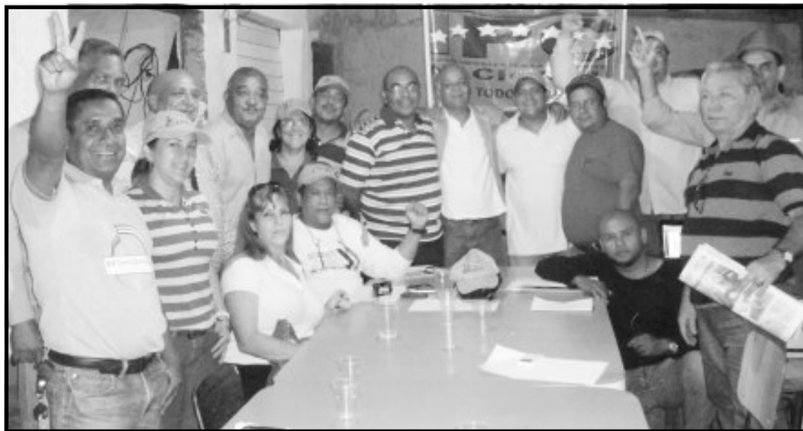
Grupo IPC Miranda Reunidos para afinar las estrategias