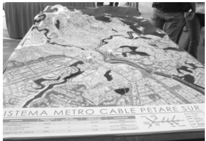
Maqueta del Metro Cable Petare Sur