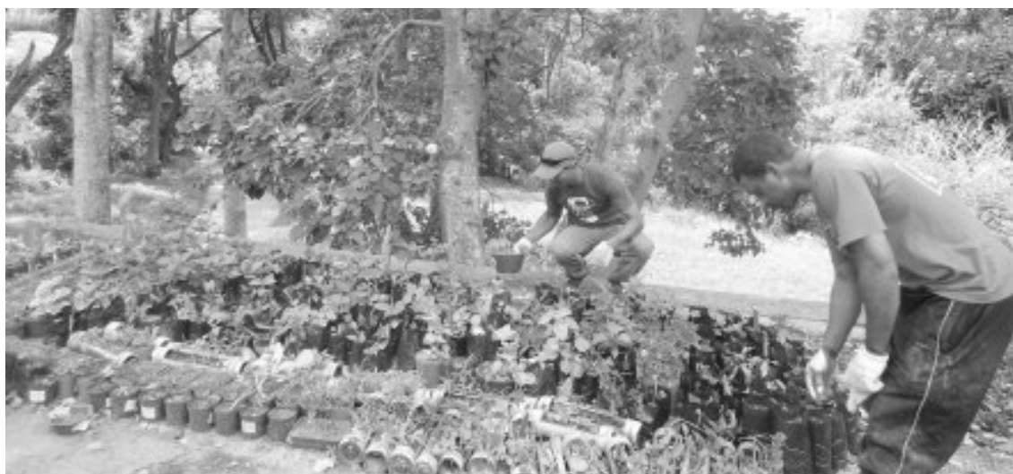
Vivero con plantas que seran sembradas en operativos.