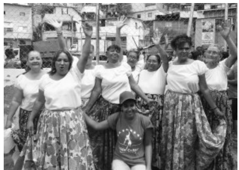
Grupo cultural de Amor Mayor amenizo con un baile el evento.

Elías Jaua, Junto a los candidatos a la asamblea legislativa y el presidente del Metro se dirigen a los vecinos de San Blas, allí presentó su proyecto para la recuperación del Estado Bolivariano de Miranda asumiendo un compromiso con los Petareños.