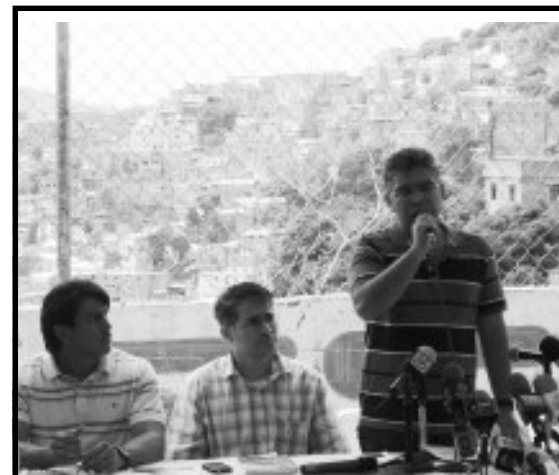
En La cancha del Sector Mata de Malo-San Blas, reciben a Elías Jaua

El candidato a la Gobernación de Miranda Elías Jaua participa en asambleas, realizadas en diferentes sectores de la Parroquia Petare llevando la información de su programa de gobierno así como también recogiendo las inquietudes que los ciudadanos y ciudadanas le plantean en estas asambleas.