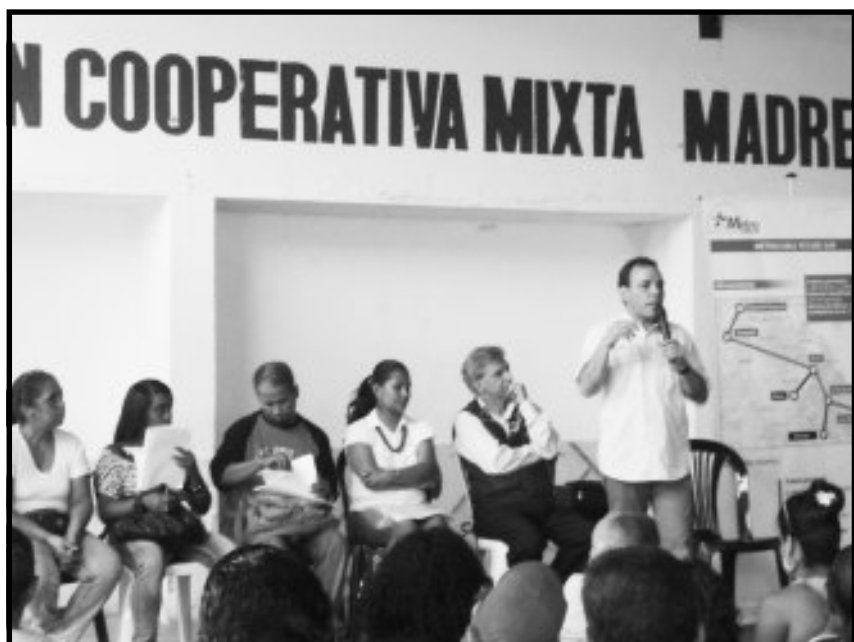
Asamblea informativa en el Barrio Unión de Petare

Fotos y texto / Zaida Artega Colectivo EL Petarazo