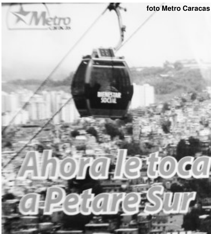
Petare Sur espera su Metro Cable