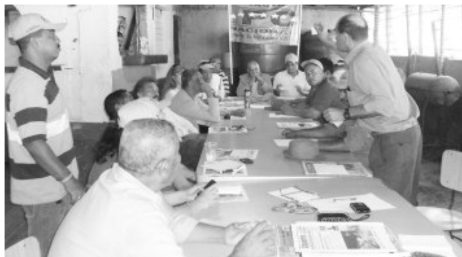
Discuten las propuestas para el trabajo en equipo