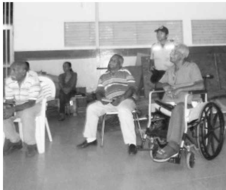
Vecinos atentos a la explicación

Lo primero que están haciendo es un diagnóstico y reconocimiento de los diferentes sectores, para lo cual solicitaron la colaboración de los ciudadanos presentes, ya que son los que en realidad conocen la zona y pueden ayudarlos en la ubicación de los sectores.