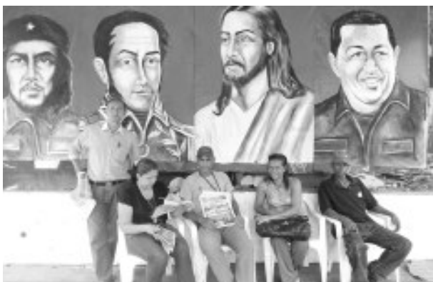
Punto rojo metro Palo Verde.

AMEBLOQ agradece a todas aquellas personas que colaboraron en la distribución del periódico, ya que fue muy efectiva logrando llegar varias partes del país.