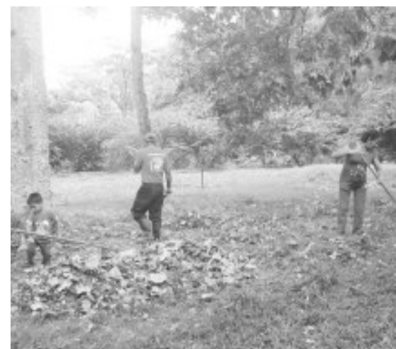
Operación limpieza, todas a colaborar con el mantenimiento del Parque Galindo