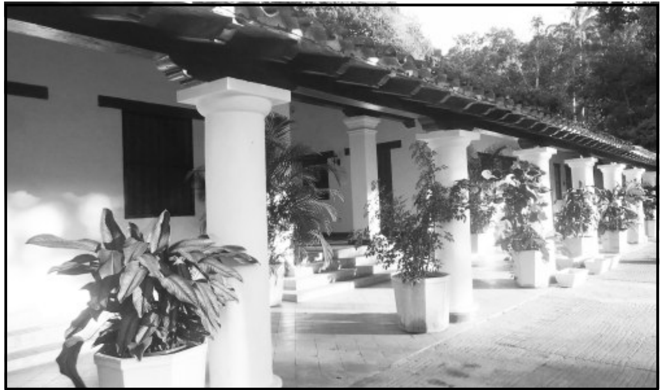
Hacienda San Juan

Se recupera la hacienda para transformarla en posada, en este espacio se construyeron 5 plazas: Bolívar, la milagrosa, la de Afrodescendencia, San Juan, la otra aún no tiene nombre, además de un