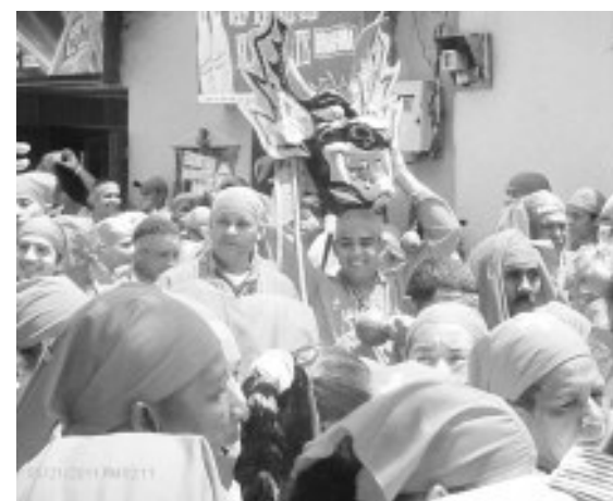
Recorrido por pueblo de Yare