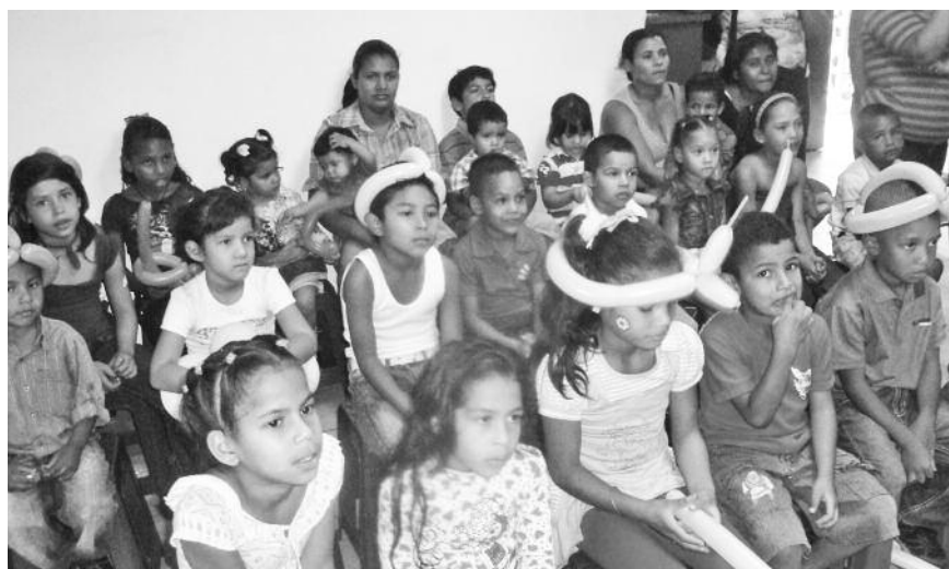
Los niños se divierten