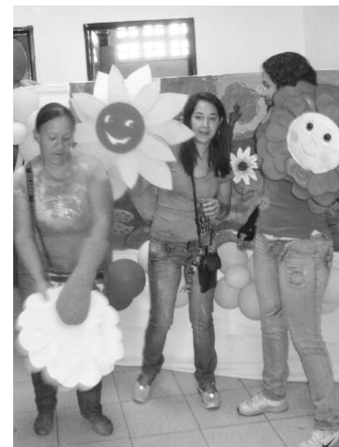
Fiesta navideña en el refugio

Gracias actividades como estas los niños que encuentran en esta situación de refugiados, pasan momentos de alegría y felicidad.