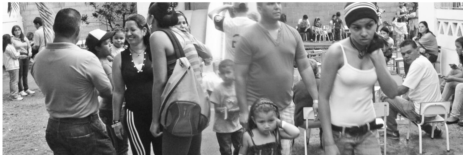
las familias disfrutaron del bazar navideño y los niños de las distracciones del parque

Con la participación del personal administrativo, docentes, obreros y comunidad educativa el pasado sábado 8 de diciembre se llevó a cabo el bazar navideño pro fondo del pre-