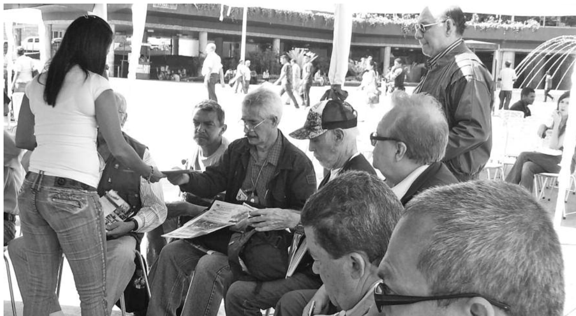
En la Plaza Diego Ibarra los MAC discutieron planteamientos a los proyectos de la patria