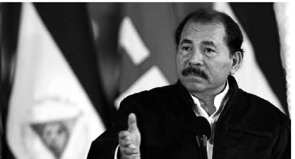
Ortega, Presidente de Nicaragua