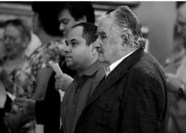
Mujica, Presidente de Uruguay