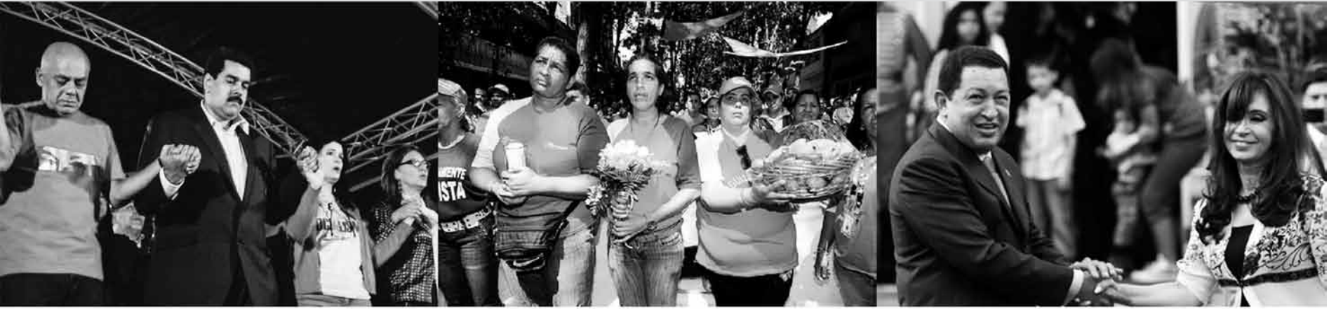
Cristina Fernández, Pta. De Argentina