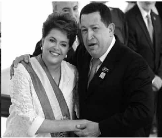
Rousset, Presidenta de Brasil