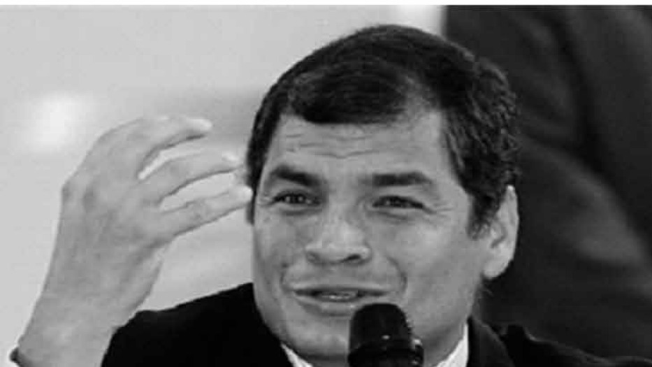
Correa, Presidente de Ecuador