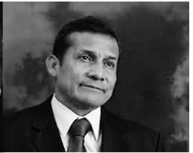
Ollanta Humala; Presidente del Perú