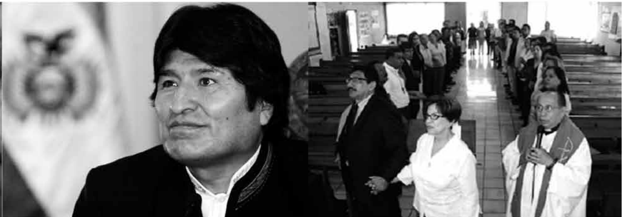
Morales, Presidente de Bolivia