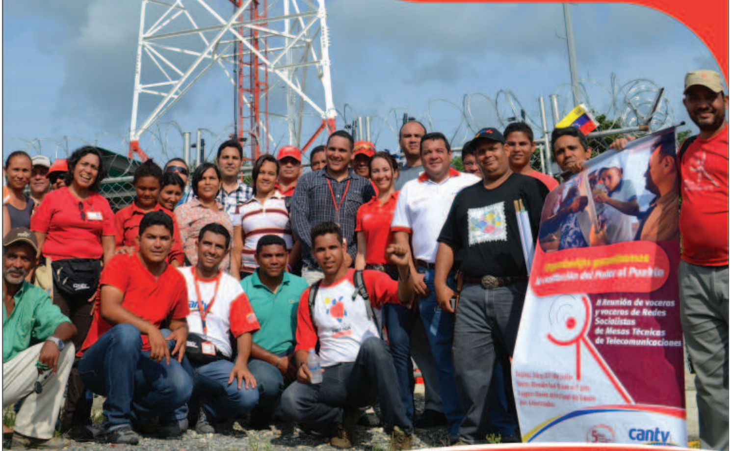
Comunidad de Trinidad, La Capilla, municipio Guanarito, estado Portuguesa

Para atender las necesidades reales y el momento histórico que vive el país, el pueblo organizado y Cantv trabajan en conjunto para transformar sus procesos de planificación y decisión. Avanzamos con hechos en la democratización de las telecomunicaciones.