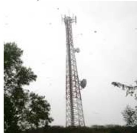
La nueva estación radiobase beneficia directamente la vocación agrícola de más de dos mil 400 personas que hacen vida en este intrincado y montañoso sector varguense.