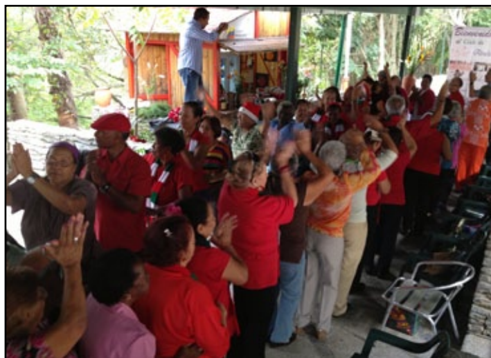
Las abuelas y abuelos gozaron en su fiesta navideña en el Mirador Boyacá KM

Un intercambio de regalos fue el momento emotivo de la reunión donde hasta el Consul General de Ecuador en Venezuela,