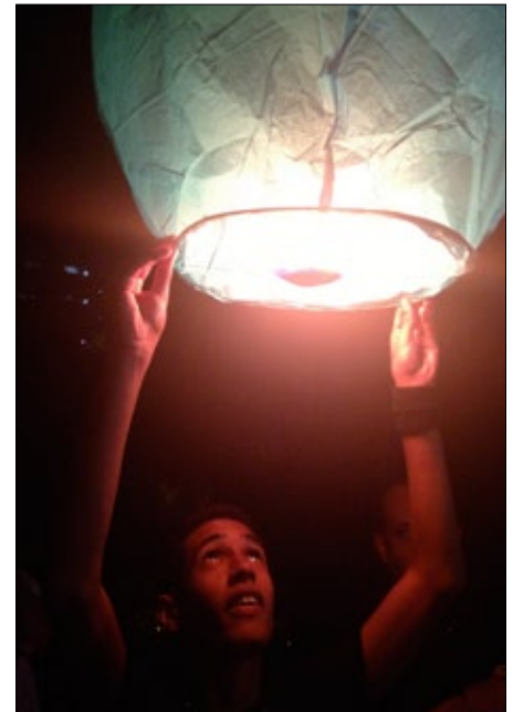
En el bloque 6 los fuegos artificiales iluminaron la noche. En Ntra Sra de Coromoto la asistencia fue masiva. Globos de los deseos.