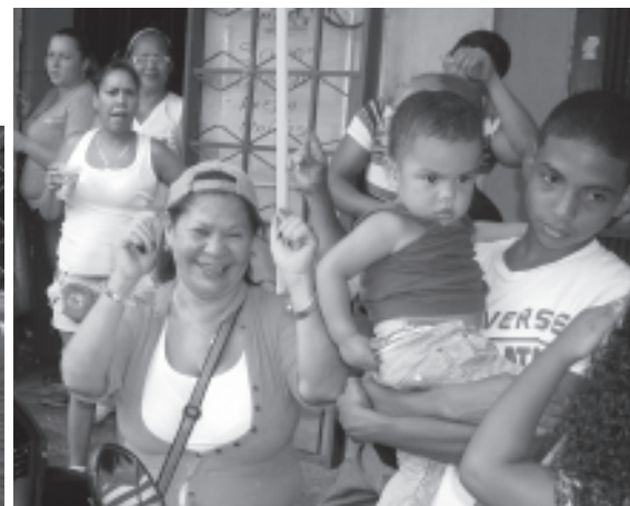
Vecinas y vecinos esperan en colas pacientemente para opinar con su voto