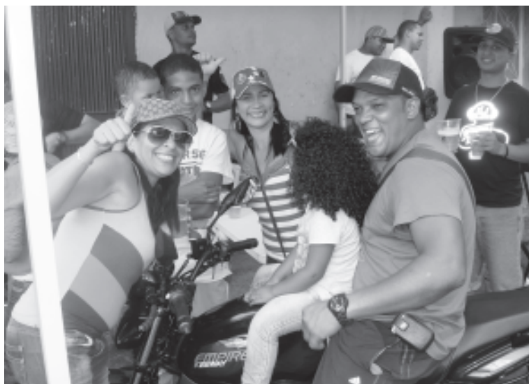
Vecinos después de sufragar, esperan en las calles los resultados