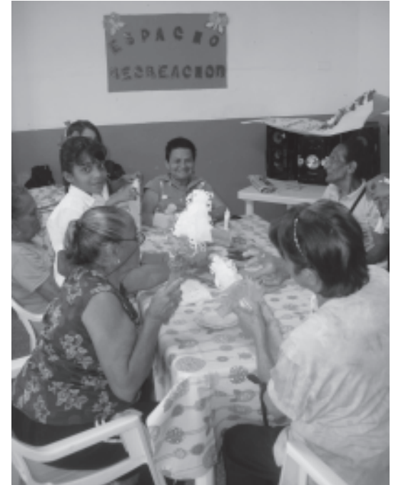
Las abuelas hacen manualidades