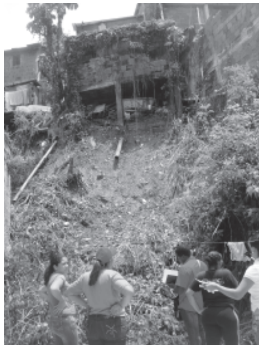
La casa por caer y lo frágil del terreno

Milagros vocera del consejo comunal la Ceiba y habitante que corre peligro denunció desde hace mucho años la