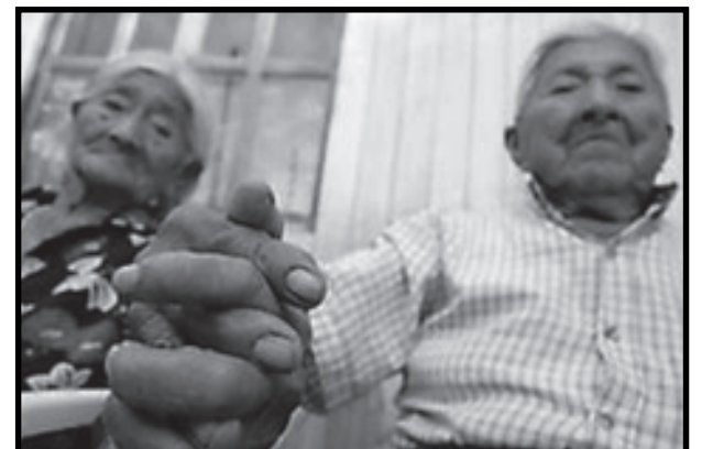
Existen adultos mayores con más de 2 años esperando salir en el listado