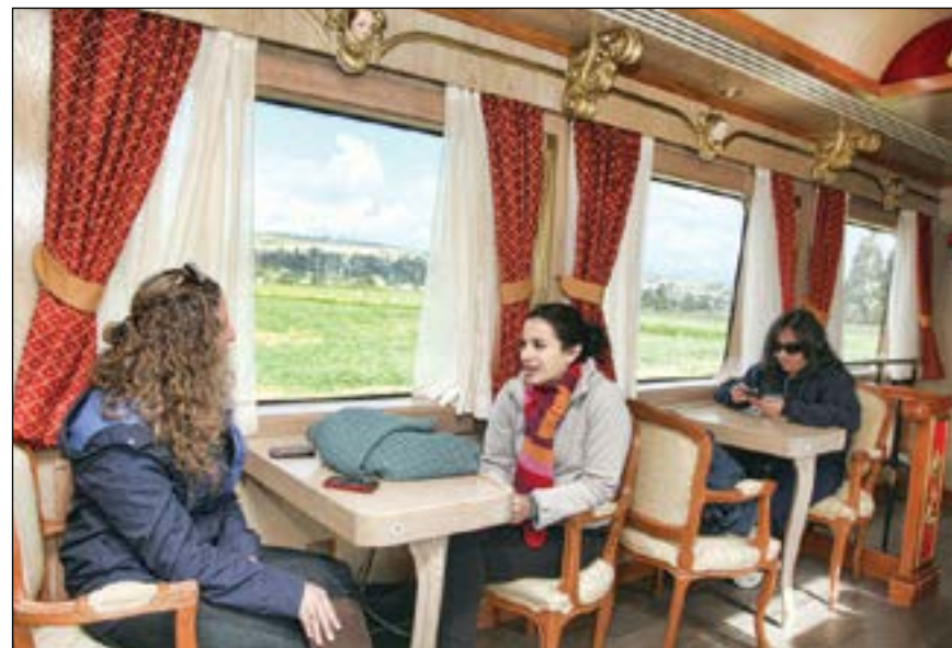
Instalaciones internas de uno de los coches que conforman el tren