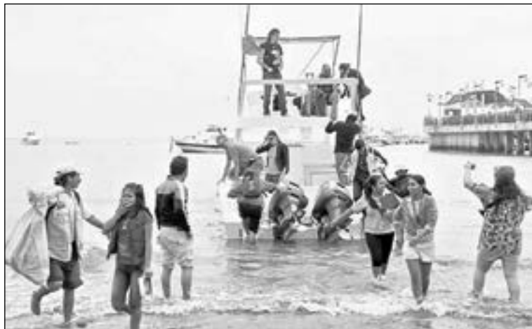
En Puerto López los turistas llegan al embarcadero para tomar uno de los tours que se ofertan desde USD 25

la época de avistamiento de ballenas jorobadas, 300 turistas llegaron para observar a los mamíferos marinos, 180 de ellos además recorrieron la Isla de la Plata, según datos del Departamento de Turismo del Municipio, recogidos a pie de playa. El costo del tour de avistamiento es de USD 25 por persona, y para llevar a la Isla de la Plata se debe desembolsar USD 40. Además al llegar al Puerto se pueden recorrer otros destinos del Parque Nacional Machalilla. Cada año más de 40 000 turistas visitan este atractivo natural.