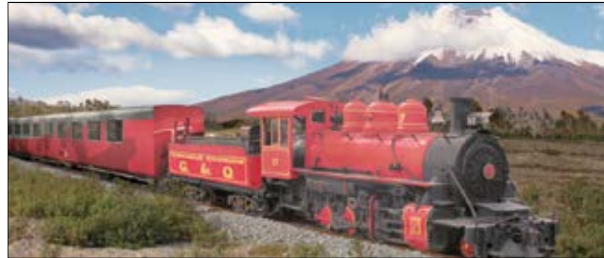
Tren Crucero Ecuador atravesando las faldas del Chimborazo

Esta obra constituida hoy entre los cinco mejores trayectos turísticos del mundo, habla muy bien de ese nuevo país al que todos tenemos la obligación moral, cívica y patriótica de aportar con un granito de arena.