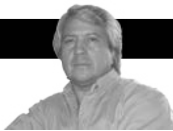
Por: Wilson Quezada