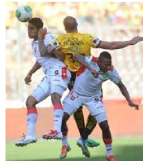
Barcelona gana 3 goles a 1

E n un partido con tres expulsados y un penal, Barcelona se impuso el domingo por 3-1 a Liga de Loja. Este partido le puso fin a la vigésima fecha del Campeonato Ecuatoriano de fútbol.