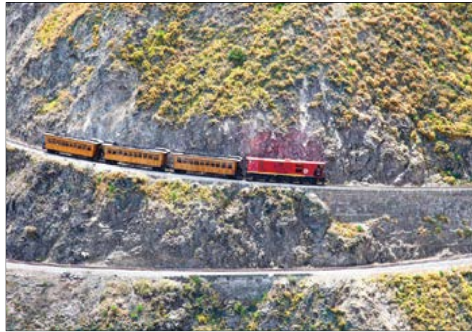
El Tren en la Nariz del Diablo

Los cuatro coches del convoy del tren transportarán a 54 pasajeros a través de las diferentes y fascinantes