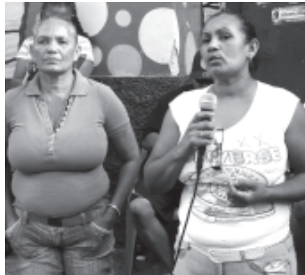
Que ha pasó con el 18 mil Bs proyecto del parquecito del Jobo