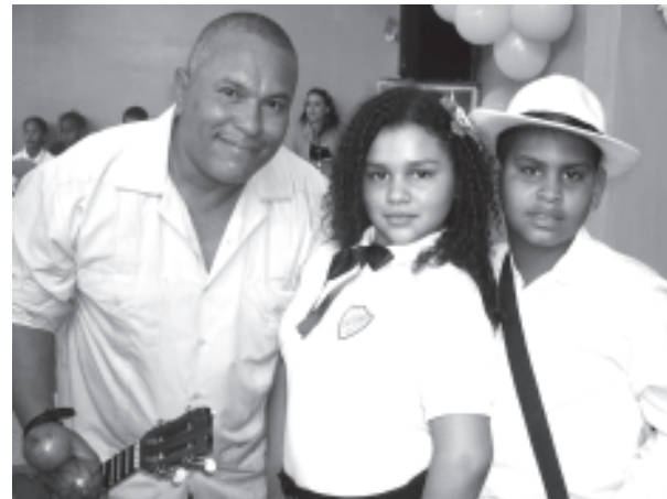
El profesor de música con dos alumno talento de las U.E.N. El Llanito