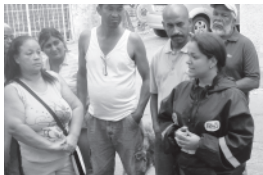
Protección Civil dio una charla