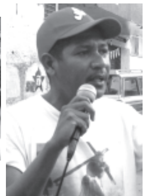
Sabemos de los problemas vamos a tomar cartas en el asunto, estoy a la orden