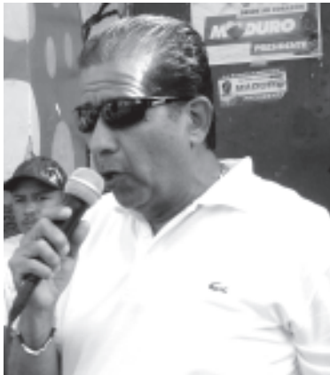
Las puertas de C.C están abiertas para todos, tenemos que unirnos

En la Ceiba los vecinos hablaron y preguntaron