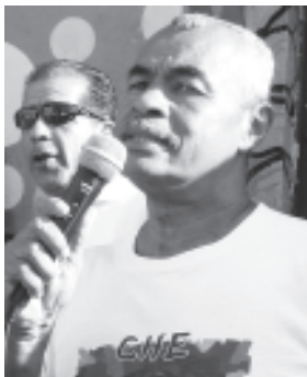
La unidad es esencial para resolver las dificultades