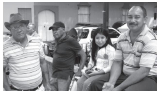
Público de todas las parroquias bailaron, cantaron y disfrutaron del evento