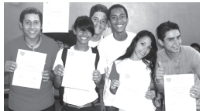
El grupo de recreadores comunitarios también recibieron su reconocimientos