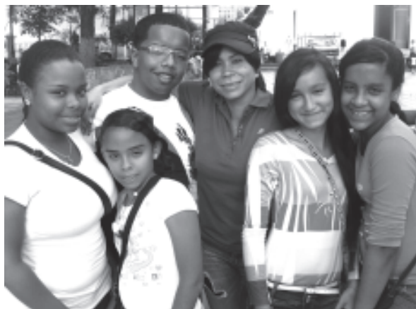
El Grupo Ritmo y Sabor presente en el evento miembros de Graan Sucre