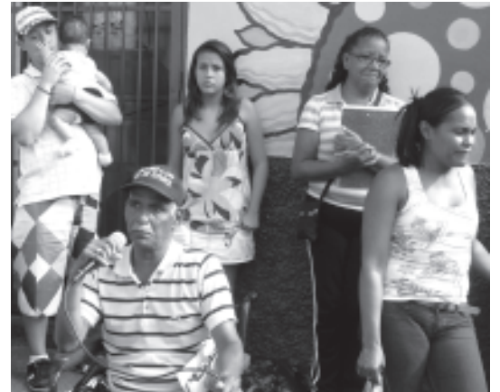
Existe mucha apatía en la comunidad Un colector de agua que viene de la vuelta de Guanare, está afectando varias casa