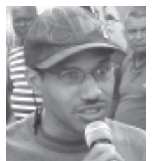
Que pasa con el agua