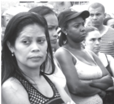
Vecinos y vecinas atentos a lo que se decía