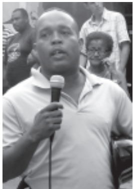
La alcaldía aprobó unos recursos para el deporte