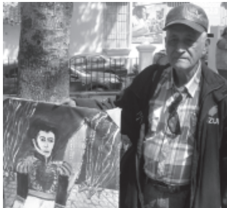
El Pintor Rivas donó al colectivo Petarazo una pintura de Bolívar