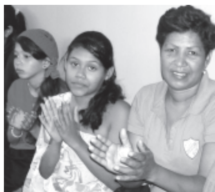
La niña se destacó bailando