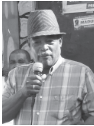
Antes existían de todo ahora no tenemos nada vamos pa' tras