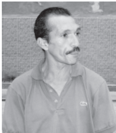
El hermano mayor

Después dos horas de espera los Polisucre se presentaron al sitio llevándose detenidos a los tres hermanos.