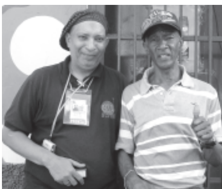
Radio Petare, El Petarazo y el Capurro presente