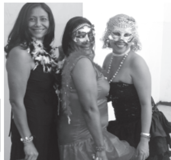
Un grupo de profesoras animaron con disfraz y bailes igual que los alumnos