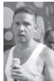
El culpable que no se haga nada es la misma comunidad