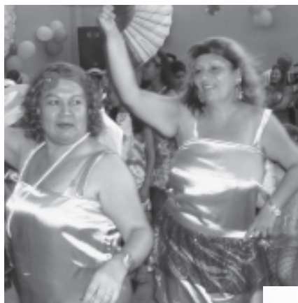
Las profesoras bailaron