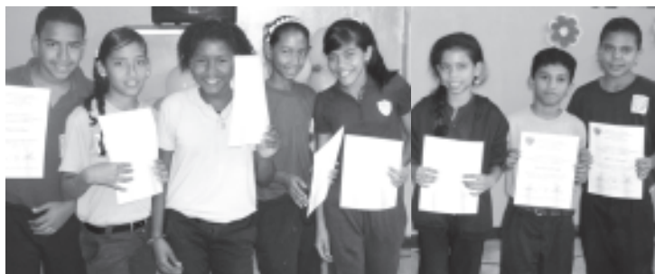
Se otorgó reconocimientos a los talentos de la U.E.N. EL Llanito