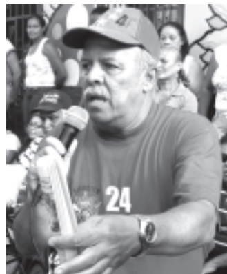
Un muro que puede caer en cualquier momento y las ratas azotan la zona