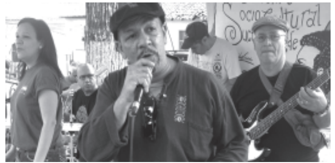
Al final del evento Guachafa puso la salsa