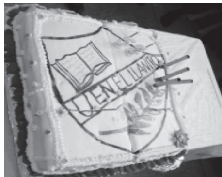
La torta de los 52 Años