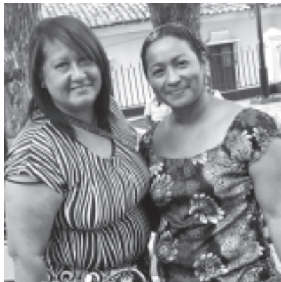
Las Artesanas presente