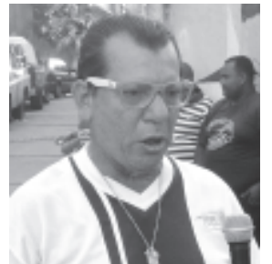
Olvidémonos de políticas y trabajemos juntos por el barrio