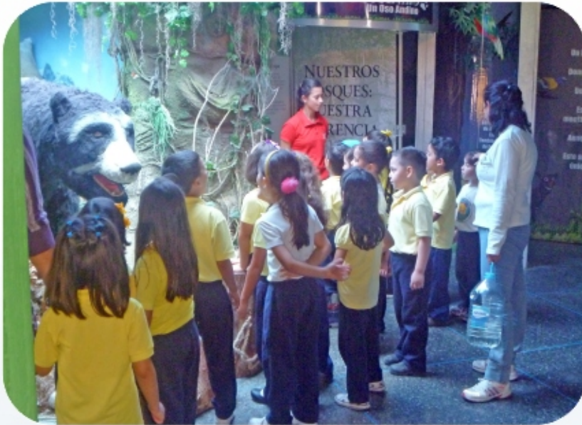
Museo de Ciencia y Tecnología de Mérida