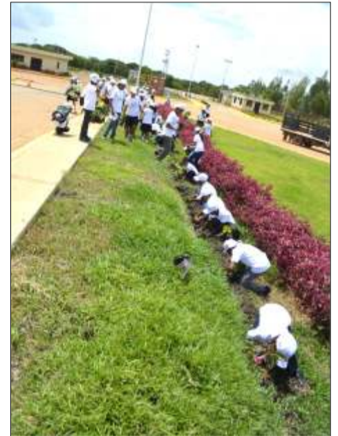
Siembra de árboles por niños y niñas en las adyacencias de la empresa Algodones del Orinoco