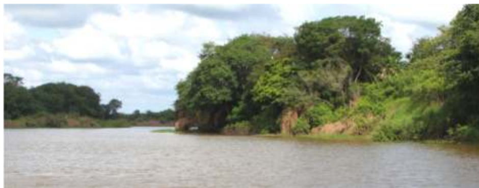
Río Aguaro.