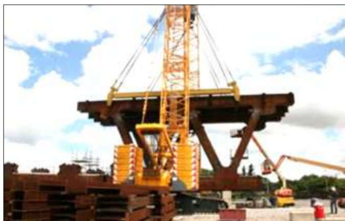
Posicionamiento del Cordón Superior