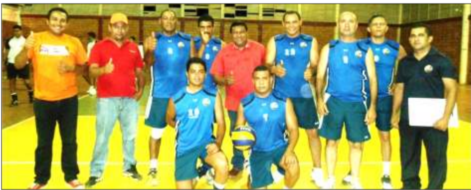
La selección de Las Mercedes obtuvo el segundo lugar en la categoría masculina.

Durante la contienda se seleccionaron los equipos que representarán al estado Guárico en el Campeonato Nacional, resultando ganadores las delegaciones de Mellado y Miranda