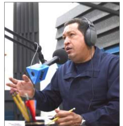
Comandante Eterno Hugo Chávez, gran comunicador

Para finalizar, Samuel Cohén señaló que los medios de comunicación continúan actuando con guarimba y desestabilización se han encargado de generar falsas matrices de opinión, como el desconocimiento de los resultados electorales de 14 de abril y la campaña orquestada contra el Consejo Nacional Electoral, con la ejecución que el presidente Nicolás Maduro realizara con el gobierno de calle los medios privados volvieron aplicar su censura.