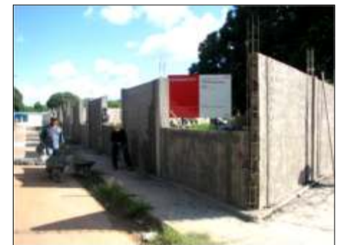
Proyecto Casa del Adulto Mayor obra de gran impacto social avanza de manera positiva

De manera positiva avanzan los trabajos de construcción del Proyecto Casa del Adulto Mayor ubicado en el sector Kuwait del municipio General Manuel Cedeño en el estado Bolívar, cuyo proyecto es desarrollado por Constructora Norberto Odebrecht, empresa encargada de la ejecución de la obra Tercer Puente sobre el río Orinoco.