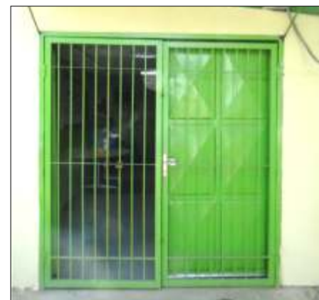
Entrada principal totalmente nueva, mayor seguridad

Constructora Norberto Odebrecht a través del departamento Responsabilidad Social hizo posible dentro del marco de las múltiples acciones sociales que ejecuta dentro de las comunidades donde se construye una de las obras más imponentes de Venezuela como lo es el Tercer Puente sobre el río Orinoco, facilitando de manera oportuna aportes necesarios que benefician a un colectivo.