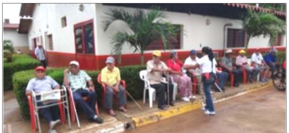
Sede del Adulto Mayor en Cabruta incrementara su espacio físico

Caicara del Orinoco, 29 de Junio de 2013