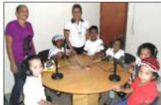
Niñas y niños en los estudios de la radio comunitaria La Voz de Cabruta 104.1 FM, en la producción de contenidos.

Esta actividad de La Voz de Cabruta 104.1 FM va dirigida a niños, jóvenes y adultos con el fin de concienciar para construir un mundo sano, no a la contaminación, también se recuerdan los símbolos patrios y las fechas más relevantes de nuestras efemérides. /7