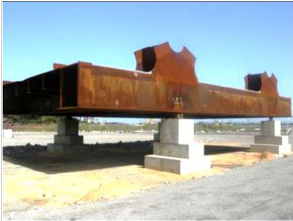
Cordón Inferior S1-1

En el desarrollo del Tercer Puente Sobre el Río Orinoco se han aplicado diferentes etapas y procesos constructivos para la ejecución del mismo. Estos módulos estructurales son de gran envergadura para uno de los puentes más desafiantes de América Latina, ejecutado por la transnacional Constructora Norberto Odebrecht.