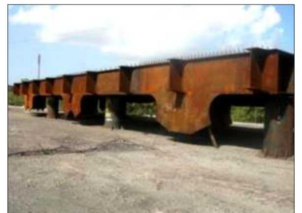
Cordón Superior S1-1