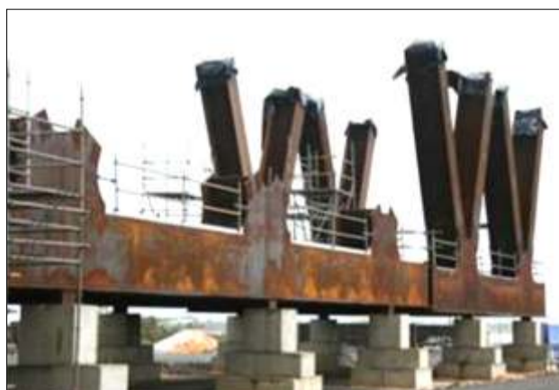
Nivelación del módulo y fijación de las vigas diagonales

El Tercer Puente sobre el río Orinoco se ha diseñado estéticamente de modo que armonice y enriquezca la belleza de sus alrededores, ubicado al margen del río Orinoco de las poblaciones de Caicara del Orinoco (estado Bolívar) y Cabruta (estado Guárico).