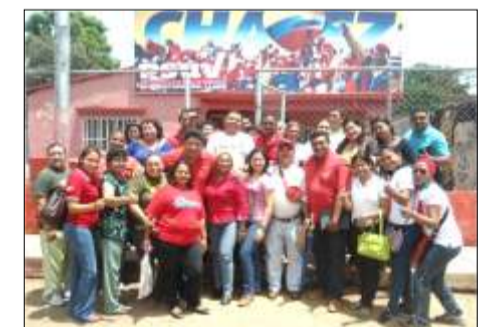
Los Revolucionarios en Las Mercedes del Llano aplaudieron la iniciativa que ejecuta el gobierno nacional.

Por su parte, el presidente de la Cámara Municipal y secretario de organización del PSUV, Elías Zurita, luego de respaldar las declaraciones del primer mandatario municipal, expresó que con la lucha que está asumiendo el presidente Nicolás Maduro, "demuestra su interés por