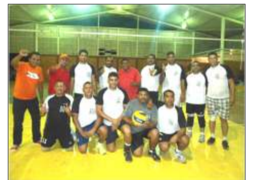
El equipo masculino de Miranda resultó ganador tras vencer a la selección de Las Mercedes.

“Felicito a todos los participantes, en especial a quienes resultaron vencedores y que además tienen la responsabilidad de representar a todo el estado Guárico, así que les deseamos mucha suerte y éxito en su desempeño”, afirmó el mandatario municipal, quien reiteró que el deporte es prioridad para el gobierno revolucionario de Nicolás Maduro y Rodríguez Chacín, razón por la cual continuarán apoyándolo contundentemente.