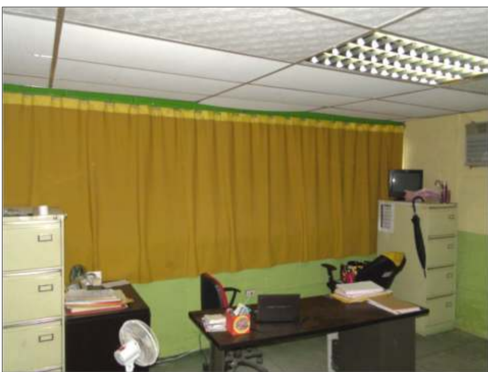
Aspecto actual de oficina del INSAI, una vez acondicionada en cuanto a preparación de techo y pintura

En la misma sede del Ministerio del Poder Popular Para la Agricultura y Tierras (MPPAT) funcionan varias oficinas y dependencias agrícolas (FONDAS, INIA, INSAI, CIARA) que también fueron acondicionadas.