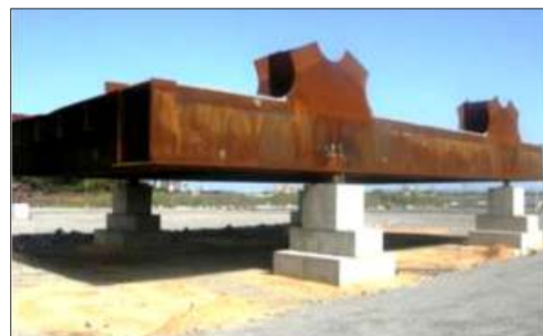
Cordón Inferior S1-1

En el desarrollo del Tercer Puente Sobre el Río Orinoco se han aplicado diferentes etapas y procesos constructivos para la ejecución del mismo. Estos módulos estructurales son de gran envergadura para uno de los puentes más desafiantes de América Latina, ejecutado por la transnacional Constructora Norberto Odebrecht. /9