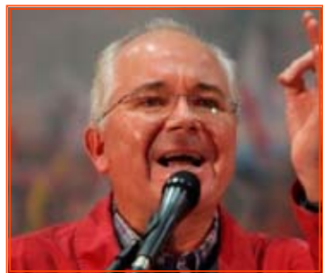
Publicado 9 septiembre, 2013 en Nacionales.-

Desde las instalaciones de Pdvsa La Campiña, el ministro del Poder Popular para Petróleo y Minería, expone este lunes los resultados del comité de investigación que se conformó para determinar las causas del evento ocurrido en la refinería de Amuay en el estado Falcón hace poco más de un año.