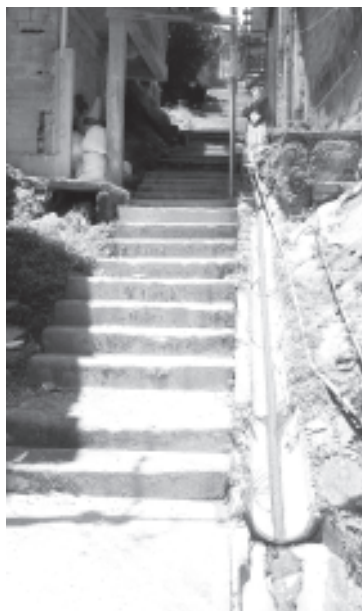
Son 38 metros de escaleras que limpió en el sector El Óvido , además de barrer también desmalezó la zona