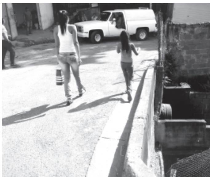
Los vehículos pasa demasiado pegado al hombrillo que podría hacer caer a personas adulto Mayor niños o cualquier otro peatón a mas de 12 metros de altura

Según vecinos del sector la solución sería poner una maya protectora en la zona para evitar que algún vecino o vecina caiga al vacío