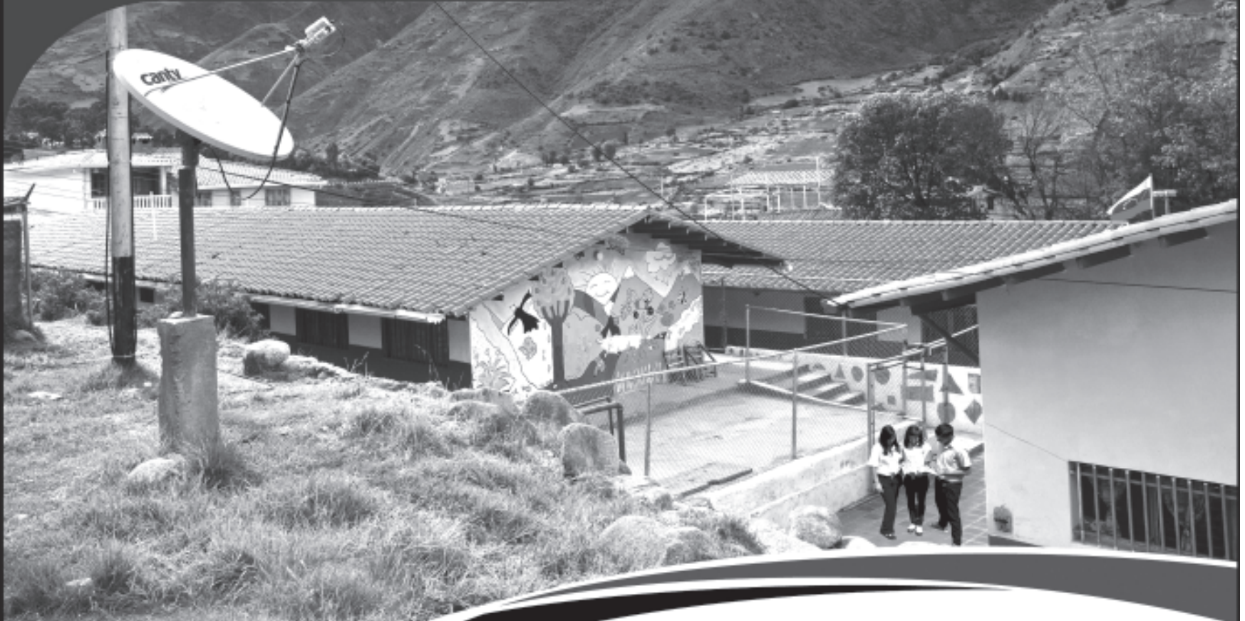
Liceo Bolivariano "La Toma", estado Mérida.

Con nuestro satélite Simón Bolívar, 4 millones y medio más de venezolanas y venezolanos ven materializado sus beneficios con la instalación de antenas satelitales que aseguran la salud, la educación y otros servicios para el desarrollo del país.