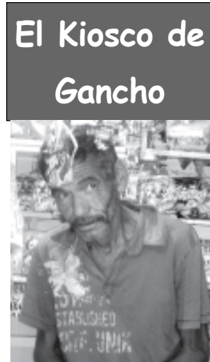
El Kiosco de Gancho