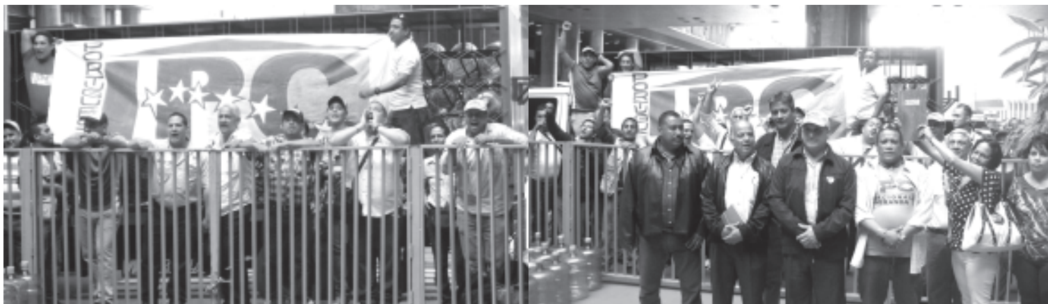
Se puede apreciar cuando dirigentes del IPC de todo el país, protestan frente al CNE