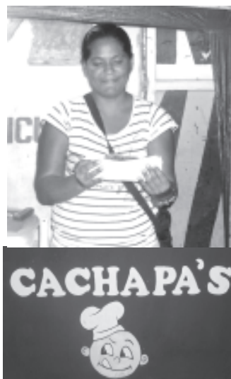
Las Cachapas de Casiyanez santa Rita