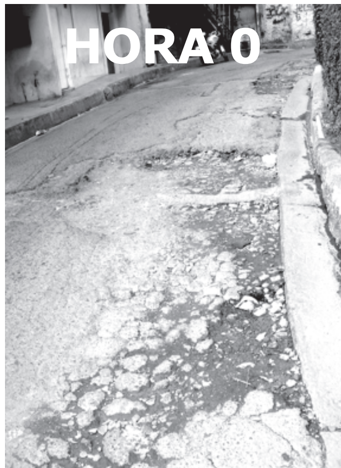
Es solo una mínima parte lo que se muestra