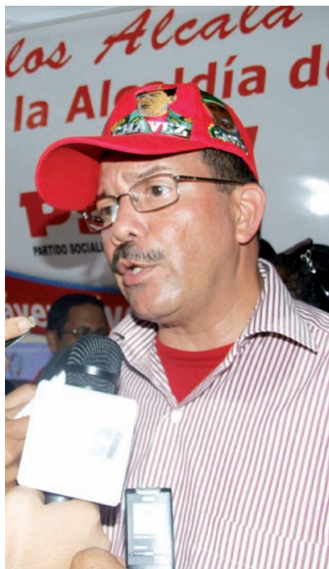
Mayor General Alcalá Cordones, candidato de la Revolución a la Alcaldía de Vargas

“Vamos a hacer un estudio a ver que está pasando ahí (con el Casco Histórico) porque desde el punto de vista histórico y cultural debemos tener al Casco Histórico activado, como debe ser en este país, que tenemos una historia, una raigambre y un pasado glorioso con la gesta de nuestros libertadores y entonces, en este orden vamos a estudiar una solución para el pueblo, por supuesto, no será en el corto plazo pero vamos a buscarla, veremos la situación de las propiedades privadas pero, de cualquier manera las leyes venezolanas son para beneficiar a nuestro pueblo y debido a esto necesitamos que la Cámara Municipal esté en manos de las fuerzas revolucionarias para que desde el día 9