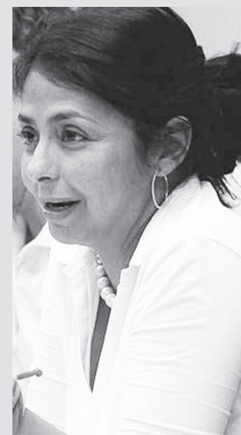
Ministra de Comunicación e Información Delcy Rodríguez

Reivindicó la importancia de los medios comunitarios y del poder popular empoderado de los medios de comunicación como alternativa y herramienta para contrarrestar esa pretensión mediática "cartelizada y prepotente" que niega realidades y se alinea con intereses que no son los del pueblo.