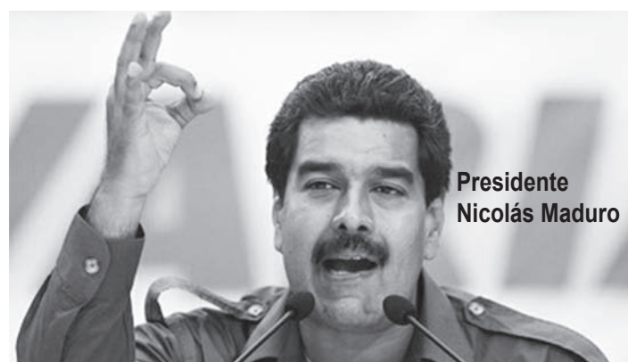
Presidente Nicolás Maduro