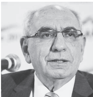
Elías Eljuri, presidente del Instituto Nacional de Estadísticas (INE)

la actual situación económica en el país "tienen que ver con el acaparamiento de productos, la reventa de productos a precios elevados que realizan los economistas informales y el contrabando de grandes cantidades de alimentos que salen por las fronteras a otros países".