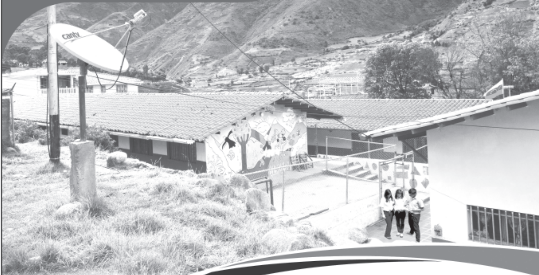
Liceo Bolivariano "La Toma", estado Mérida.

Con nuestro satélite Simón Bolívar, 4 millones y medio más de venezolanas y venezolanos ven materializado sus beneficios con la instalación de antenas satelitales que aseguran la salud, la educación y otros servicios para el desarrollo del país.