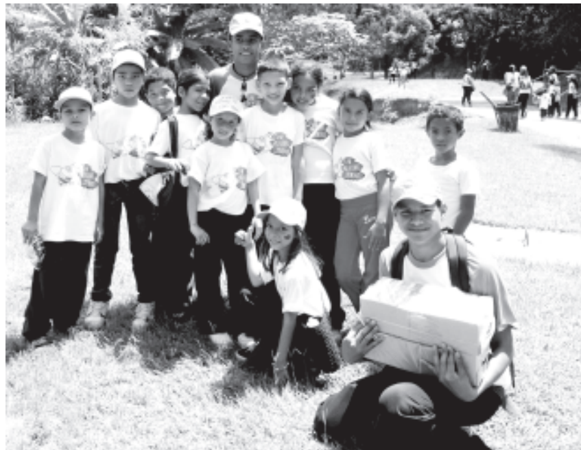
Niñas y niños junto a sus guías

Planes vacacionales de todo el municipio sucre siguen visitando a Parque Galindo para disfrutar de sus espacios recuperados por el Poder Popular con el Apoyo de Inparques, este año superamos la meta del año Pasado 2012 donde 2650 niños, niñas y adolescentes visitaron el parque este año 2013 recibimos 3545 niños, niñas y adolescentes... estamos venciendo y seguiremos venciendo hacia la comuna y la transferencia de competencia Viva Chavez.. por siempre