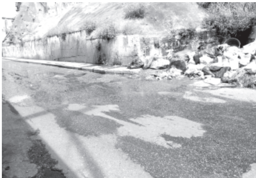
En la gráfica se muestran tres problemas en un mismo sector

Petare se hunde en basura, aguas servidas y deterioro de las calles