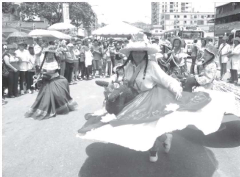
El tradicional baile de La Burriquita

En el marco del reimpulso de las Grande Misiones Socialista del Gobierno Bolivariano el día Sábado 31 de agosto, se realizó un Macro Evento en la Av Francisco de Miranda a la altura del CDI de San Miguel para impulsar a través de ella una política única que nos permita garantizar la seguridad la estabilidad sociable de cada una de esta personas generando una fuente de vida que permita desarrollar mejores condiciones de vida mejorando su situaciones prestando la mayor atención a niños niñas jóvenes adolescente adultos y adultos mayores que son sujeto de derecho por la revolución Bolivariana.