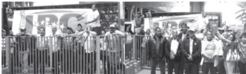
Se puede apreciar cuando dirigentes del IPC de todo el país, protestan frente al CNE