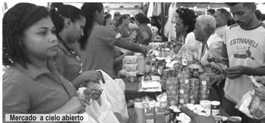
Mercado a cielo abierto

Dependiendo de la investigación, pueden imponerse multas, en función de las dimensiones del establecimiento, y proponer un procedimiento expropiatorio.