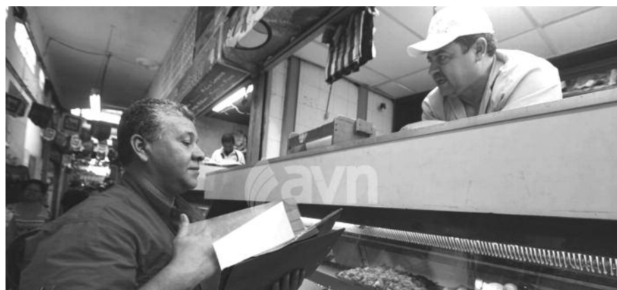
El pueblo fiscalizará

Señaló que en uno de los supermercados existen 27 cajeros, pero en caso de falla de personal se pueden "suplir o ser reforzado con la milicia nacional".