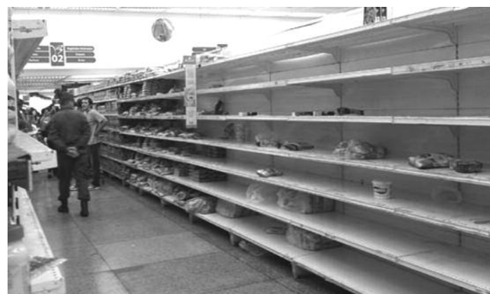
Anaqueles vacíos producto de la guerra económica