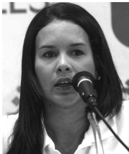
Ministra Alejandra Benítez

Caracas, fue la sede principal del magno evento del deporte nacional, responsabilidad que compartió con los estados Vargas y Carabobo. Las tres entidades reunieron en sus instalaciones a más de 6 mil deportistas, quienes con pundonor y coraje defendieron los colores de cada uno de sus estados.