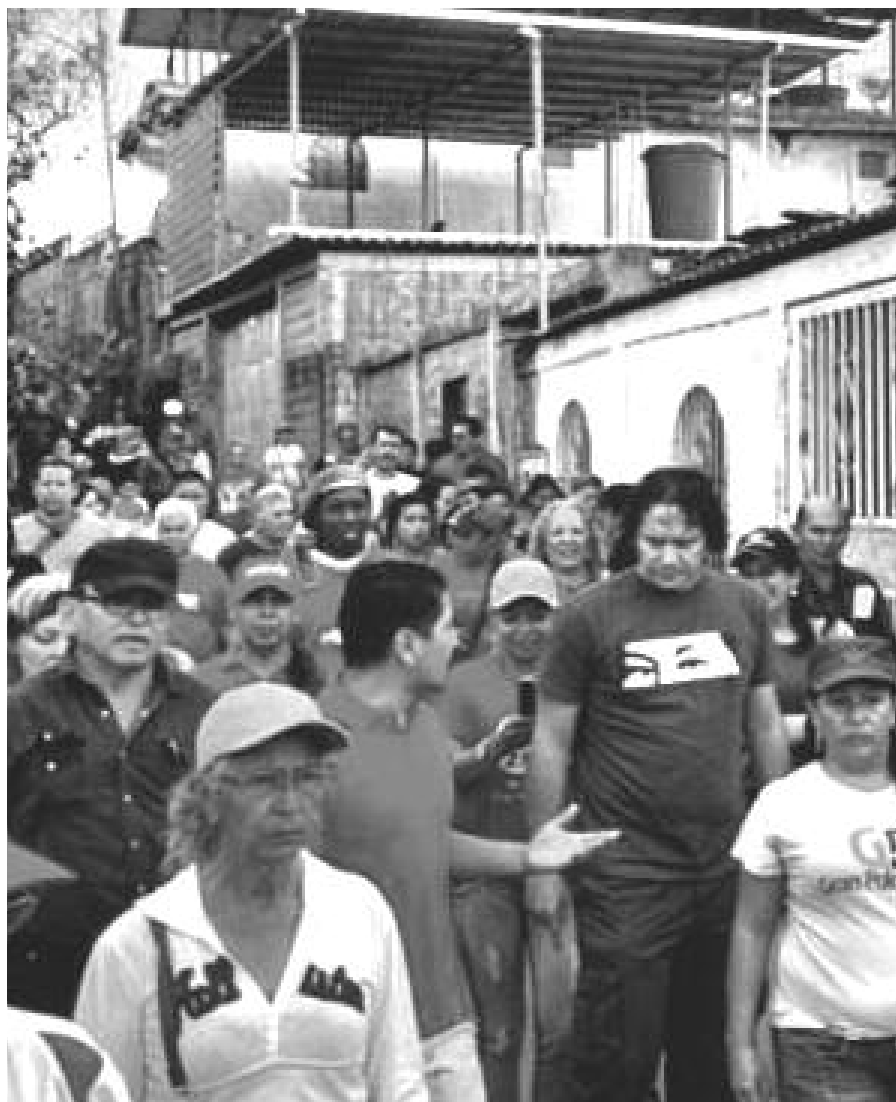
Guacaipureños esperanzados con Garcés

mente, se trasladaron a este sector popular, donde sostuvieron una reunión con la comunidad.