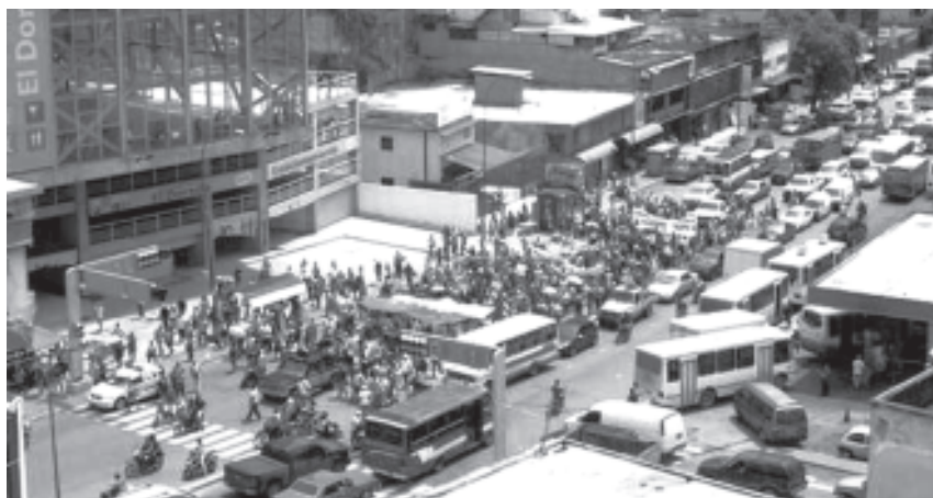
La marcha de los vendedores informales tranco la avenida Francisco de Miranda en ambos sentidos

Según, los buhoneros es presionar a Carlos Ocariz alcalde del municipio Sucre para que cumpla las promesas de reubicación, hechas en la campaña electoral.