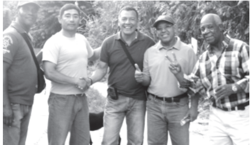
Los candidatos dejan testimonio y compromiso con la comunidad del Campito