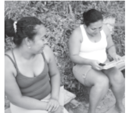
Vecinas hablan con los candidatos sobre el problema cada vez que llueve