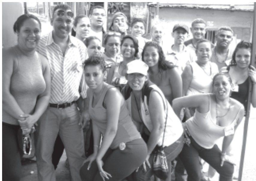
En la foto se aprecia los candidatos a las diferentes vocerías del consejo comunal vuelta Guanare . En la próxima edición se dará a conocer los voceros y voceras principales elegidos por las vecinas y vecinos de la zona

Según la comisión electoral de 320 electores del sector votaron 260 se cumplió la meta