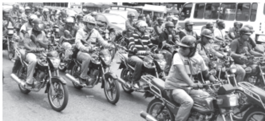
Esta caravana es para llevar un pliego de peticiones ante el Indepabis por el alto costo de las motos y repuestos

Por / Capurro El Hablador