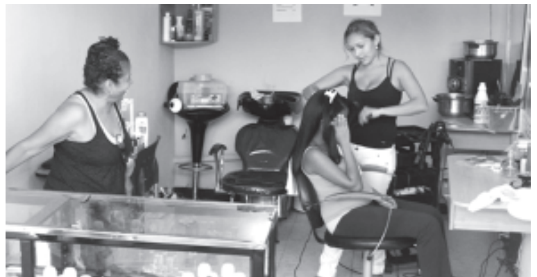
Calle principal El Campito de Petare

El mejor corte de cabello y la mejor atención en la PELUQUERIA MADELEIN