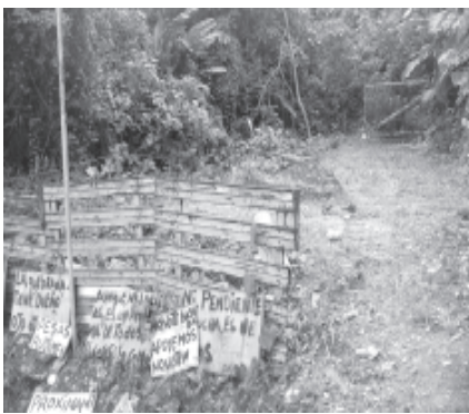
El terreno abandonado la comunidad quiere sacarle provecho