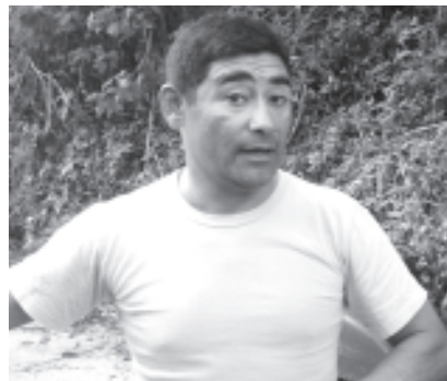
El chino líder de la zona explica todas las diligencias realizadas por el terreno