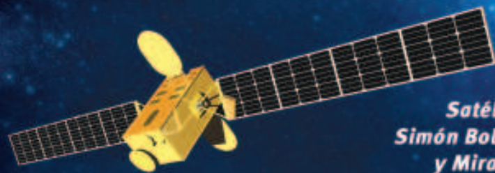
Satélites Simón Bolívar y Miranda