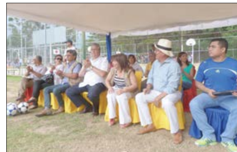
Durante la inauguración del Programa "Ecuador Recréate Sin Fronteras"

cada una de las ligas y asociaciones que están participando, ellos escogieron sus colores, ellos tomaron la decisión y nosotros hicimos el esfuerzo de cumplirles el sueño. Cuando digo nosotros, es el gobierno ecuatoriano, y me ha tocado como cónsul implementar el proyecto, un proyecto que es creado, generado por el Ministerio de Deportes". Igualmente destacó: "ustedes los deportistas tienen el sello del Ministerio de Deportes Ecuatoriano en el lado derecho de la camiseta, al lado izquierdo tienen el sello del país, ese sello que dice Ecuador Ama la Vida, ama el deporte, ama la salud, ama el buen vivir y junto a Ecuador Ama la Vida, en-