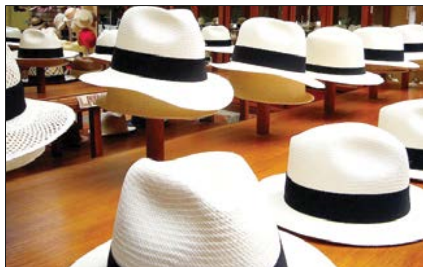
Sombreros de paja toquilla hechos a mano, en Cuenca