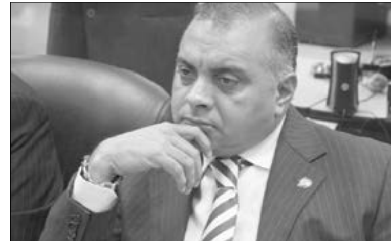
Galo Lara ex asambleísta escapo a Panamá

El presidente de Ecuador, Rafael Correa, se lamentó de que Panamá haya otorgado asilo al ex legislador Galo Lara, condenado a diez años de prisión al ser declarado cómplice de un triple crimen ocurrido en agosto de 2011.