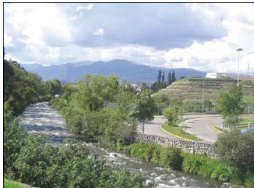
El río Tomebamba a la izquierda y las ruinas de Pumapungo a la derecha