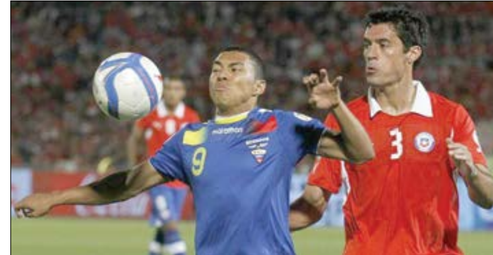
Estamos en el Mundial. La 'Tri' festeja su pase a Brasil en el Estadio Nacional