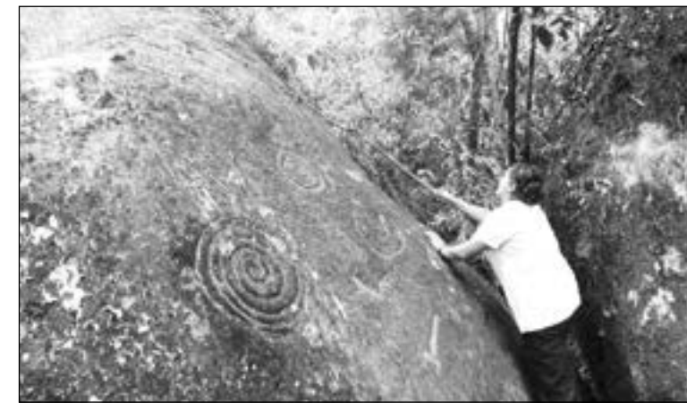
Un petroglifo ubicado en San Pedro, Zaruma

En la provincia de El Oro, actividades de diverso tipo que exigen la remoción intensiva del suelo, han destruido importantes yacimientos arqueológicos.