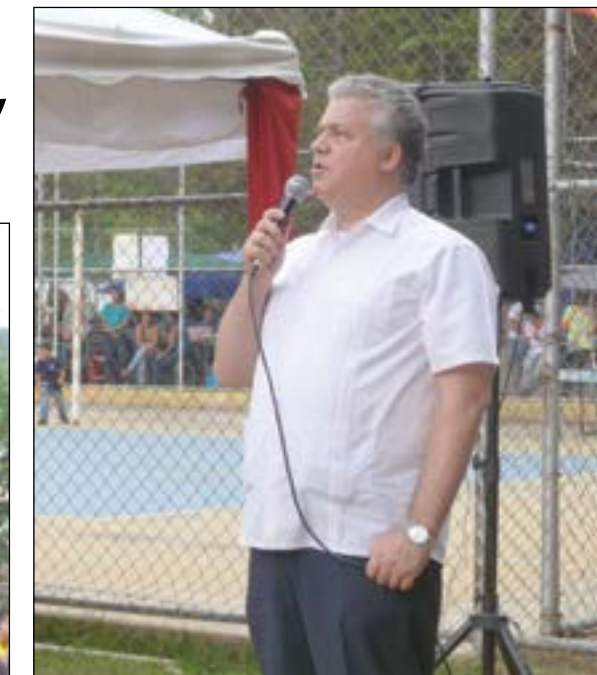
Embajador del Ecuador, Leonardo Arizaga

tando a nuestro país, a nuestro país fuera del territorio. Esto tiene más emoción, porque estamos