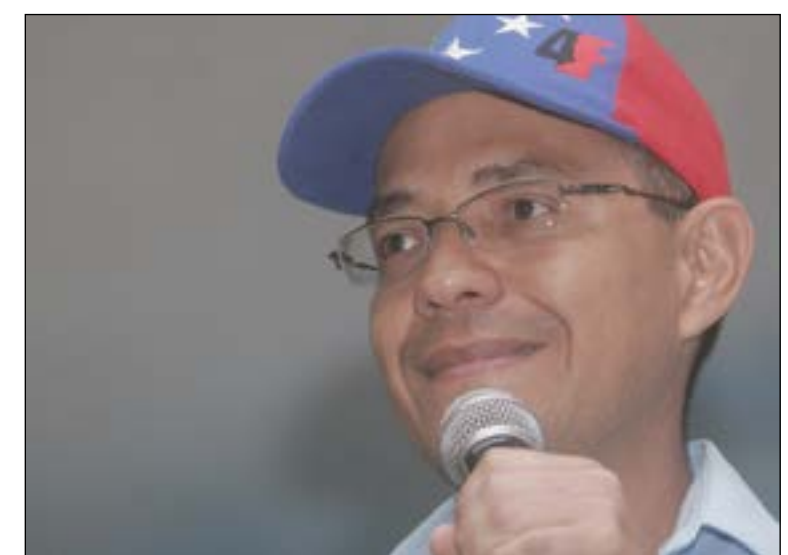
Ernesto Villegas, candidato a la Alcaldía Metropolitana

Ernesto Villegas, candidato socialista a la Alcaldía Metropolitana de Caracas, indicó este lunes que priorizará la seguridad ciudadana en las medidas que establecerá en su programa de gestión. Durante un contacto telefónico con la emisora Unión Radio, informó que de ganar los comicios municipales convocará a los cinco alcaldes de las jurisdicciones que integran la Caracas Metropolitana "con el objetivo de articular políticas de seguridad conjuntamente con el Ministerio para Relaciones Exteriores, Justicia y Paz". Asimismo, refirió que el contacto directo con las comunidades a través de los recorridos casa por casa le ha permitido recibir propuestas de las distintas parroquias de la ciudad capital para conformar su plan de gobierno municipal, el cual