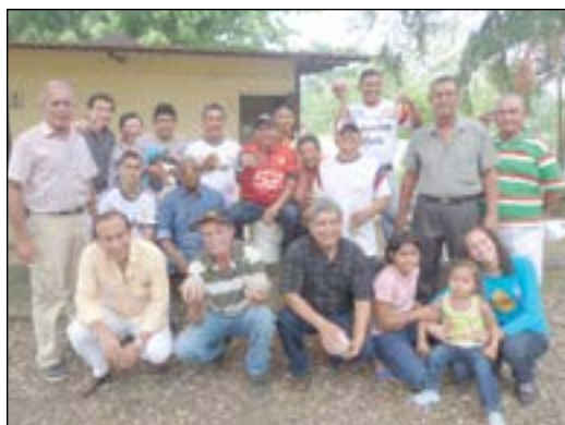
Compatriotas que participaron en el evento