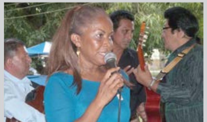
El Consulado General de Ecuador en Valencia-Venezuela, organizó La Semana de la Resistencia Indígena y Afroecuatoriana, con motivo de celebrarse en este mes... Pag. 2