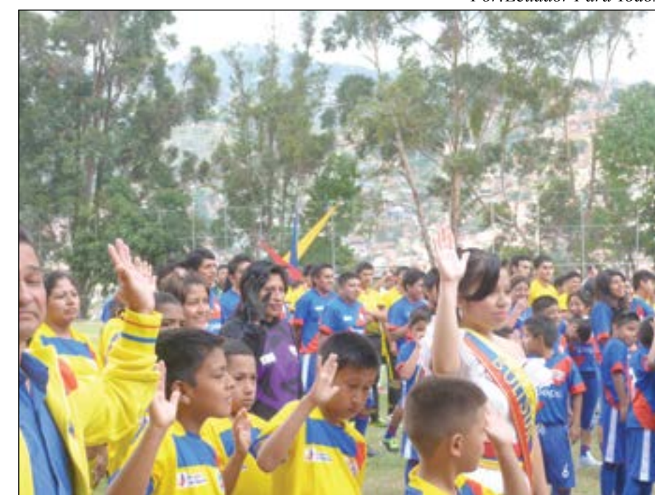
Los equipos que participaron en el Campeonato