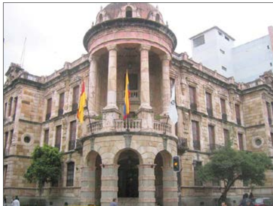
Vista frontal del primer edificio del Municipio de Cuenca

Típico loco de papas, "cuy asado", fritada y mote y mucho mas. Visite a Cuenca y tendrá para contar a sus amigos y familiares.