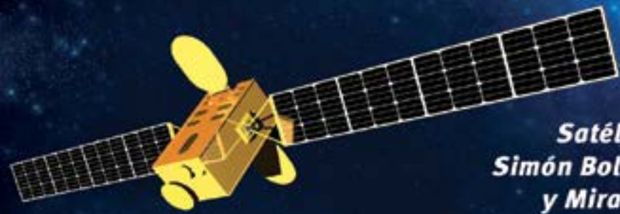
Satélites Simón Bolívar y Miranda