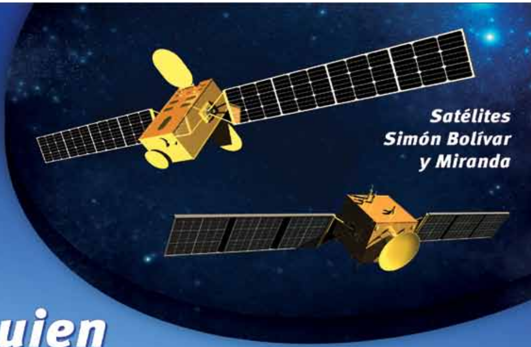
Satélites Simón Bolívar y Miranda