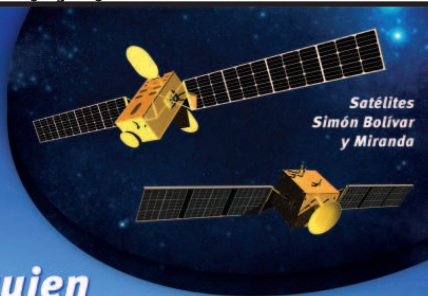
Satélites Simón Bolívar y Miranda