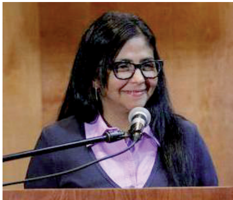
Delcy Rodríguez Ministra de Comunicación

Durante estos dos días, los casi doscientos comunicadores populares debatieron sobre tres temas: La Inserción del Poder Popular en los Medios Alternativos y Comunitarios, Proyectos Socio Productivos para los MAC y sobre El uso Responsable del Espacio Radio eléctrico. El debate fue intenso, considero, y necesario por cuanto hace ya mucho tiempo que el Movimiento Social de los Medios Alternativos y Comunitarios no se reunía. Desde aquellas memorables jornadas de discusión del Proyecto de la Ley de la Comunicación Popular, que luego de ser aprobada en primera discusión en diciembre del año 11 en la Asamblea Nacional duerme "el sueño de los justos", se produjo un gran desbande de los MAC y en el marco de este nació un, por muchos cuestionable, "Consejo Nacional de la Comunicación" y sus derivados estadales (más cuestionados aún) que han venido tratando de invalidar y descalificar esa gran movilización nacional que significó la discusión del proyecto de ley y suplantarla por "otra ley" plagada de imprecisiones fascistas. En Semanario Por Ahora consideramos impostergable el retomar la discusión y revisión del Proyecto de Ley de Comunicación Popular aprobado en 1ra. Discusión por la A.N. para adaptarlo a