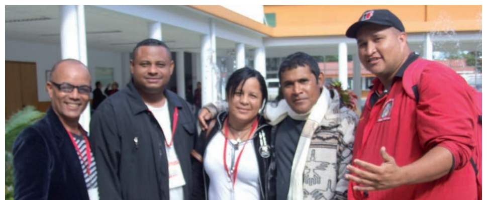
Periodistas Alternativos participantes de distintos MAC y lugares del país