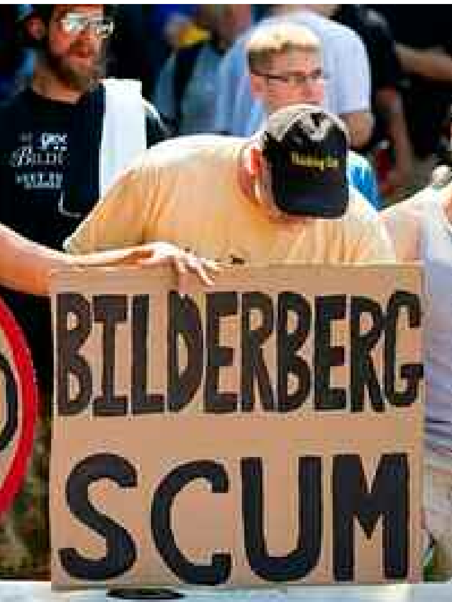
Activistas de EE.UU. protestaron por cumbre del Club Bilderberg año 2012

"Además, yo he sido elegido democráticamente en tres ocasiones, cosa que no ha hecho el mandatario español". Más claro, el agua.