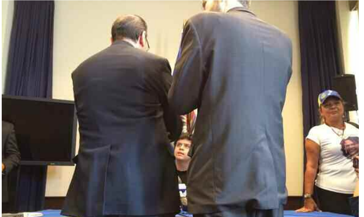
Acompañantes de María Corina Machado expulsados de la OEA

tengan mucho dinero, dudo que puedan huir de esta Venezuela, ya que esa acción sería la primera que