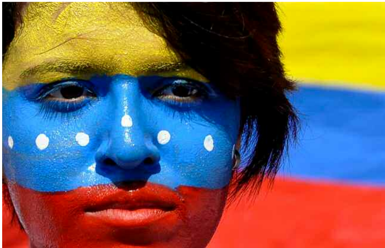
Hugo Chávez educó a bañarnos de tricolor

1. En lo político: Debido a la construcción de un modelo socialista y bolivariano, la población se ha dividido y polarizado en chavistas y opositores; la opinión pública también se ha dividido en 2 extremos opuestos, donde las voces moderadas de la oposición perdieron poder e influencia. El sector afecto al gobierno apoya las políticas públicas de la búsqueda del bien común y el sector no afecto al gobierno, por su irreverencia a este, es opuesto a toda política, inclusive la que afecte al sector de la burguesía. En ambos sectores polarizados