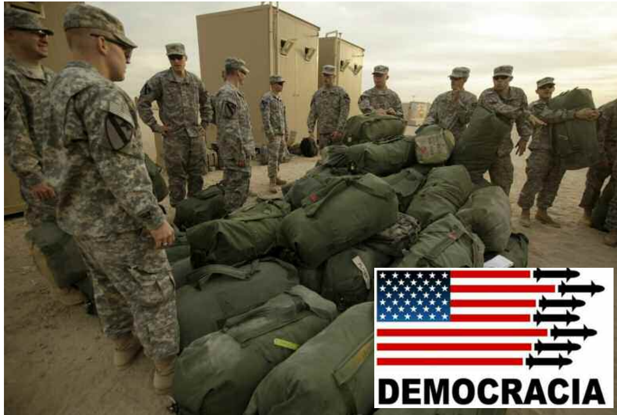
El doble discurso de USA

Investigaciones Neta Crawford y Catherine Luz realizaron el estudio de