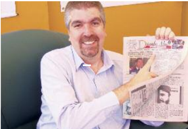
Presidente de VTV YURI PIMENTEL