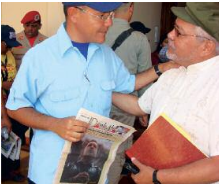
Ministro Ernesto Villegas con el periodico de Carlos Arvelo --- DIGALO AHI