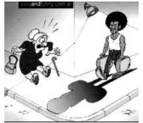
HUMOR EN TIEMPOS DE GUARIMBAS

Al irme por la mañana, te dejaré el dinero debajo de la almohada." Al día siguiente, cerca del mediodía, el hijo encontró el dinero bajo la almohada. Al ver la cantidad llamó al abuelo y le dijo, "Te dije que cada píldora costaba dos palos y me dejaste 4 palos ¿Te metiste dos viagras? No chamo " respondió el abuelo. ¡¡¡Los otros dos (2) los puso tu abuela!!!"