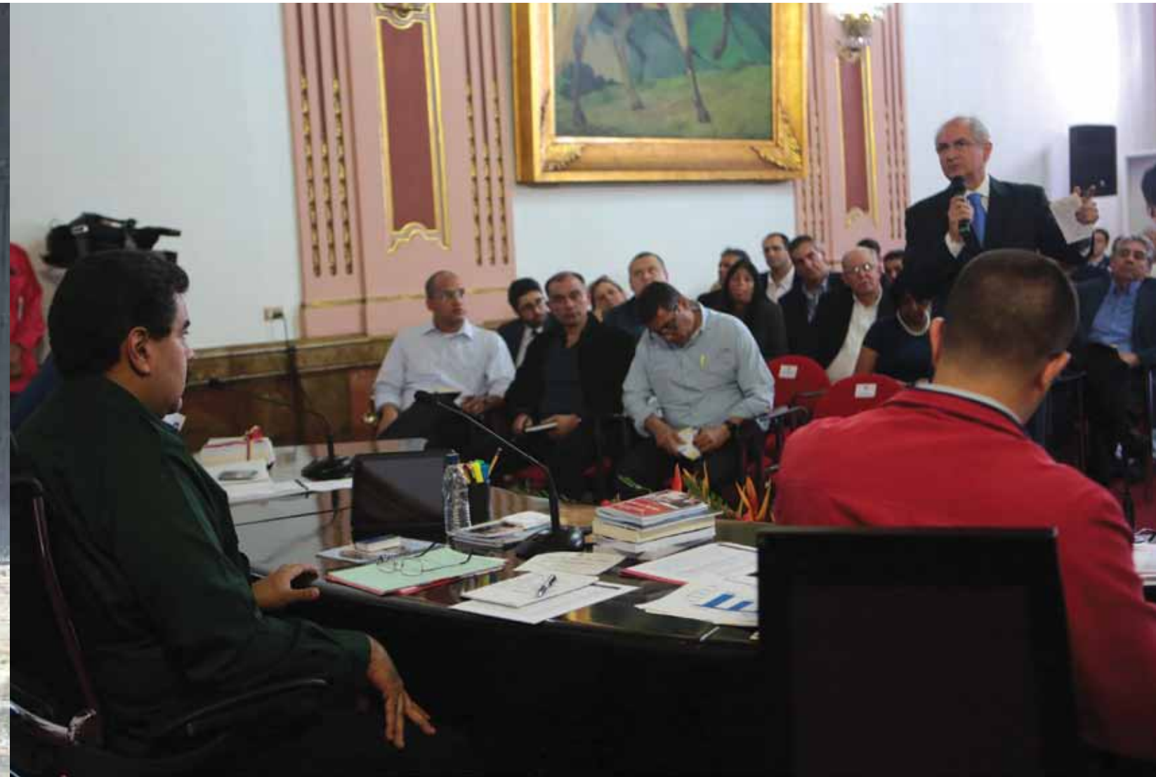
Celebración del Consejo Federal de Gobierno convocado por el presidente Nicolás Maduro, realizado el 18 de diciembre de 2013 en Miraflores, donde asistieron gobernadores y alcaldes de oposición y revolucionarios.