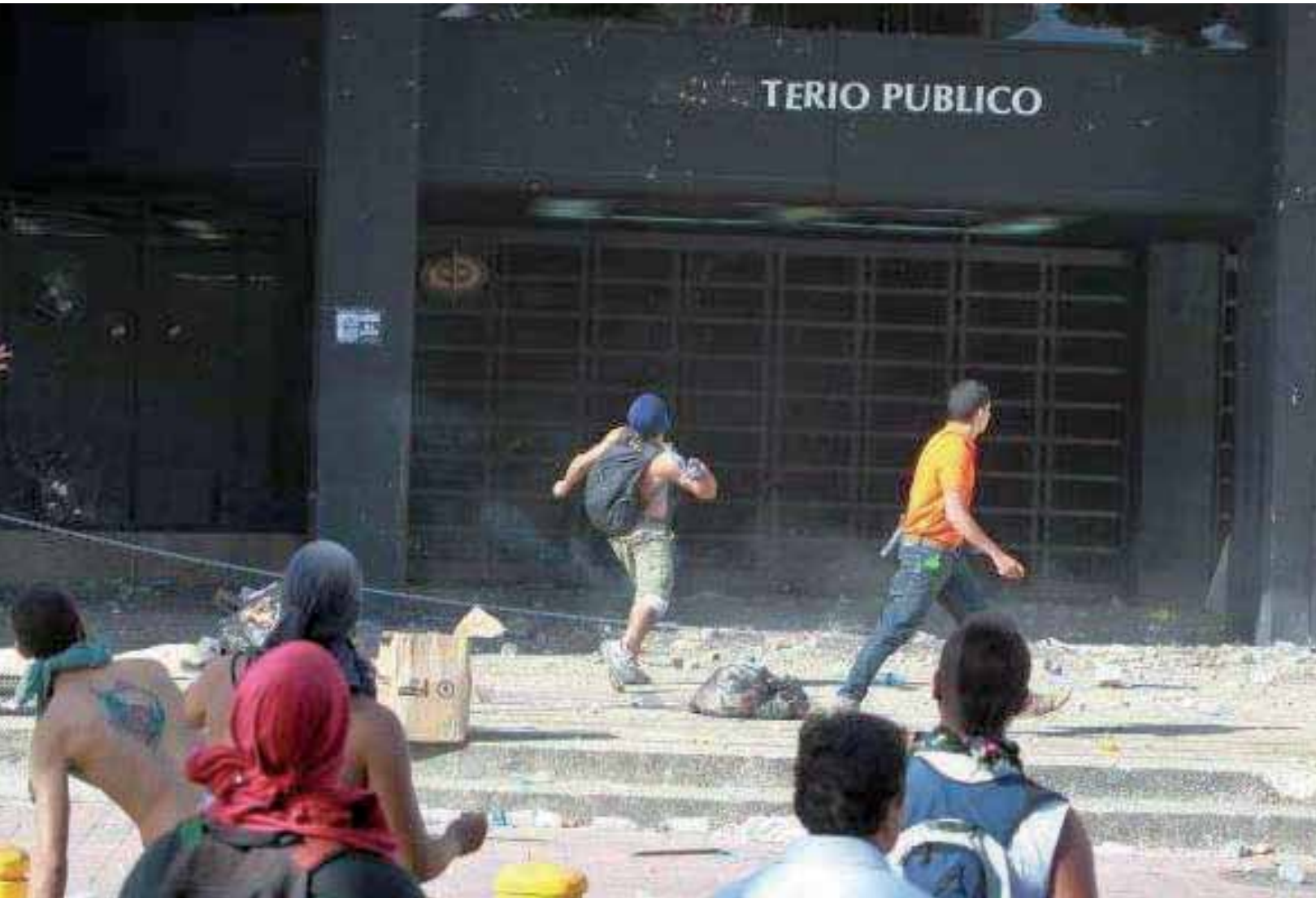
Ataques a la sede del Ministerio Público, el 12 de febrero de 2014, Caracas.