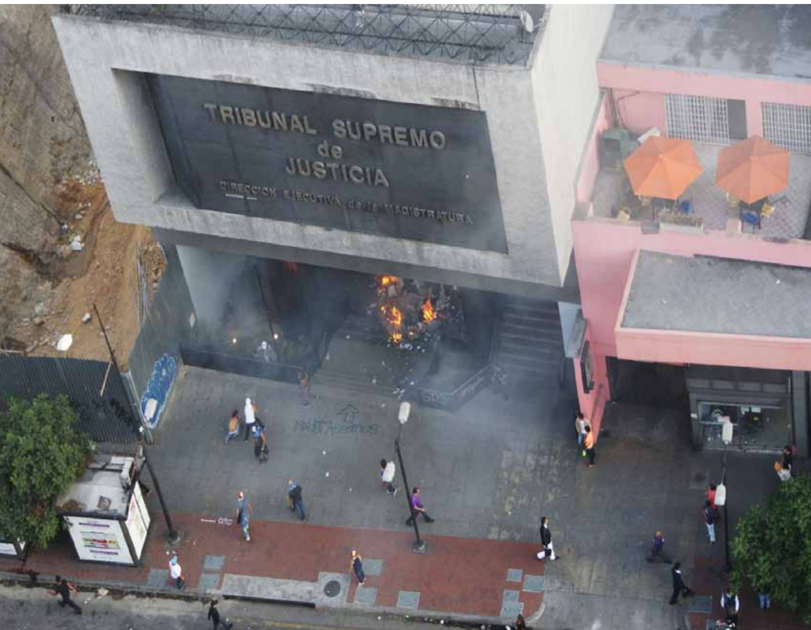
Una sede del Tribunal Supremo de Justicia, ubicada en un municipio gobernado por la derecha, fue asaltada e incendiada.