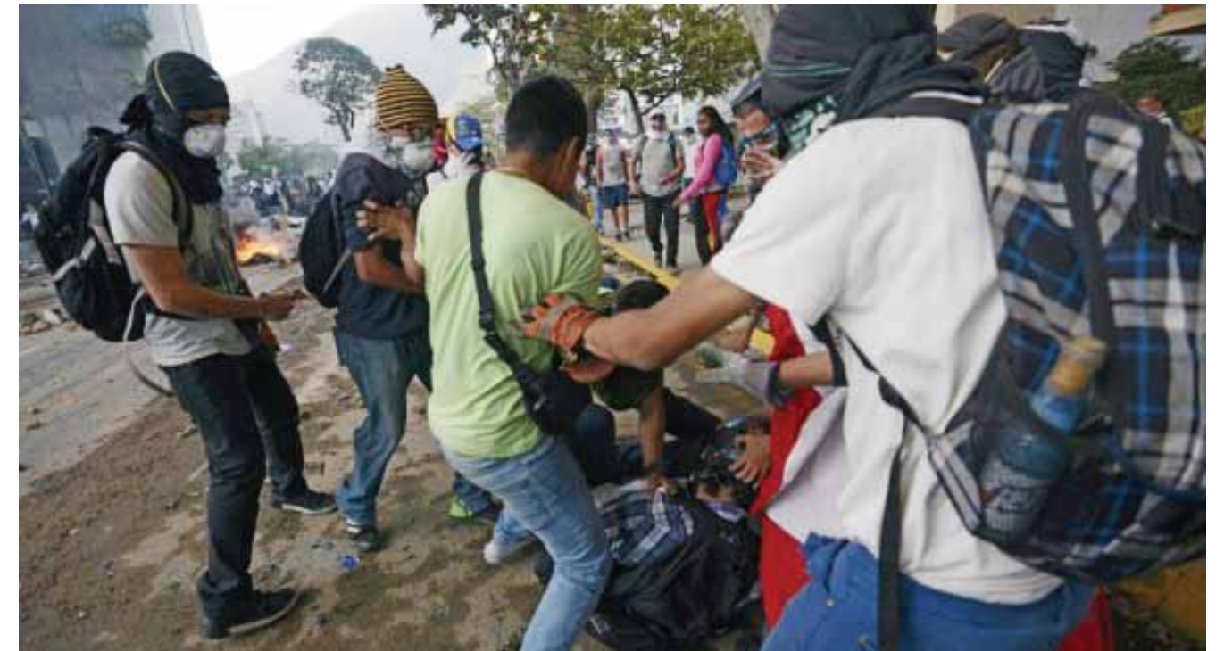
Un periodista es agredido por un grupo violento fuera de control en un municipio cuyo alcalde es de derecha.