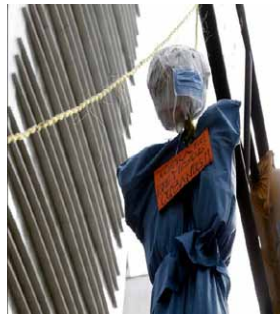
Amenazas de muerte se vieron en algunos de los municipios controlados por la derecha.