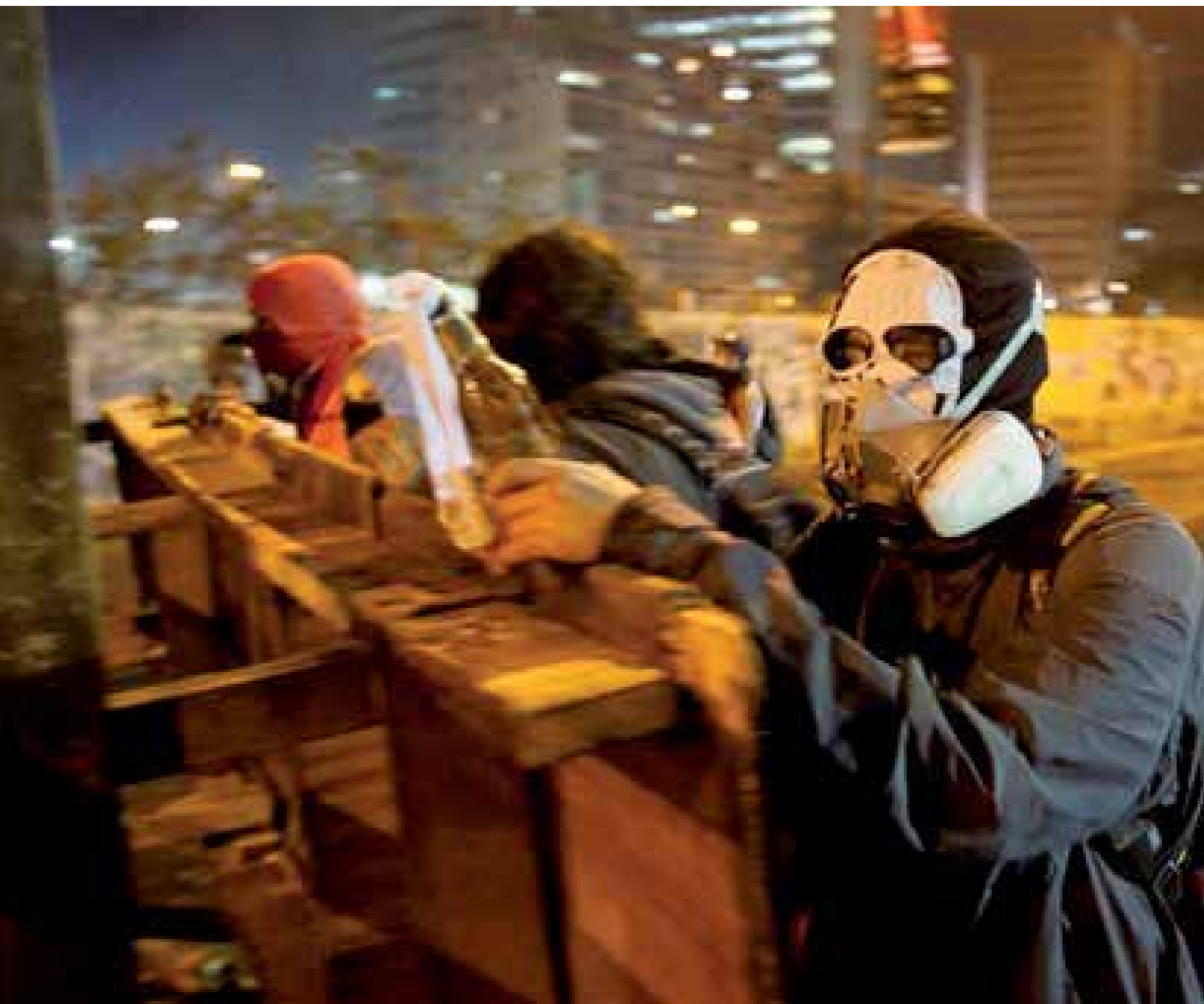
El guarimbero responde a la definición de terrorista: todo aquel que utilice la fuerza o la violencia, la amenaza o el terror para ejecutar un proyecto individual o colectivo.