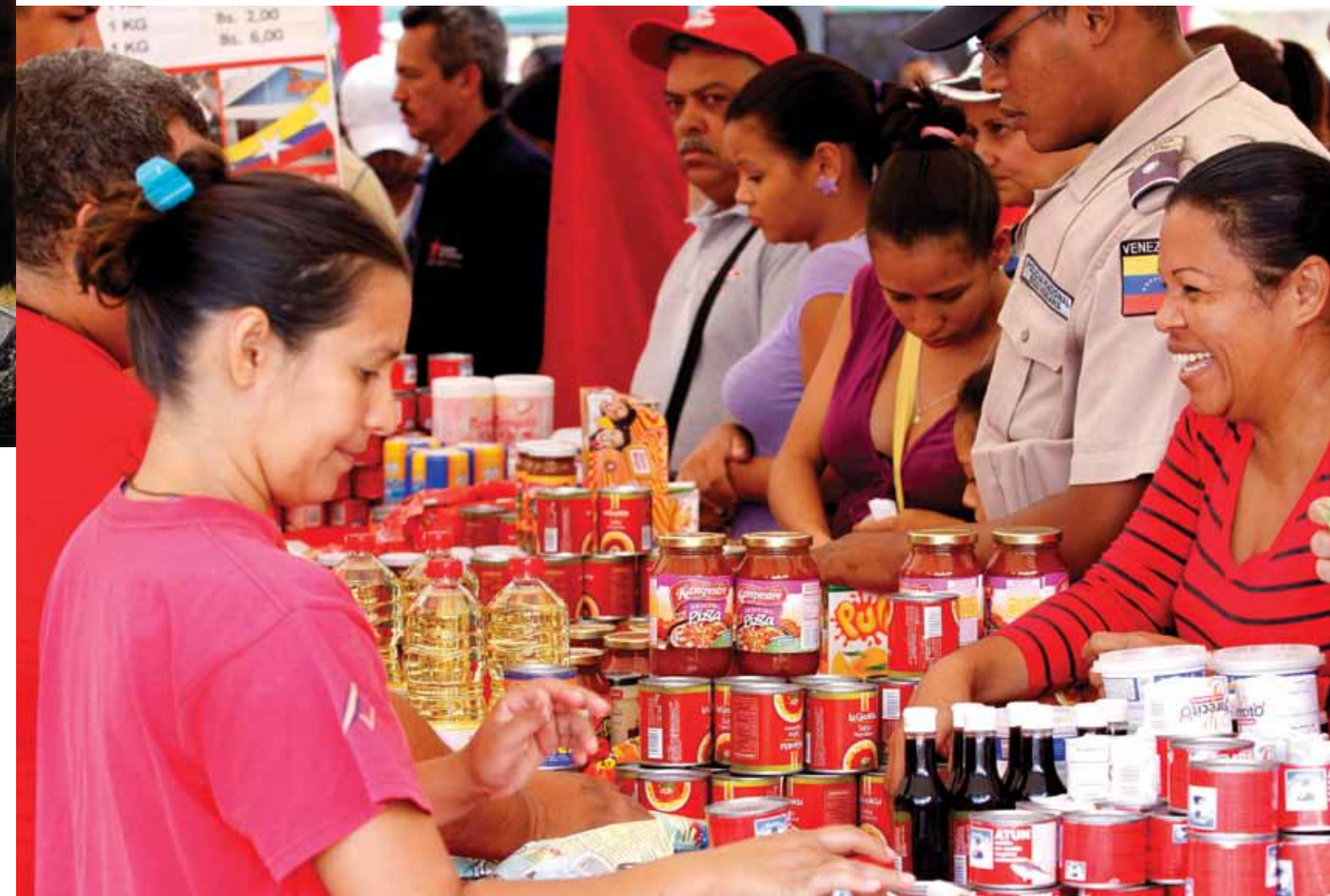
El Gobierno Bolivariano sigue realizando operativos especiales para la adquisición de alimentos básicos, donde se encuentran a precios muy asequibles.

constituido. La amplia victoria en los comicios municipales de las fuerzas revolucionarias, cuyos votos superaron a los de la oposición con una diferencia superior a los 11 puntos, enfrió la mecha del golpe y permitió a los venezolanos disfrutar de unas navidades tranquilas. El presidente Nicolás Maduro ganó con comodidad el “plebiscito” de diciembre y el país cerró el año con una tregua política que no duraría demasiado.