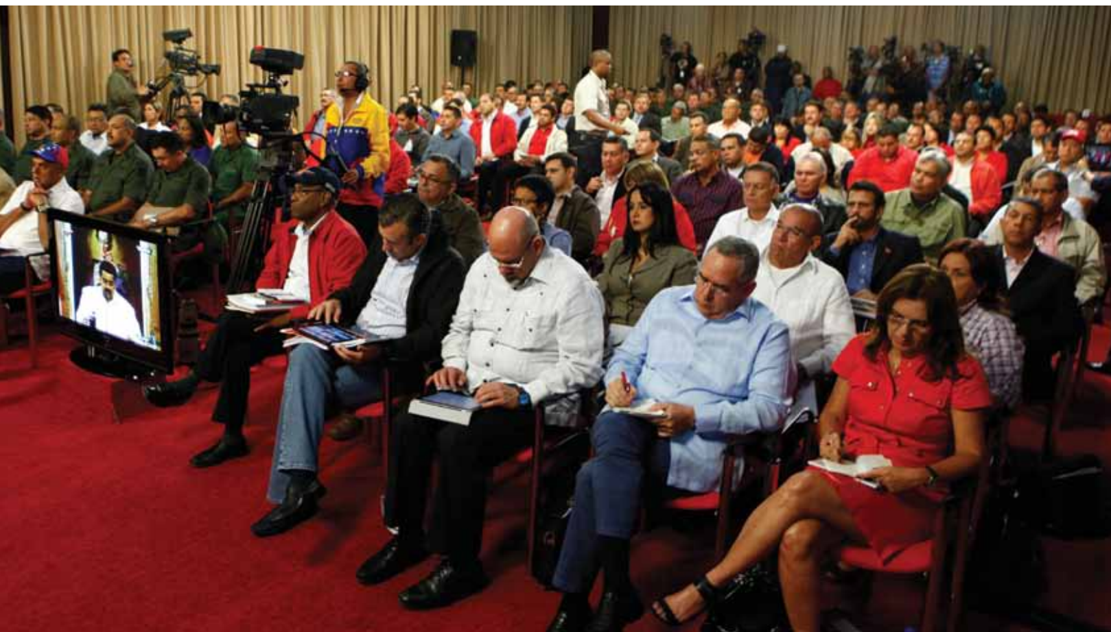
Segunda reunión realizada por el presidente Maduro con los alcaldes y gobernadores de oposición y revolucionarios, celebrada el 8 de enero de 2014 en Miraflores, Caracas.

Son varios los tratados y acuerdos internacionales que se han realizado para proteger a los pueblos del terrorismo, entre ellos, la Convención de Ginebra contra el Terrorismo de 1937 que define el terrorismo como “actos criminales que se cometen contra el Estado, con el objetivo de exponer al terror a determinadas personalidades o a grupos determinados de personas o público”.