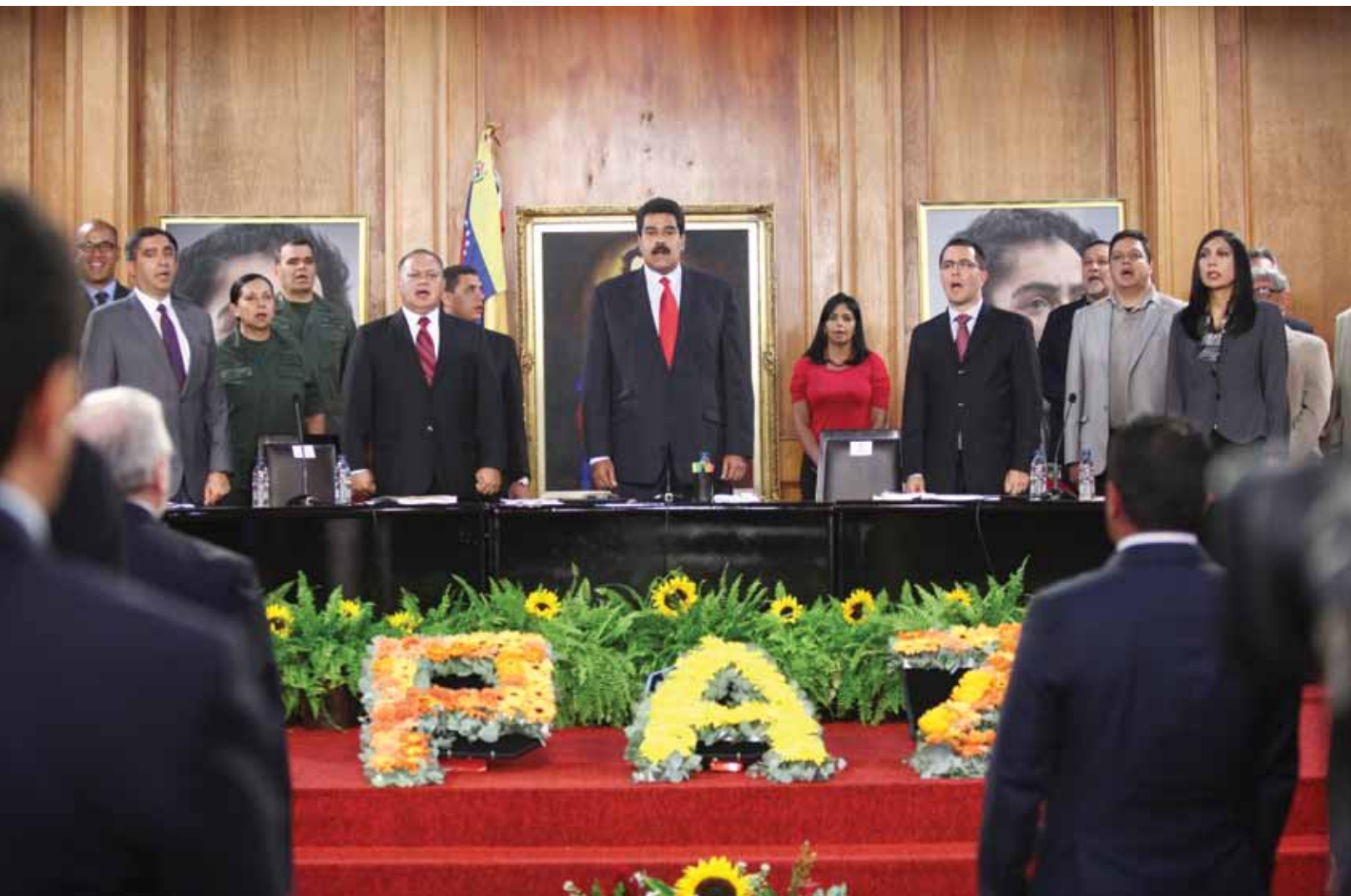
El presidente Nicolás Maduro celebró una Conferencia de Paz con todos los sectores del país.

Con esa expresión la OEA condena la violencia y descarta intervenir en asuntos internos de Venezuela.