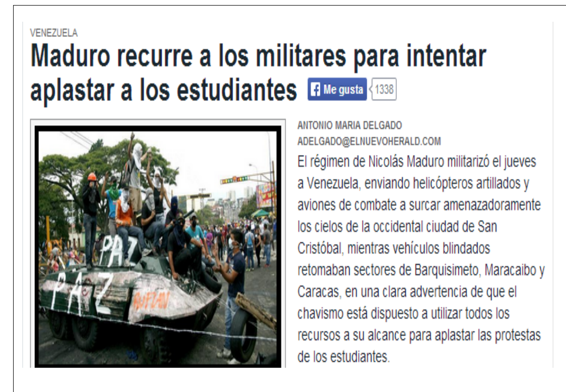
El Nuevo Herald de Miami inventa noticias y hace pasar un viejo tanque, hoy de ornato, como armamento que habría sido usado contra manifestantes.