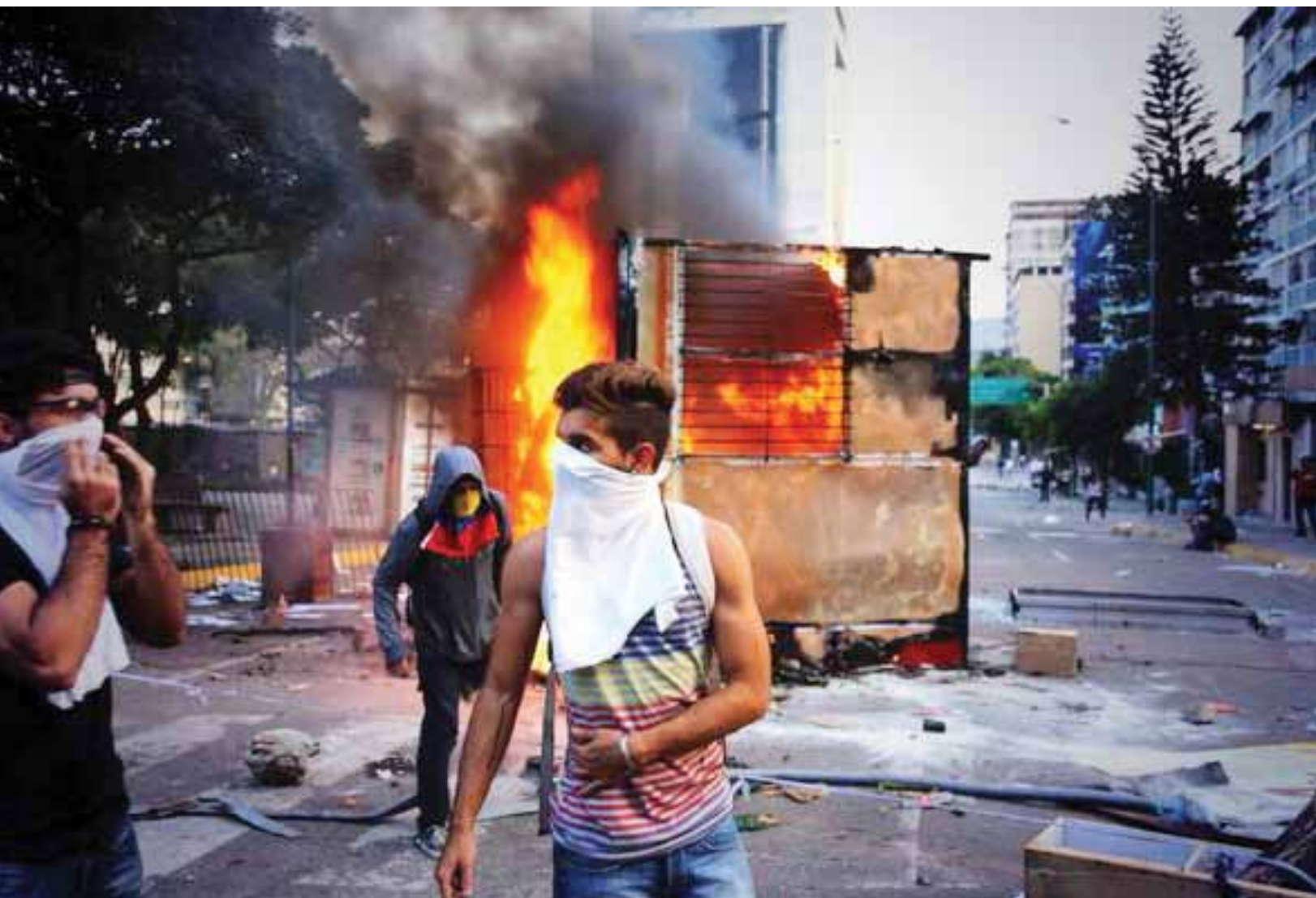
Destruyeron y quemaron una caseta de servicio del transporte superficial, Metrobús, en el municipio Chacao.

nes y pronunciamiento militares, se obliga la renuncia del Presidente. En casos de fracasos, se mantiene la presión de calle y se migra hacia la resistencia armada, preparación del terreno para una intervención militar o el desarrollo de una guerra civil prolongada.