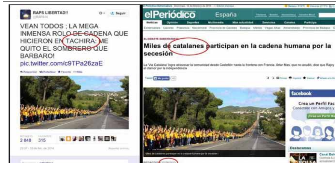
Se pretende hacer creer que una protesta sucede en el estado Táchira, cuando en realidad se trata de España.