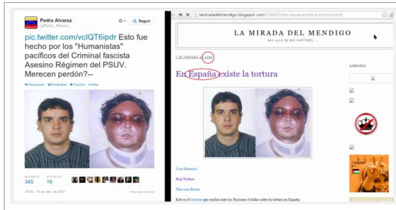
Una denuncia de maltrato en España la convierten en un caso venezolano en los laboratorios de guerra psicológica.

por “colectivos armados” apoyados por el Gobierno, mientras que los actos vandálicos y las guarimbas terroristas son mostradas de forma confusa como parte de un caos en un país sin control.