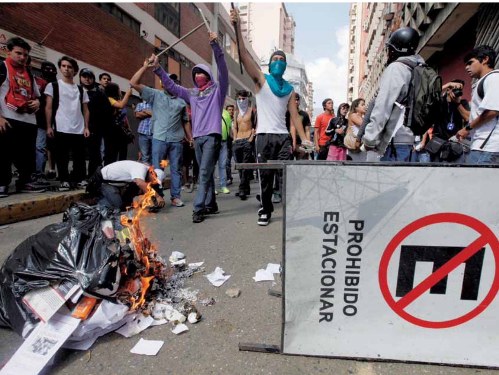
Las acciones vandálicas se extendieron por el país luego del llamado a la calle hecho por Leopoldo López y María Corina Machado.

Fue este personaje el que dio la voz de partida al plan insurreccional que se ejecuta en la actualidad contra el gobierno democrático de Venezuela con su llamado hecho el 23 de enero a permanecer en las calles hasta lograr el derrocamiento del presidente Nicolás Maduro. “Los venezolanos están obligados a exigir la salida de un gobierno corrupto”.