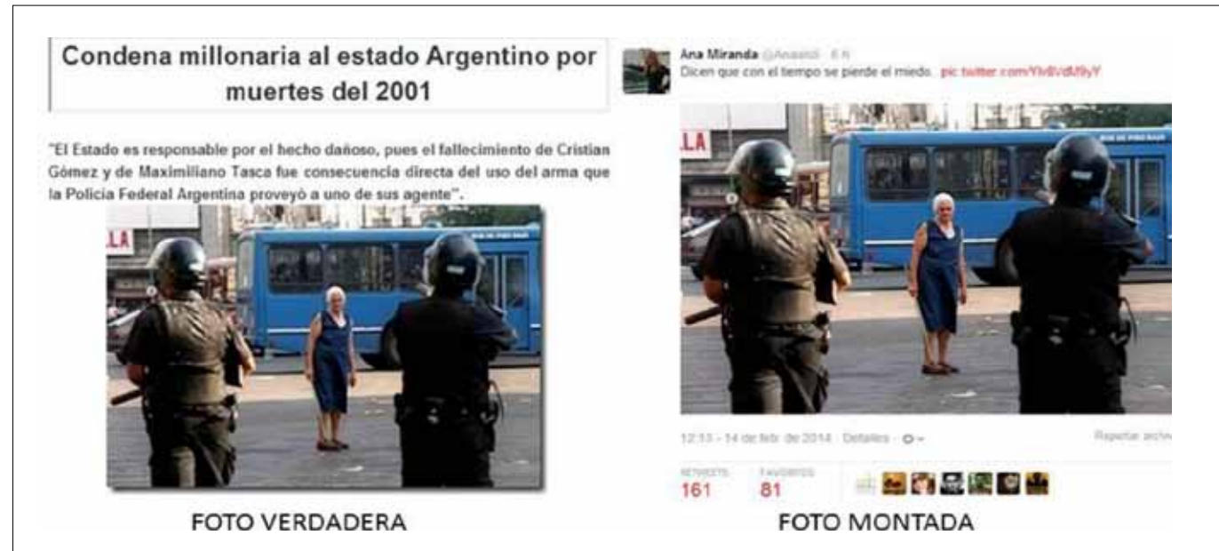
Un evento sucedido en Argentina en el año 2001 lo publicaron en las redes sociales como algo reciente en Venezuela.