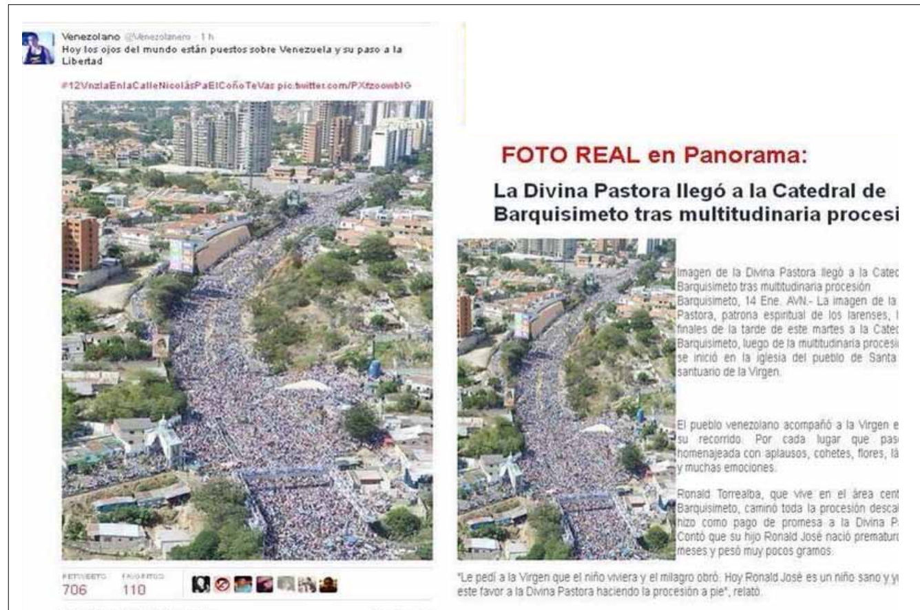
Una manifestación religiosa en la ciudad de Barquisimeto es presentada falsamente como una protesta contra el Gobierno.

dencial en tanto que representaba a la cadena CNN en Español, que mantenía un acompañamiento constante y replicador de los eventos de violencia, amplificando su real dimensión.