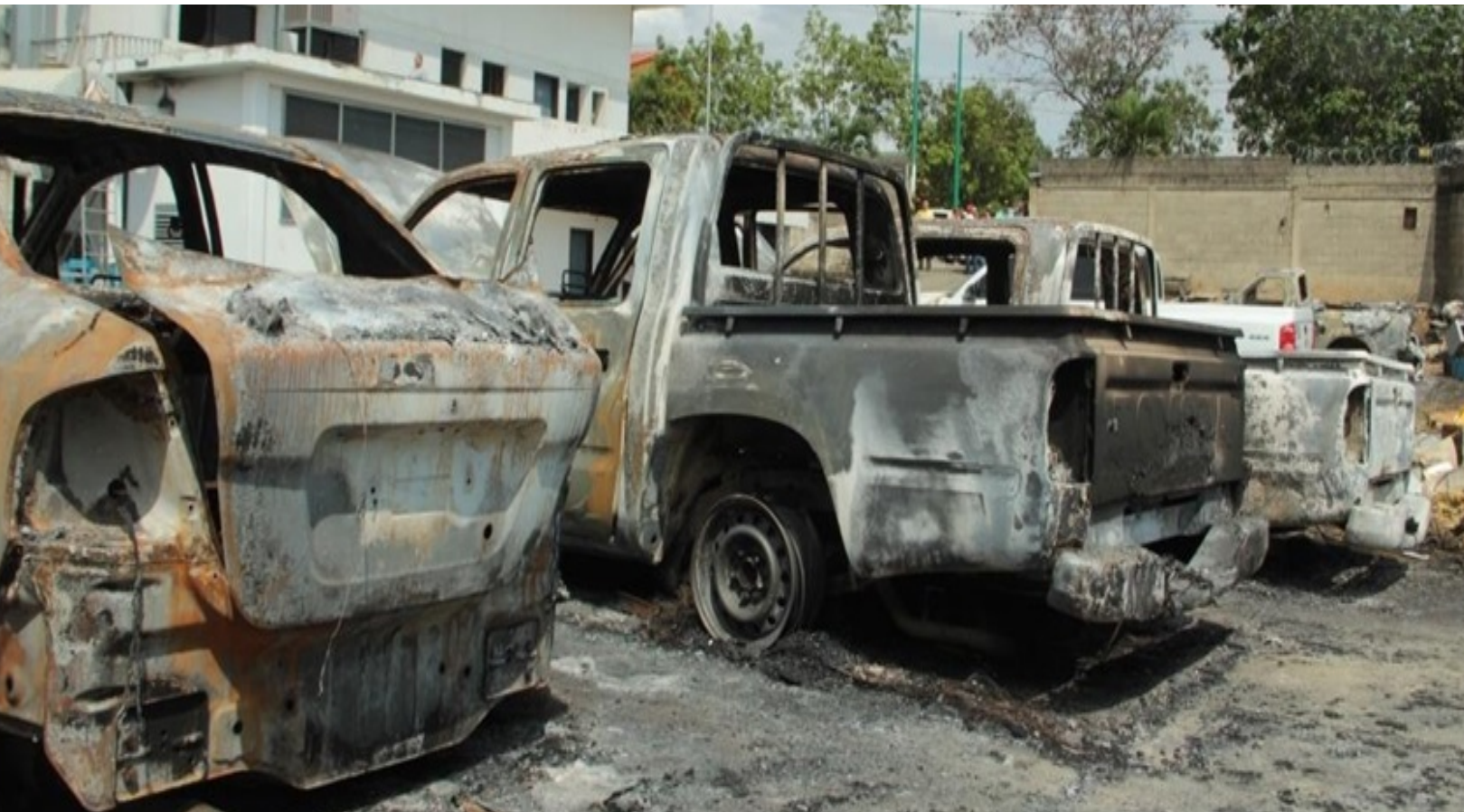
Centrales telefónicas, así como las unidades de transporte, han sido incendiadas, poniendo en riesgo la vida de los trabajadores y afectando el servicio.

Aunque las guarimbas se han circunscrito a los pocos municipios de clase alta donde la oposición domina las alcaldías, sus consecuencias han sido trágicas. La mayoría de los fallecidos en esta ola de disturbios han sido víctimas inocentes de los hechos vandálicos que caracterizan a la guarimba y que no han afectado a las zonas populares donde el apoyo al Gobierno revolucionario se mantiene firme. De los 335 municipios que existen en Venezuela, solo en 18 ha permeado la violencia inoculada por una oposición arrogante que pretende ser gobierno después de haber perdido cuatro elecciones en un año.