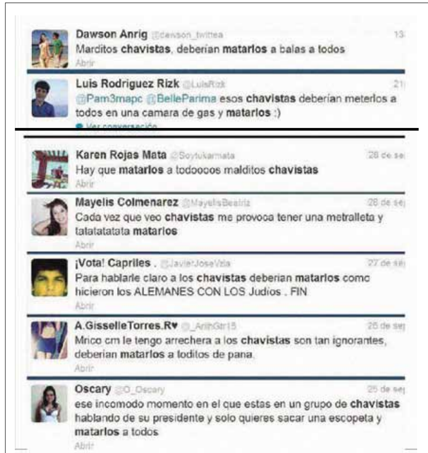
Parte de la guerra psicológica llevó a algunas personas a expresar mensajes de odio mediante las redes sociales.