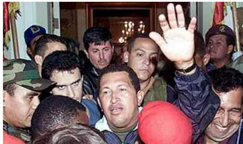
Las leyes habilitantes fue uno de los detonantes que hizo explotar a la derecha. El control de PDVSA por parte de EEUU a través de gerentes que operaban para el imperialismo, constituyó otro agravante para que la Revolución Bolivariana, avanzará con pie firme para desmontar todo el aparato tecnológico que funcionaba en favor de los intereses estadounidenses. Chávez, regresa al Poder.