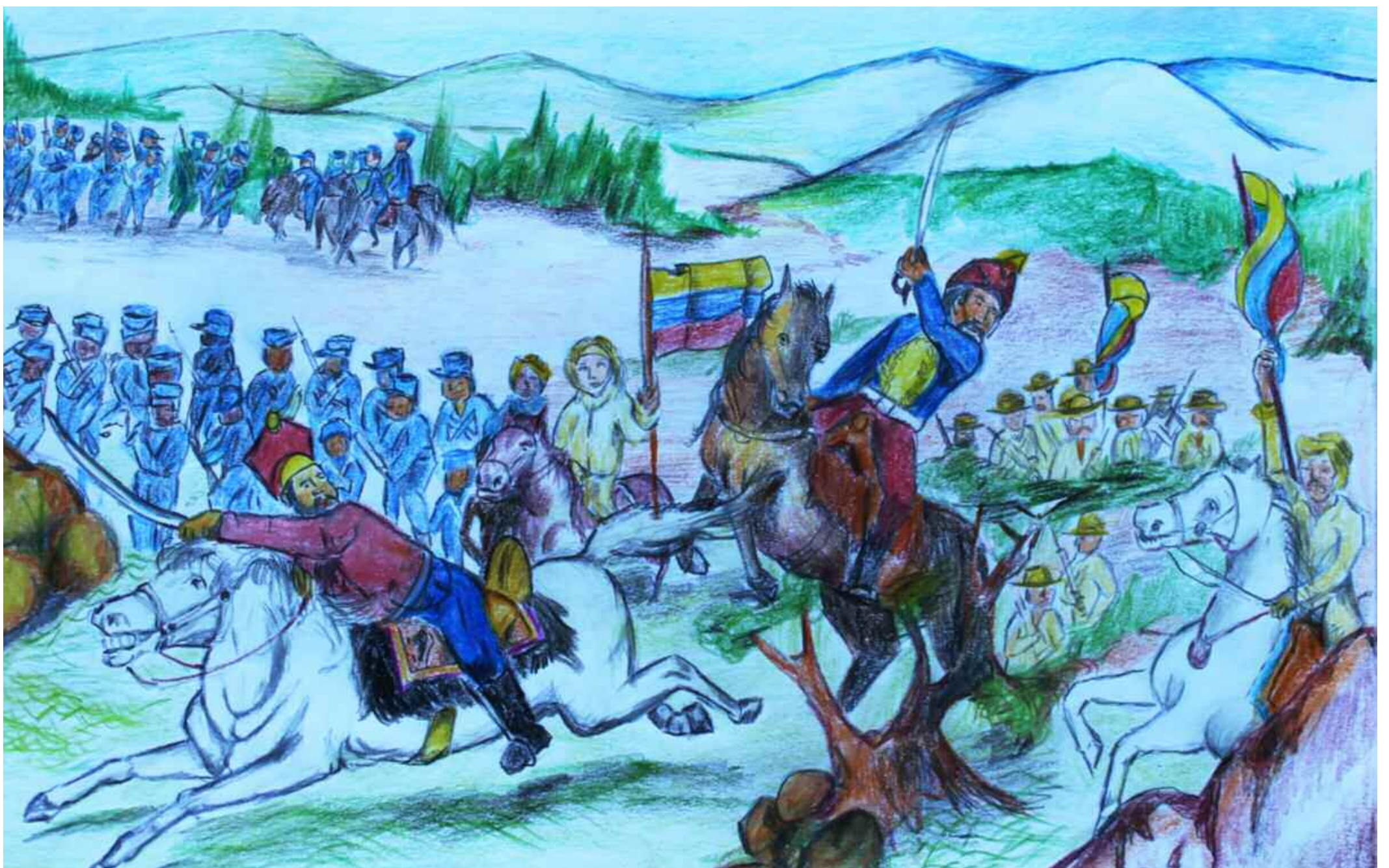
Dibujo sobre la escenificación de la batalla de Chirica, créditos: Pablo Ugas

Prensa Obrerista.- A 197 años de aquel memorable 11 de abril de 1817, el General Piar, con sus tropas tomó las inmediaciones de la Mesa de Chirica con anticipación dando un duro golpe a los colonizadores.