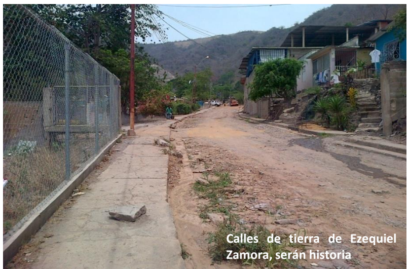
Calles de tierra de Ezequiel Zamora, serán historia