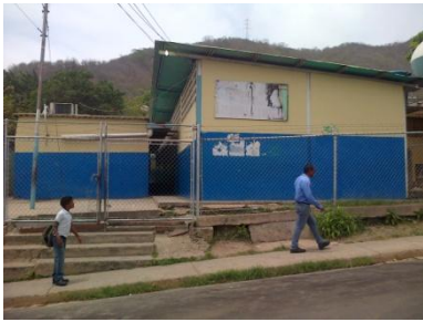
En escuela se espera por infocentro.

La actual escuela, cuenta con cinco aulas, una de ellas, disponible para un infocentro que espera la dotación de equipos tecnológicos por parte de PDVSA Refinación Oriente.