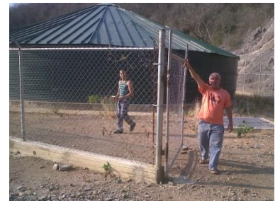
Gobierno de la eficiencia mayor cumplió con tanque para el pueblo.

Reside en la zona durante más de 30 años. Relató que sueña con que su familia crezca en una comunidad "bella" comparándola con las exóticas orquídeas que extrae con pasión para sus jardines, de los cerros aledaños.