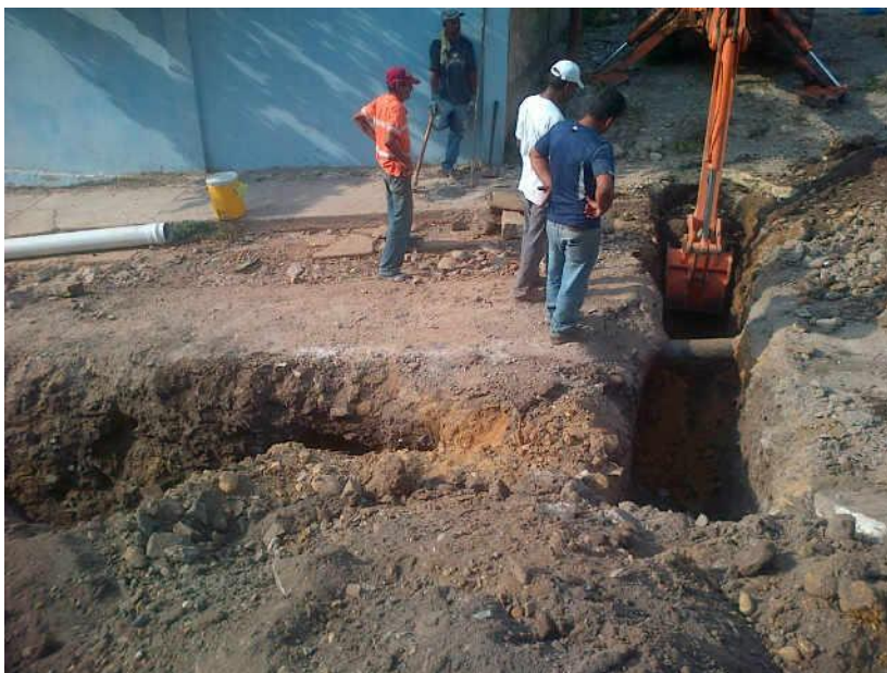
COVINEA adelanta trabajos de cloacas para luego aplicar más de 200 metros de pavicrete.

Comentó que sigue el lineamiento del máximo líder de la revolución para ver cambios importantes y un mejor vivir en su sector. Actualmente, en la parte alta de la comunidad se da respuesta al pueblo que durante cierto tiempo esperaba la instalación de cloacas y condicionamiento de más de 180 metros de vialidad.