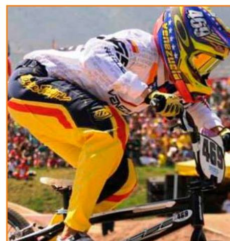
Caracas, 28 Abr.