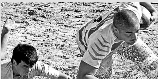
Rugby de playa