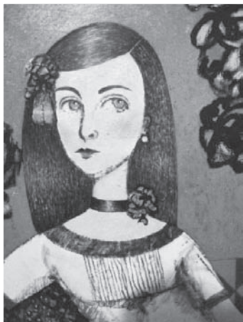
La Niñita de Piedra Azul Obra de: Alfonso Márquez Ceballos

Trayectoria, valor y aportes de las mujeres a lo largo de la historia