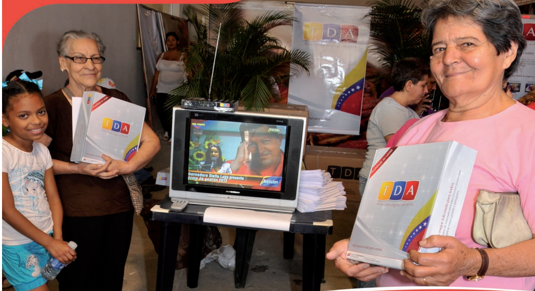
Comunidad de Maca, Petare.

Desde hace más de 1 año, la Televisión Digital Abierta ha llegado a más de 390 mil hogares* en 21 centros urbanos.