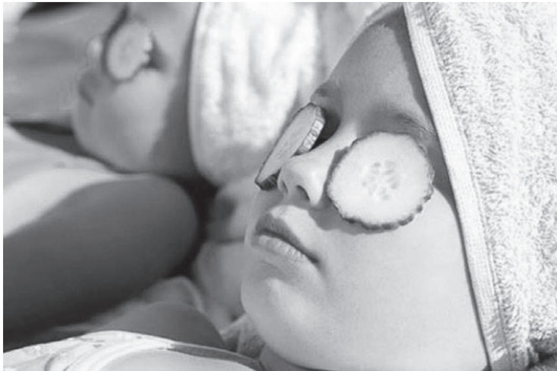
Spa y salones de belleza infantil: manicura, pedicura, maquillaje, peinados... para que las niñas pueden sentirse princesas, o alimentar su sueño de “vivir en un castillo”...

“...el conocimiento estaba antes que el sexo porque sólo por el conocimiento podía neutralizar o trascender su sexo. Cualquiera que hayan sido las causas psicológicas de su actitud, toda su vida estuvo movida por la voluntad de penetrar el mundo del saber: un mundo masculino. Negación al matrimonio, amor