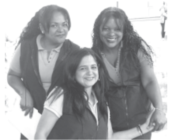
Directora y docentes complacidas