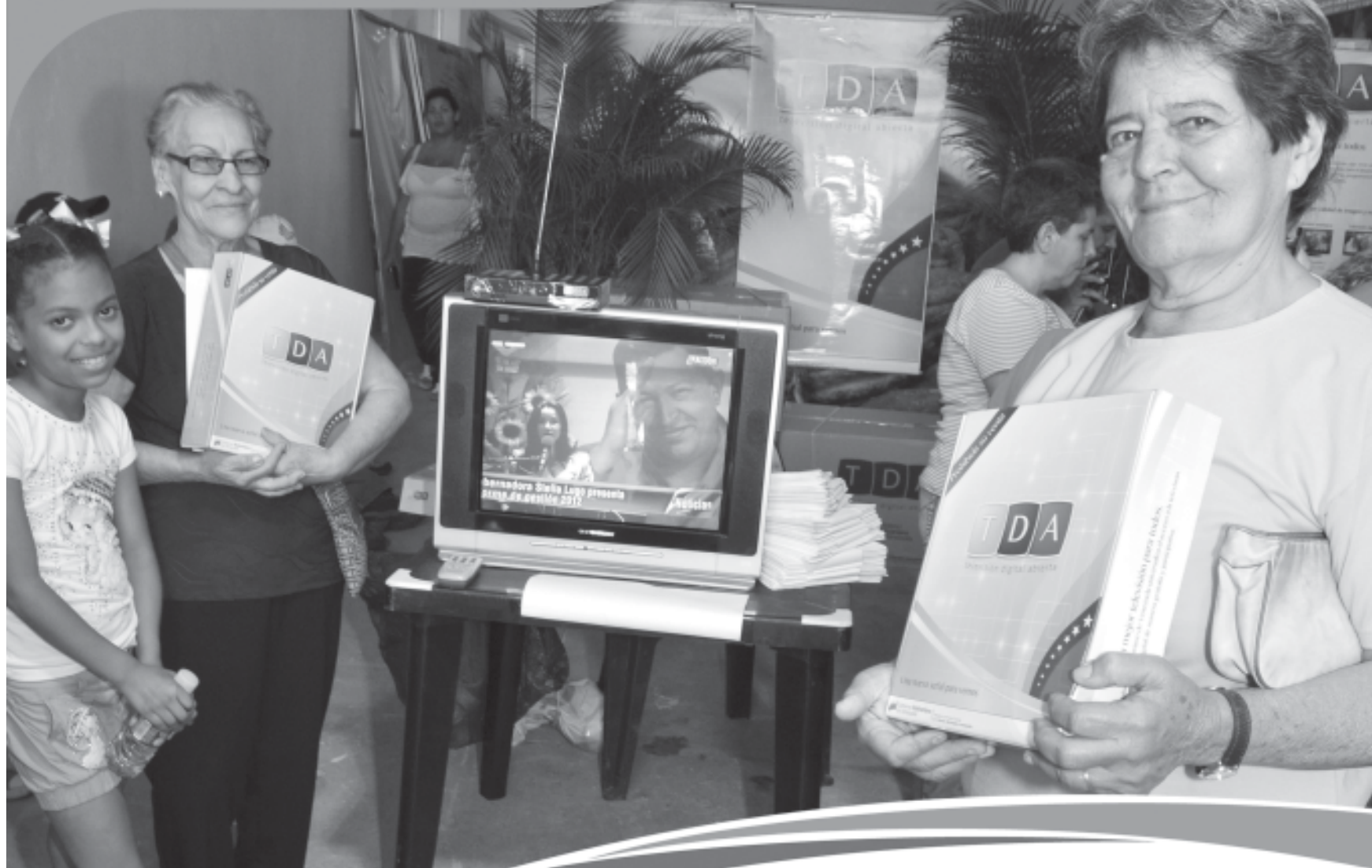
Comunidad de Maca, Petare.

Desde hace más de 1 año, la Televisión Digital Abierta ha llegado a más de 390 mil hogares* en 21 centros urbanos.