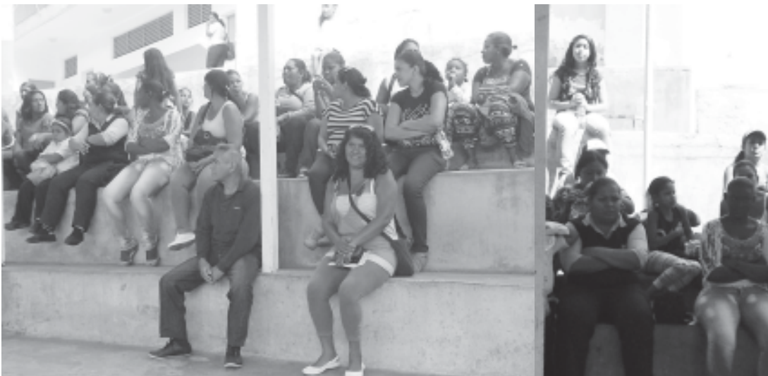
Padres y representantes atentos a la exposicion que realizan los voceros .