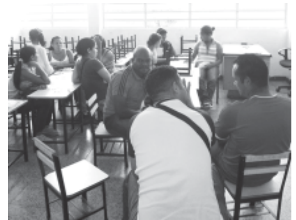
En plena discusion calidad educativa