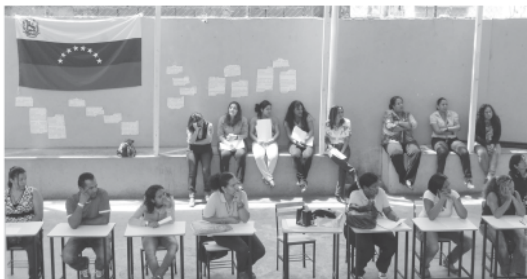
Voceros y voceras exponiendo los resultados de cada mesa de trabajo, grupo de docentes atentas.

En lo que se refiere al llamado que hizo el Ministerio del Poder Popular para la Educación para la Consulta Nacional de la Calidad Educativa, se siente plenamente agradecida de la participación activa, protagonista de todos los actores que hacen vida en la Escuela Básica Nacional Julio Calcaño, como lo son primeramente nuestros estudiantes, padres y representantes, docentes, diferentes colectivos como madres de barrio, Comité de salud, consejos comunales, profesores cubanos entre otros, quienes realizaron aportes valiosos para la transformación de la escuela que todos queremos.