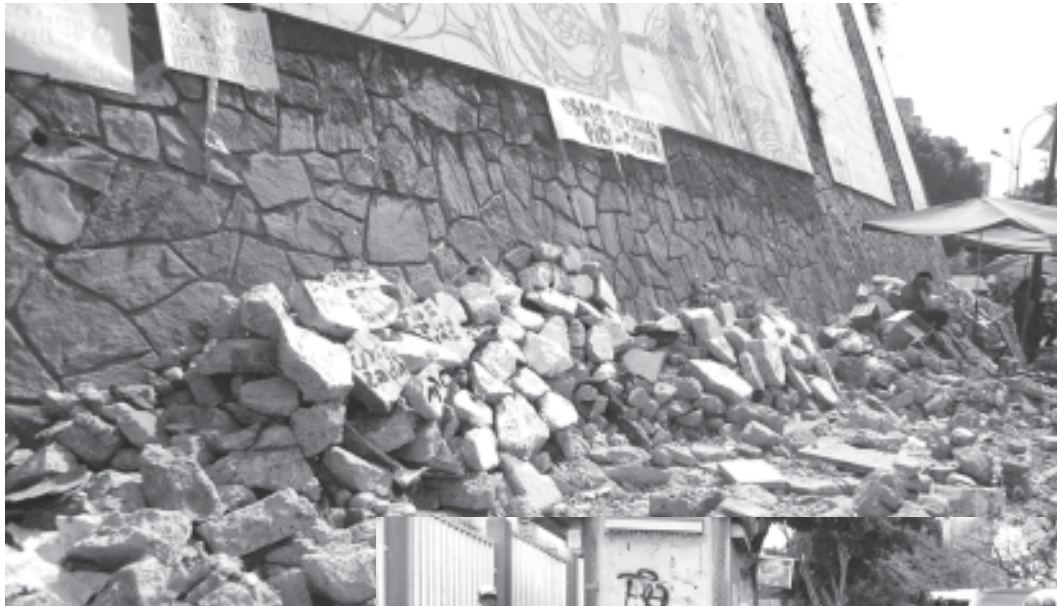
Hasta cuando las montañas de piedras