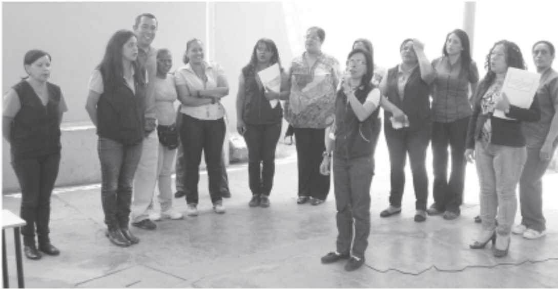
Personal del plantel guía la entonacion del himno al Estado Miranda para cerrar la consulta.