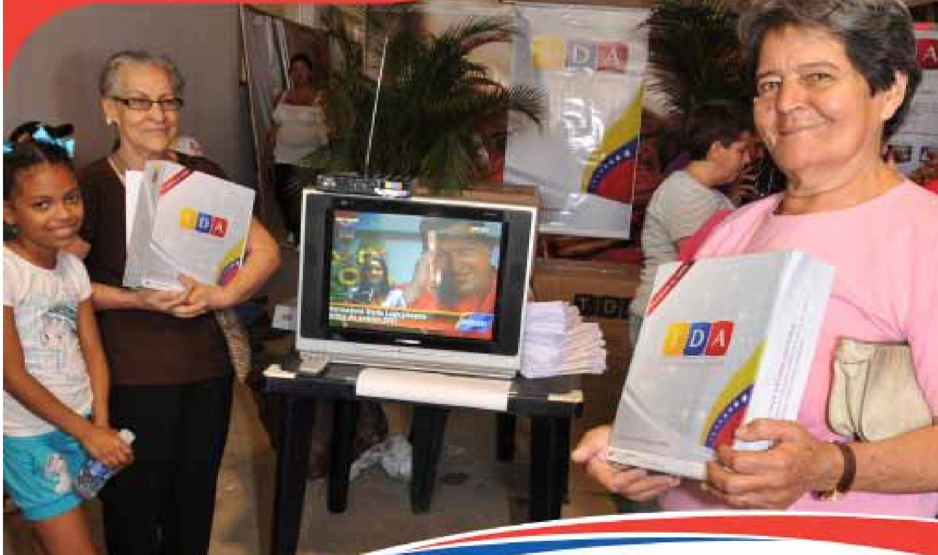
Comunidad de Maca, Petare.

Desde hace más de 1 año, la Televisión Digital Abierta ha llegado a más de 390 mil hogares* en 21 centros urbanos.