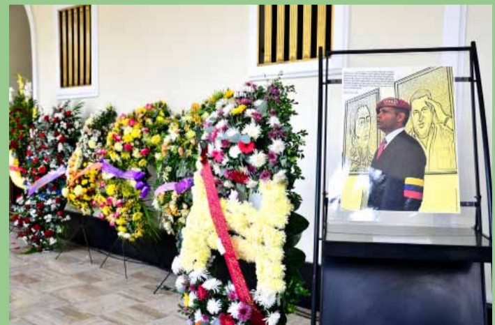
En el Hemiciclo de la Asamblea Nacional, fueron velados los restos del ex presidente del Concejo Municipal de Libertador.