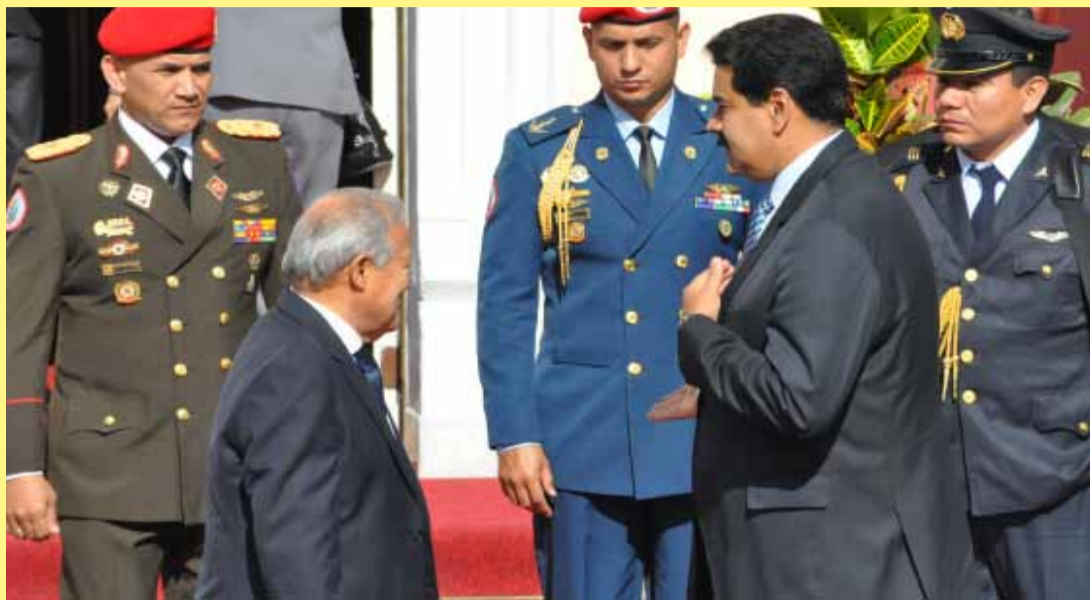
El presidente de El Salvador, Salvador Sánchez Cerén, fue recibido en Miraflores, por el presidente Nicolás Maduro y el canciller Elías Jaua.

El presidente de la República, Nicolás Maduro, y su homólogo salvadoreño, Salvador Sánchez Cerén, firmaron este viernes en El Cuartel de la Montaña una declaración conjunta con el fin de fortalecer las áreas económica, energética, social y cultural de ambas naciones. En la declaración, Venezuela y el país centroamericano ratificaron el compromiso con la independencia y soberanía popular como vías fundamentales para el fortalecimiento democrático de las naciones "como garantía absoluta para las transformaciones sociales, económicas y culturales necesarias para brindar la mayor felicidad y dignidad posible a los pueblos". Del mismo modo, se acordó fortalecer los lazos de hermandad que durante la última década han alcanzado frutos en materia económica, social, energética y cultural mediante organizaciones multinacionales como Petrocaribe, entre otras.