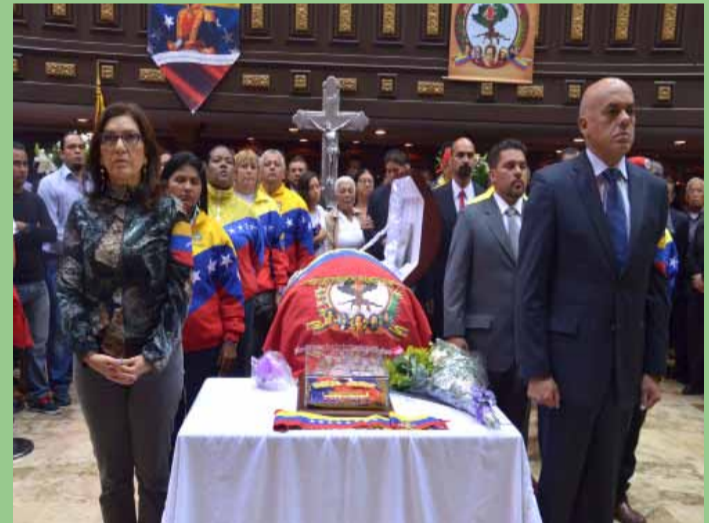
Guardia de Honor: La Jefa de Gobierno de Distrito Capital, Jacqueline Faría, el Alcalde de Caracas, Jorge Rodríguez, y concejales.