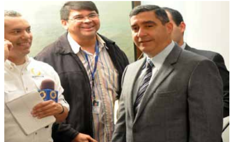
Rueda de Prensa en Min. Relaciones Interiores