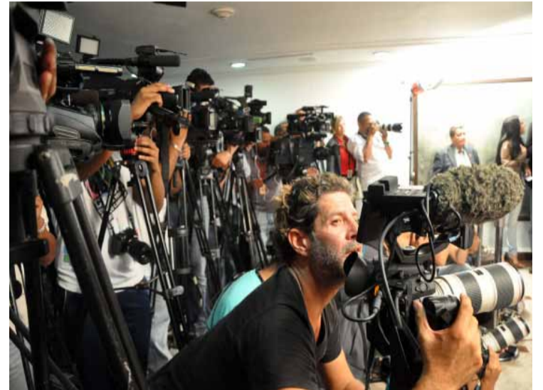
Día del Reportero Gráfico. ¡Felicidades a los colegas!