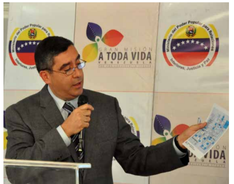
Ministro Miguel Rodríguez Torres.