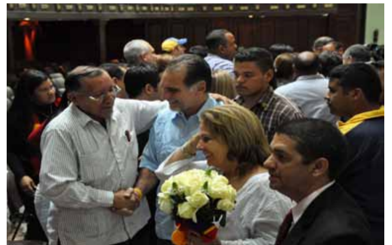
El pueblo saluda al héroe cubano René González