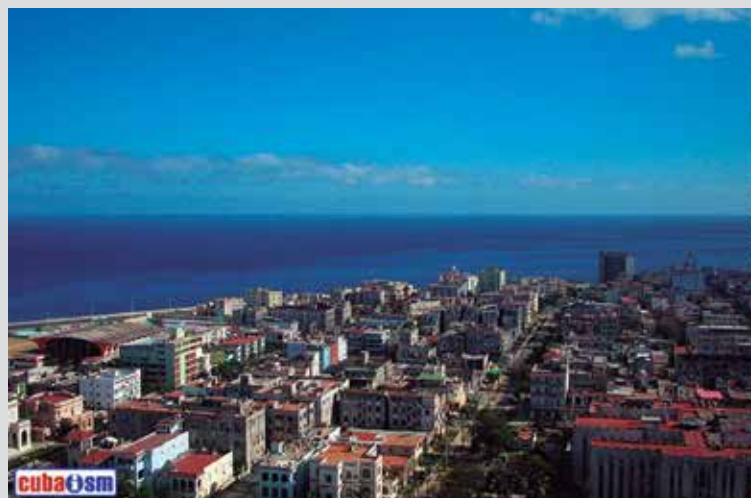
La Habana Cuba

Por ejemplo: La libertad del campesino, radica en poder producir en su tierra, disponer de su fruto y satisfacer así las necesidades de subsistencia y las de su familia. El asunto se complica cuando a ese campesino, le imponen necesidades ficticias y su producto es secuestrado por un mercado que al final le niegan hasta el acceso a su propia producción. Entonces el campesino se convierte en rehén de un sistema y de un mercado que lo convierten en simple maquina de producir y gastar en basura innecesaria. Amen de que debe costear gastos que son propios del Estado, al cual él contribuye a fortalecer y conformar. Paradójicamente los que se benefician del Estado, son las elites pudientes, que desangran las arcas y privatizan los derechos populares para convertirlos en mercancía muy onerosa y cuya administración o propiedad pasa a ser de esas elites, conformando así un círculo vicioso de explotación y saqueo de pueblo a la vez de beneficios burgueses. De tal forma los ladrones, explotadores y sus hijos pagan sus estudios, la asistencia médica, social, económica, etc. Del saqueo del las arcas del Estado, que se nutre a la vez como dije antes, del trabajo y sudor del campesino.