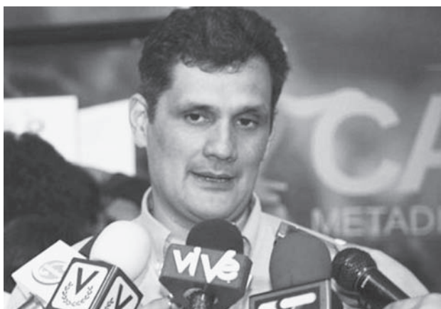
El ministro de Ciencia, Tecnología e Innovación, Manuel Fernández

Al dirigir el acto para celebrar los siete años de la nacionalización de la empresa, Fernández explicó que el 86% de los suscriptores del Acceso a Banda Ancha (Aba) ofrecido