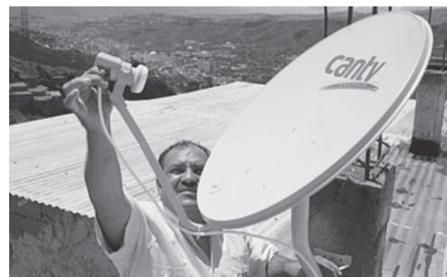
CANTV ha acabado con el monopolio de las cableras privadas