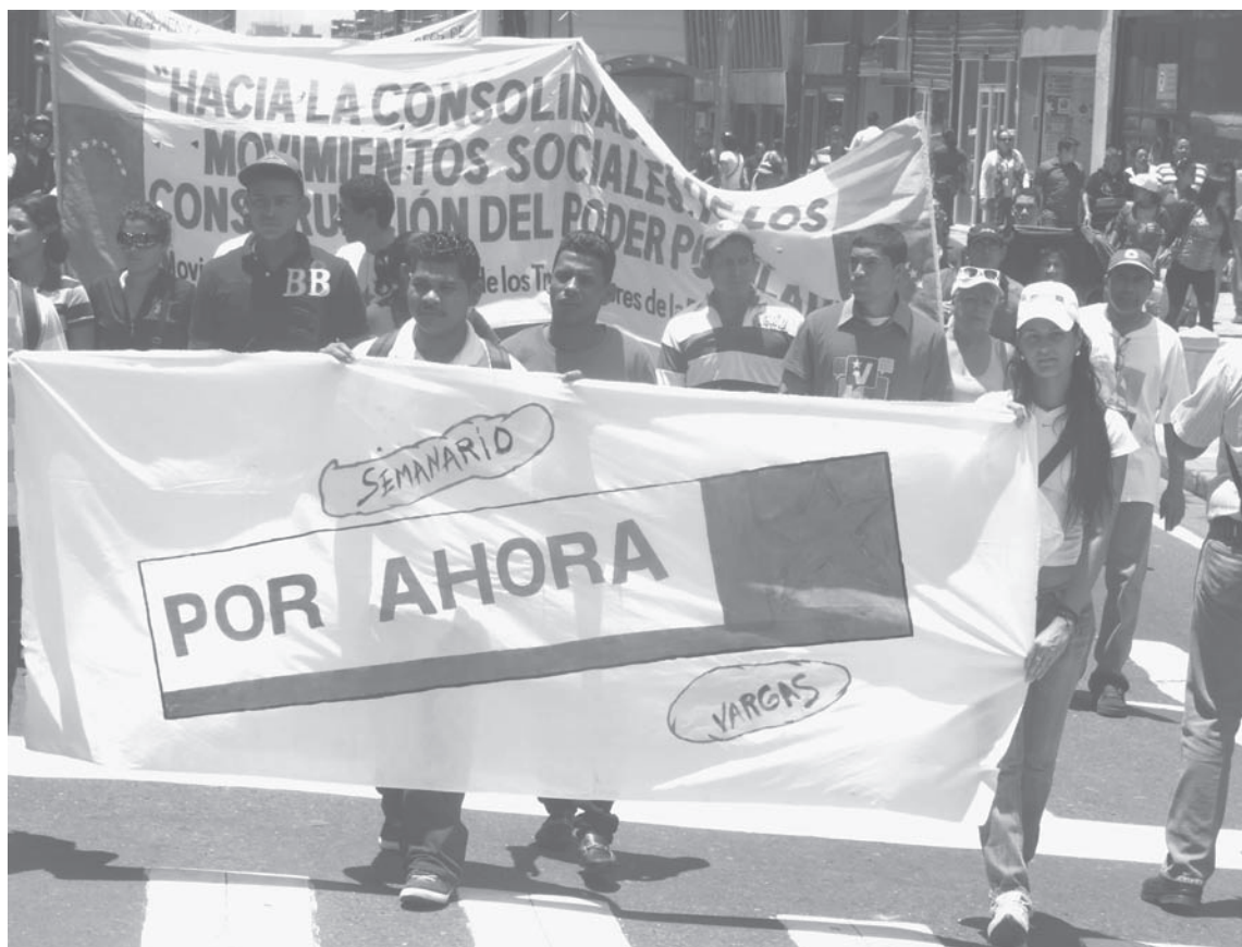
La Comunicación Alternativa y Comunitaria toma las calles

Los MAC-Impresos entramos en barrena; agobiados por los altos costos de las imprentas, (todas en manos de la oligarquía) el burocratismo enquistado en CANTV que retrasó largos meses el aporte de esta solidaria empresa socialista a los MAC ocasionó que la contraofensiva mediática de nuestra parte dirigida a enfrentar la ofensiva del imperialismo desatada contra el país a partir del 12 de febrero se estancara y, en mu-