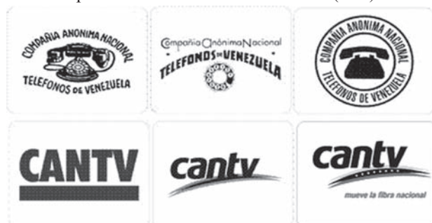
Logos de CANTV en el paso del tiempo