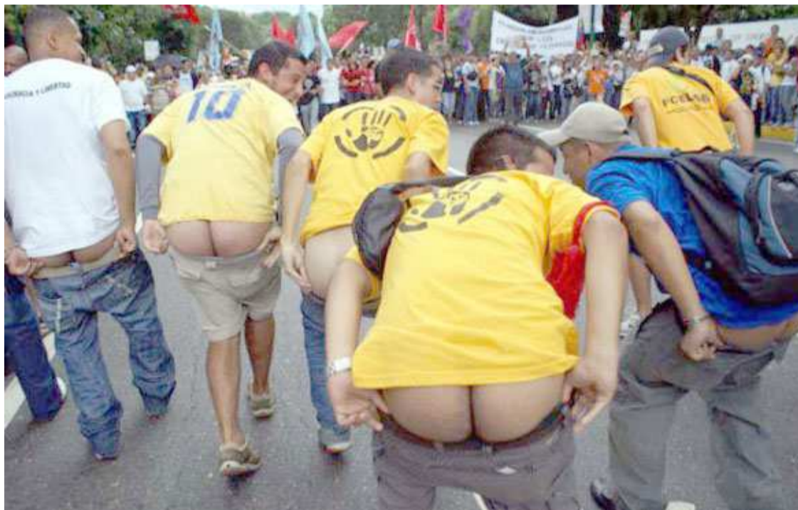
Los “maMitas blancas”. Grupo de jóvenes con alta tendencia a pelar las nalgas a la menor oportunidad, costumbre heredada del “pollo” Salas Feo. Método combativo promovido por el viejo Salas Römer (le gusta que le digan Röemer) que además de ideólogo de esta organización de choque que también se conoce Javu, es el “cuidador” de los verdes que les envían desde la vieja Europa a estos “muchachones”.

Dos viejas figuras de los partidos AD y Copei también están implicados en las comunicaciones electrónicas: el abogado Gustavo