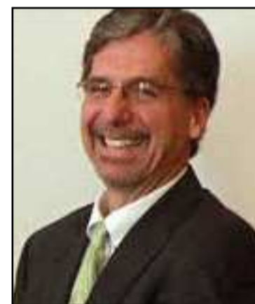
Kevin Whitaker, embajador gringo en la República de Colombia. El gran domador de la fauna neofascista en Venezuela.