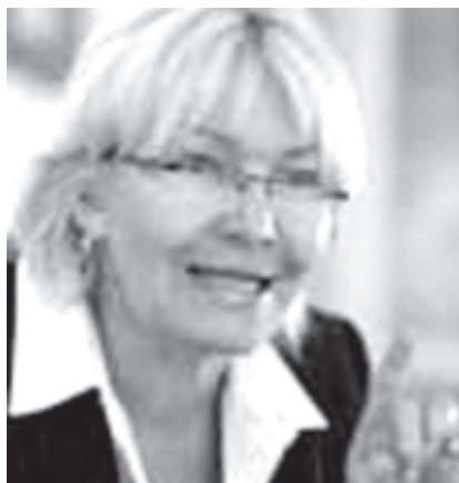
Luisa Ortega Díaz