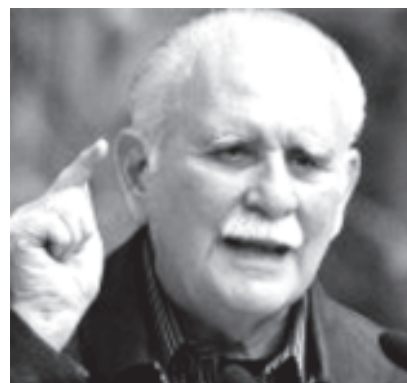
José Vicente Rangel

Dijo que el pueblo venezolano no ha combatido a través de las redes sociales, los medios comunitarios y la información de los medios del Estado, esa guerra mediática con operaciones psicológicas calculadas es un laboratorio, donde los grupos involucrados reciben orientaciones