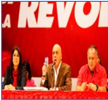
Caracas, 08 Jun. AVN.- El Alto Mando Político de la Revolución Bolivariana prevé presentar al país nuevas pruebas sobre hechos conspirativos que involucran a representantes de la ultraderecha nacional e internacional en un plan de magnicidio contra el presidente de Venezuela, Nicolás Maduro.

“Hay muchas pruebas y estamos muy documentados. Vamos a seguir presentando (pruebas) sin obstaculizar ni entorpecer el desarrollo de la investigación por la Fiscalía General de la República y los Tribunales”, señaló este domingo el dirigente del Alto Mando Político, Jorge Rodríguez, en una entrevista que concedió al periodista José Vicente Rangel.