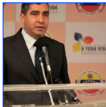
Foto archivo Caracas, 08 Jun. AVN.- El intento de magnicidio que la ultraderecha venezolana ha planificado contra el presidente Nicolás Maduro se inició en 2010, en México, reveló este sábado el ministro de Interiores, Justicia y Paz, Miguel Rodríguez Torres.

Indicó que el plan contemplaba la sedición y terminaba con el magnicidio al Presidente. “Se planificó a partir de 2010 en México, en una reunión con estudiantes”, expresó Rodríguez, en una entrevista con el canal Globovisión.