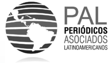
Grupo Periódicos Asociados Latinoamericanos