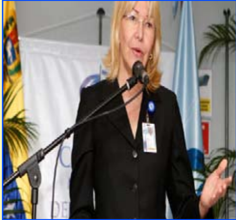
Caracas, 29 Jun. AVN.- “Indudablemente que hay una conjura nacional e internacional contra el Estado venezolano que pasa por atentar contra la vida del presidente de la República, magnicidio, y contra las instituciones”, manifestó la Fiscal General de la República, Luisa Ortega Díaz, en entrevista con el periodista y político José Vicente Rangel, transmitida este domingo por Televen.