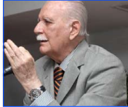
Foto archivo Caracas, 29 Jun. AVN.- El periodista José Vicente Rangel remarcó que la estabilidad de un gobierno surgido de la voluntad popular expresada a través del voto es sagrada. Asimismo consideró inaceptable que haya sectores que concurren a elecciones democráticas libres y transparentes para luego desconocer sus resultados y promover la violencia en las calles.

El señalamiento lo hizo el periodista durante el editorial de su programa José Vicente Hoy, transmitido este domingo por Televen.