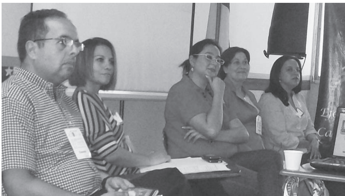
Ponentes respondiendo preguntas de los asistentes

Los temas centrales abordados fueron: Educación emancipadora y pedagogía crítica, Investigación participativa, Comunicación alternativa y comunitaria, Formación inicial y