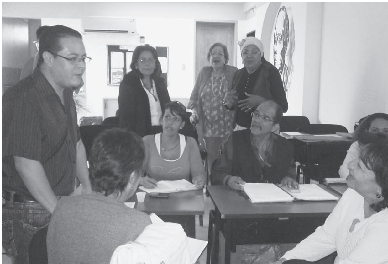
Participantes en acción

* Hacia el fortalecimiento de las capacidades universitarias por la paz y la vida