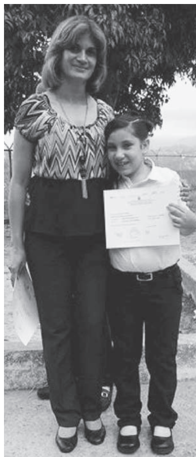
Un año escolar que culminó en éxito

Guillermo Navarro Jr. - Los Teques.- En el marco