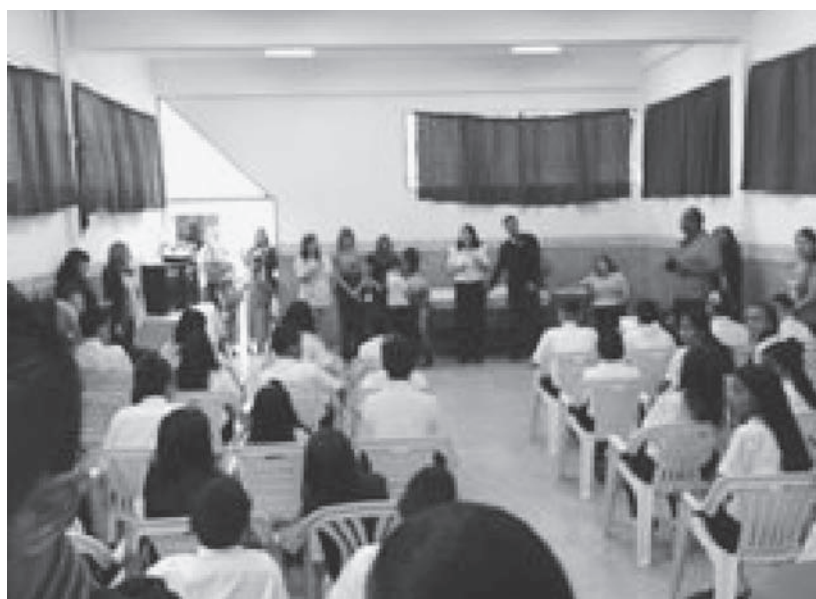
Mucha algarabía en la entrega de sus respectivos certificados

asistencia de la comunidad que se aglomeró con cámaras en mano y en la grabación de videos, pruebas fehacientes del gran momento vivido por los graduandos, y a quienes les desean y auguran éxitos a estos nuevos estudiantes de secundaria en pro de su desarrollo académico en los días por venir! Pa’ lante futuros bachilleres!