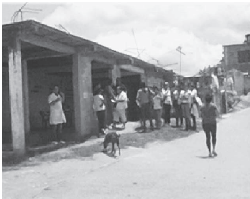
Comunidad Nuevo Bosque beneficiada por la Misión Ayacucho

Por un twit el presidente Nicolás Maduro agradeció a los misioneros y a las UBCH conjuntamente con los ministros y gabinetes políticos, por trabajar sin pausa por la construcción del socialismo.