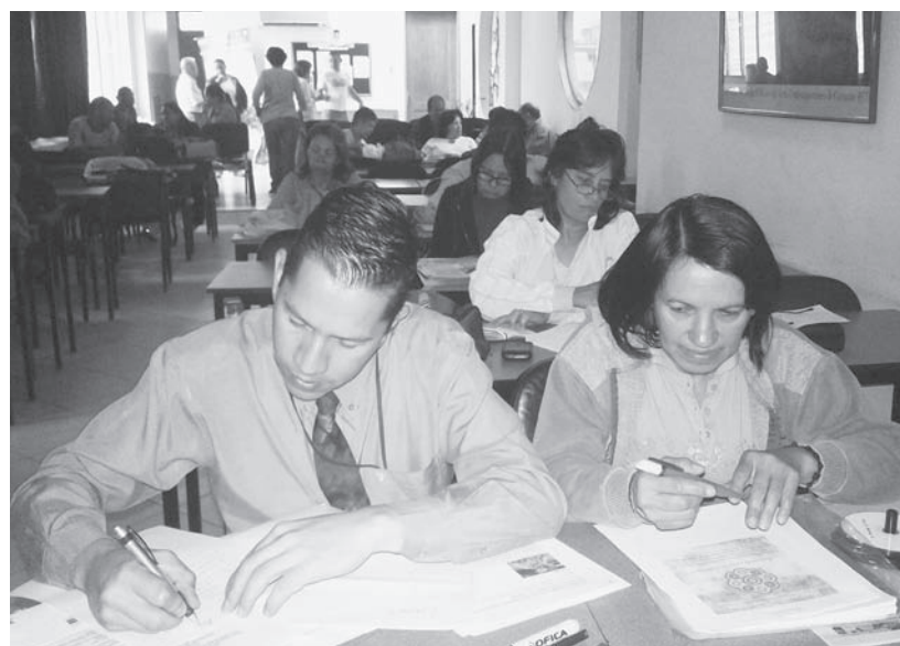
Facilitador e integrantes en una mesa de trabajo