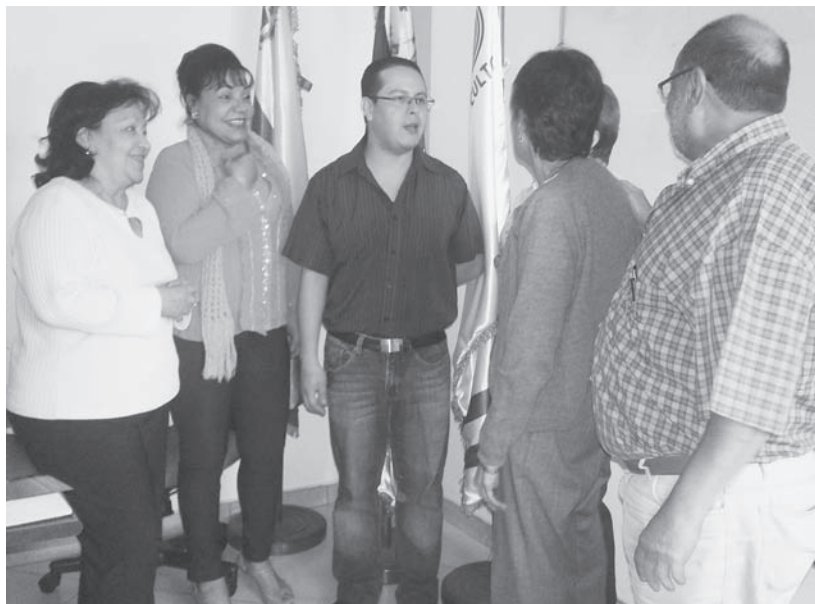
Coordinadoras del Diplomado Por la Paz y representante del Centro Internacional Miranda

El Diplomado en cuestión esta programado hasta el mes de diciembre, donde los participantes presentarán sus propuestas como una contribución en la búsqueda de una cultura de paz.