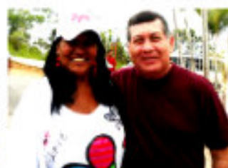
Zaida de El Petarazo junto al Gobernador Rangel Silva

Gobierno y medios alternativos y comunitarios juntos por la paz