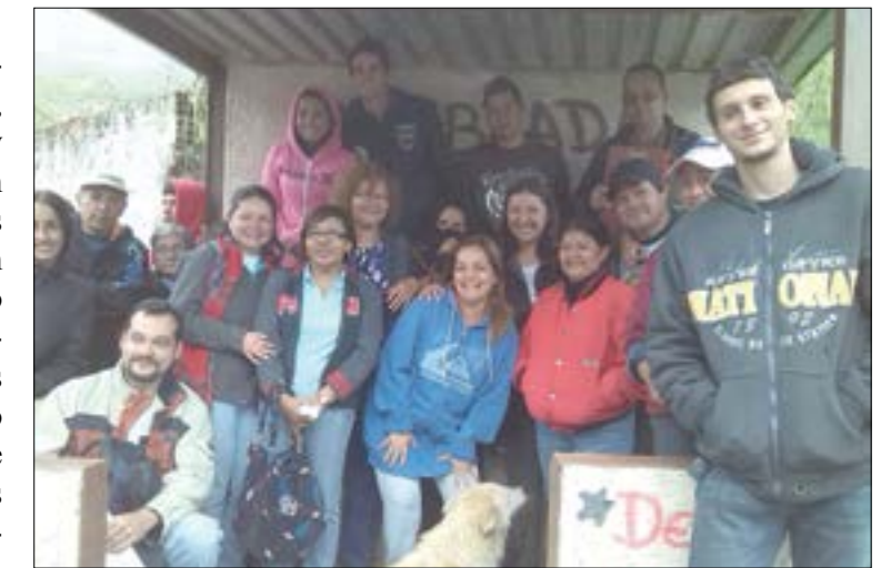
Habitantes del Consejo Comunal "Quebrada de Agua", vía Junquito- Colonia Tovar

Los jóvenes ya no se preocuparán porque no tienen casa, ahora podrán dedicar mayor y mejor tiempo a su preparación y ojala que en el futuro estos muchachos realicen algún emprendimiento productivo aquí", añadió. "Nuestro Comandante Supremo, a inicios del mes de abril de 2011, dijo que construiría 3 millones de viviendas en el país; estas seis casas que se están inaugurando en este sector son parte de la promesa de nuestro comandante, y de la continuidad a la política que le está dando nuestro presidente Nicolás Maduro. Actualmente se está llevando a cabo el Plan Bases de Misiones el mismo que se ejecutará en el Consejo Comunal "Aguacatal" y consta de tres módulos de Atención Primaria y Formación Integral que beneficiara a