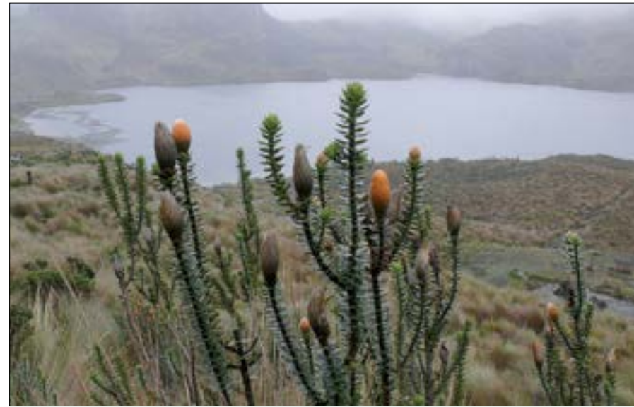
Laguna de las Tres Cruces

En el trayecto de este camino, se encuentran en Ecuador edificaciones de imponderable valor ancestral, sobresalen Ingapirca en Cañar, y Callo (hacienda San Agustín) en Cotopaxi. El Qhapaq Ñan, fue construido en el siglo XII. Varios tramos en la actualidad son visitados por turistas y arqueólogos nacionales e internacionales para disfrutar de sus misterios y espectacularidad, así como también para crear contextos históricos relacionados a culturas antiguas.