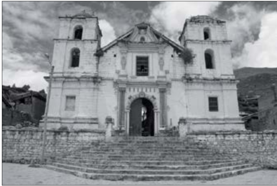
Catedral de Quito

Q uito es una larga historia de cuentos, de leyendas, de una cultura oral que se transmite de generación a