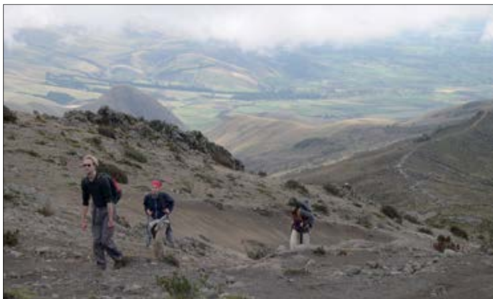
Camino de los Incas