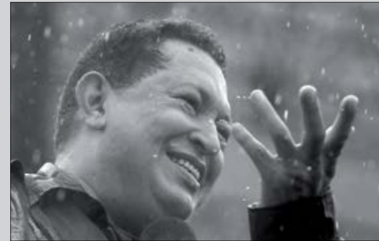
Comandante Hugo Rafael Chávez

El diputado sostiene que gracias a Chávez, existe democracia participativa y protagónica en Venezuela, América Latina