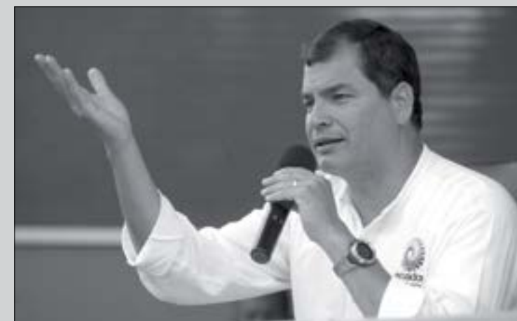
Presidente Rafael Correa

Esta semana, la Asamblea Nacional espera remitir al Presidente el proyecto de Ley de Código Orgánico Monetario y Financiero que fue aprobado en el Legislativo. Su último acto oficial fue entre el 15 al 17 de julio, cuando viajó a