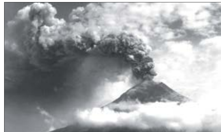
Volcán Tungurahua, despidiendo grandes fumarolas de humo

Esto se produce luego de que el volcán se mantuviera en niveles bajos por casi dos meses. Ayer se detectó la presencia de una columna de emisión con una carga de moderada a alta de ceniza, que sobrepasó los 1000 m de altura sobre el cráter, moviéndose en dirección al noroeste.