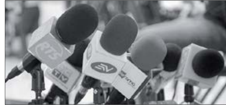
El proceso contará con certificación, tecnologías y titulaciones de tercero y cuarto nivel

El Cordicom identificó a alrededor de 5.000 interesados en acceder a este beneficio. Según el ministro de Relaciones Laborales, Carlos Marx Carrasco,