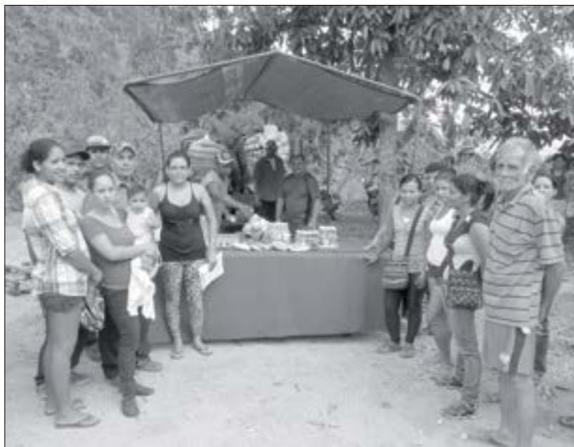
Comunidad de los Rastrojos Cagüita, recibieron la visita de Mercal

El jueves 31 de julio fue visitado por Mercal, el Consejo Comunal Rastrojos-Cagüita, ubicado en la carretera El Limón-Puerto Cruz, Parroquia Carayaca, Estado Vargas. Dán-