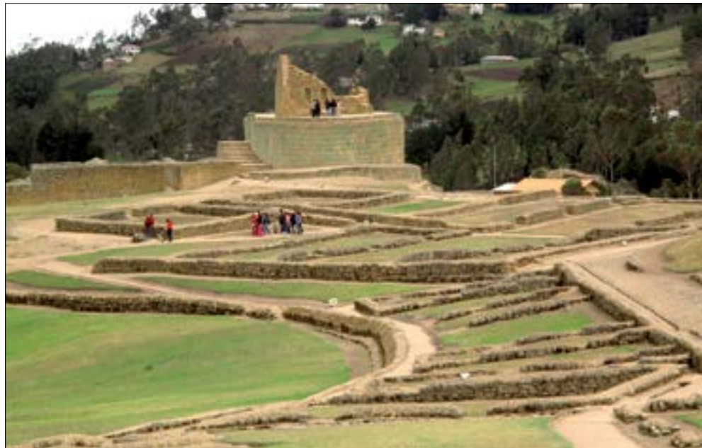
Ruinas de Ingapirca (Imperio Inca)

Por último están el Ruñanan o de tercera categoría, que unía áreas de importancia productiva, y el Chaquiñán, una especie de caminos vecinales para unir comunidades cercanas.