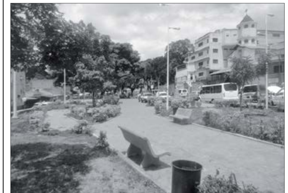
Plaza Lisandro Alvarado, Propatria

En el oeste de Caracas se ha extendido el Programa WiFi para Tod@s permitiendo llegar a lugares como: Plaza Catia, Plaza Los Liceos, Plaza Los Caobos, Plaza Cristóbal Rojas, Plaza San Lorenzo, Plaza La Candelaria, Plaza San Agustín, Plaza Madariaga y Plaza La Pastora, para un total de 474 plazas en todo el país dentro de los más de 2.600 sitios conectados en todo el país.