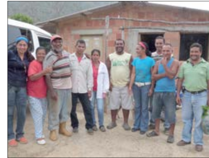
Habitantes del Consejo Comunal "San Esteban", recibiendo la visita de Voceros de la Comuna Hugo Chávez II