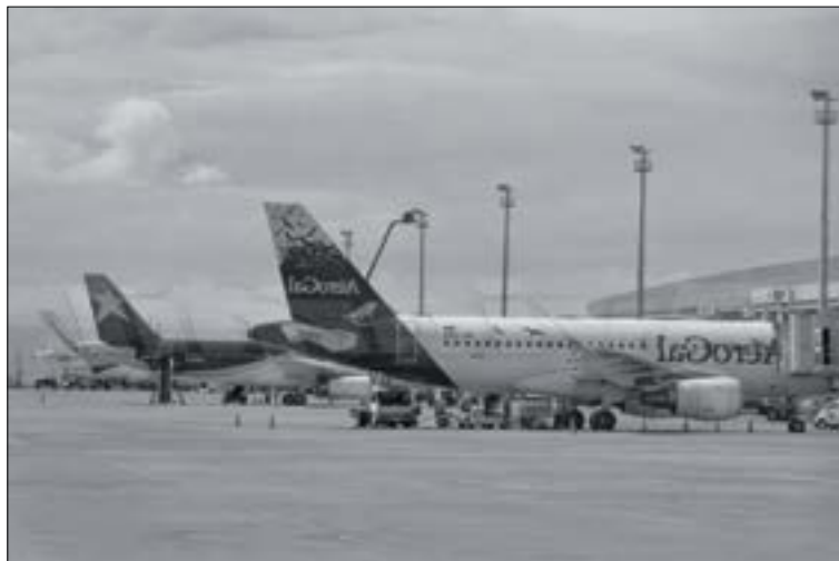
Aeropuerto Mariscal Sucre - Ecuador

Desde febrero de 2013, cuando fue inaugurado el Aeropuerto Mariscal Sucre, hasta este mes, se han realizado 100.000 operaciones seguras, entendidas como despegues y aterrizajes, de acuerdo a información difundida por la autoridad aeroportuaria del Ecuador. En los primeros días de inaugurado el Aeropuerto de Tababela, se manejaba una separación de 10 millas entre aeronaves, y actualmente la separación se redujo a la mitad, de 5 millas.