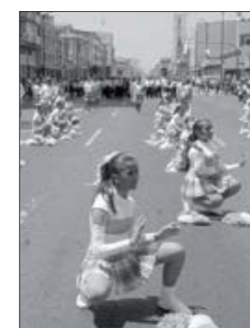
Guayaquil vive sus fiestas

En tanto, en el sur, en la Primera Zona Naval, se desarrollaba a esa hora el desfile por los 73 años del combate naval