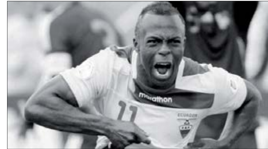
Christian Benítez, exdelantero de la Selección de Ecuador

E l bailecito en el banderín del 'córner' al celebrar un gol, el 11 dibujado en su cabeza, una gran marca de