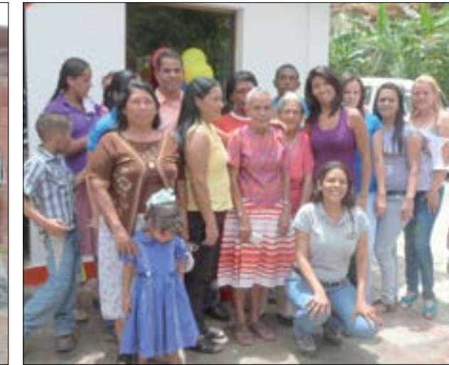
Beneficiarias de las casas construidas