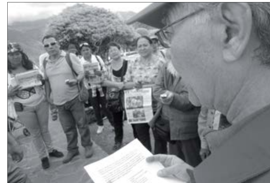
Durante la lectura del manifiesto de los MAC

Los medios alternativos y comunitarios en su mayoría impresos vienen realizando una serie de eventos pronunciándose a favor de la paz mundial.