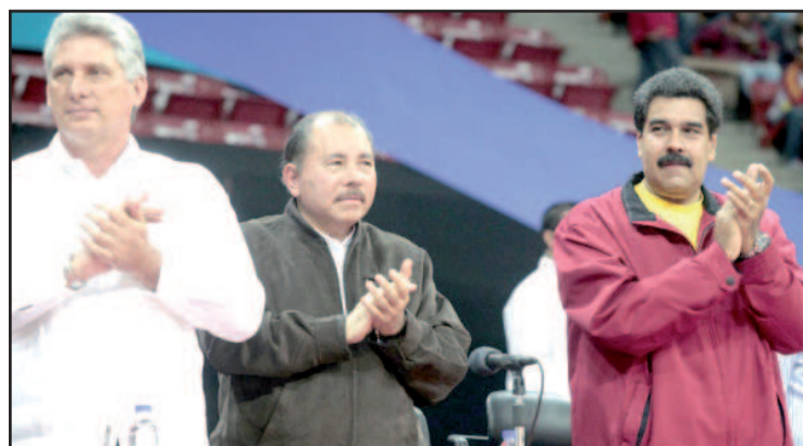
El Vicepresidente de Cuba, Miguel Díaz Canel, Daniel Ortega y el Presidente Nicolás Maduro

Asimismo, apuntó que las batallas son permanentes, por eso se debe ejercer la práctica solidaria como un modo de vida, "es allí donde está la enorme fuerza moral que les heredó Chávez a ustedes, y que nos heredó Chávez a todos en este planeta". ★