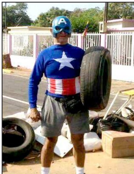
Por si no me conocen, este soy yo “El comandante importado”. Yo era el que salía pa'lante en las acciones más arriesgadas y por eso me regalaron esta senda pinta de Capitán, América.