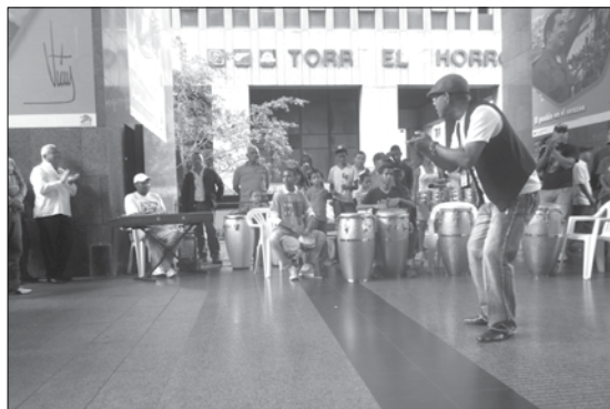
Guapacha y sus muchachos