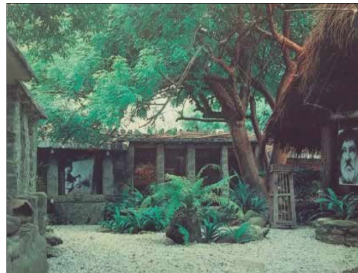
El Castillete de Reverón

Los vecinos de Macuto, organizados en la Comuna Guaicamacuto, junto al Ministerio del Poder Popular para la Cultura y las autoridades regionales del estado Vargas, continúan los preparativos para la ejecución del proyecto de restauración patrimonial de El Castillete, antigua residencia del pintor venezolano Armando Reverón.