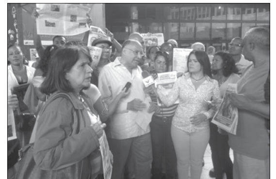
Miguel Ugas da Rueda de Prensa