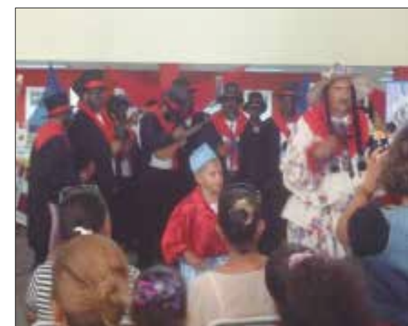
La Parranda de San Pedro