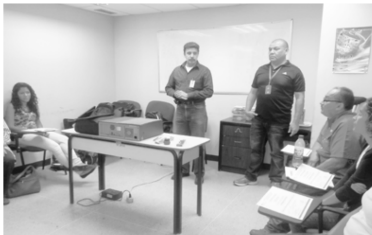
Por Felicia Jiménez.